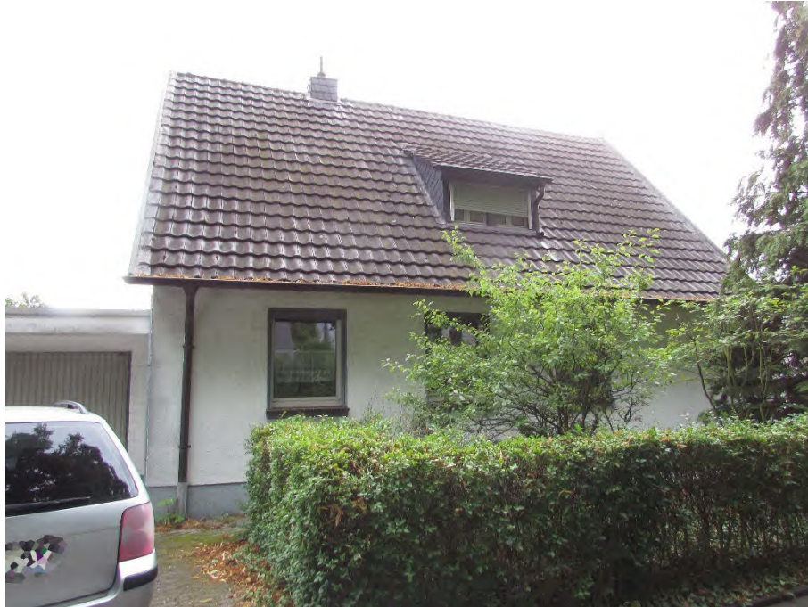
Foto 1: Wohnhaus "Gelsdorfer Straße XX", 53340 Meckenheim, Straßenansicht