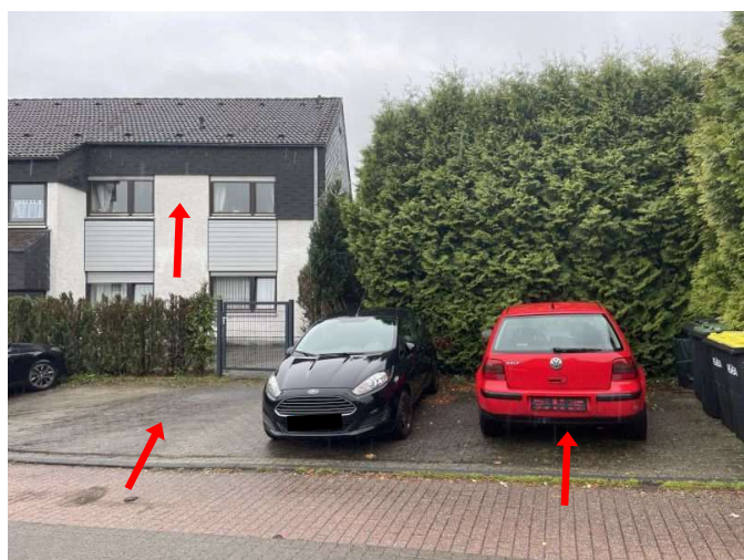
Pkw-Stellplätze Nr. 3 und Nr. 6 (Sondernutzungsrechte)