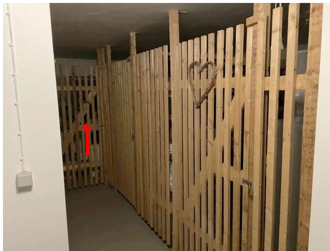
Kellerraum Nr. 3