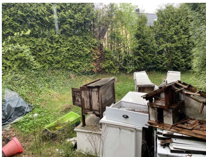
Sondernutzungsrecht an der Grünfläche Nr. 3