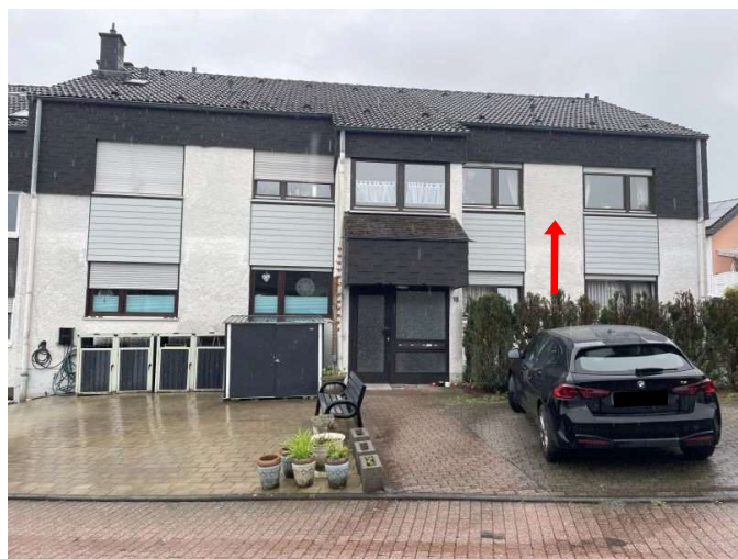
Franz-Martin-Straße 18, 20