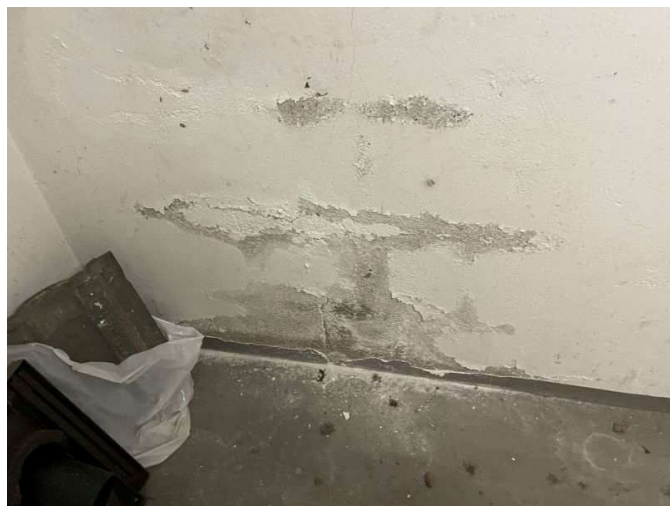
Feuchtigkeitserscheinungen im Kellergeschoss