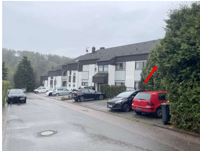
Stichstraße der Franz-Martin-Straße