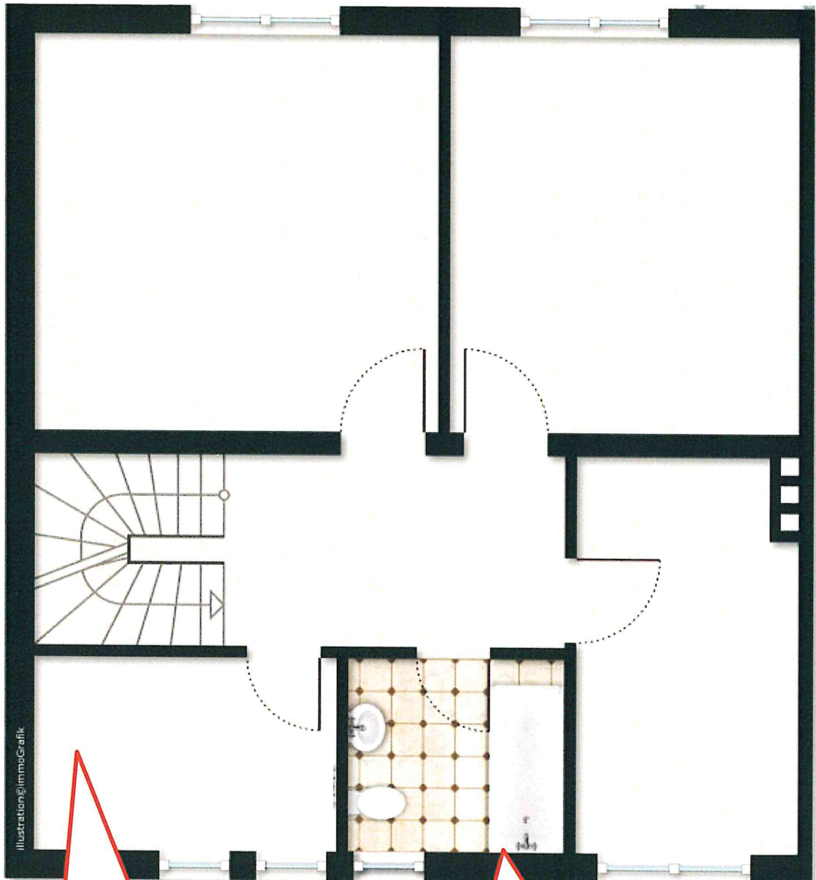
Illustration © Jimma Grafik

Grundriss Erdgeschoss (Abweichungen möglich)