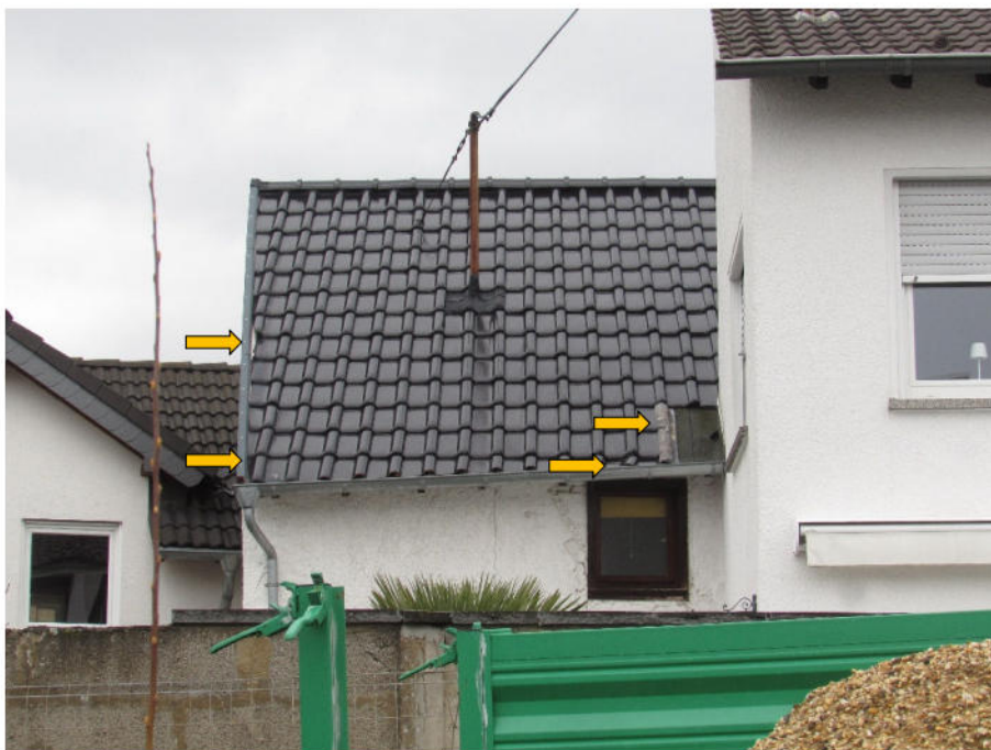
Foto 4: Wohnhaus, Rückansicht, nicht ordnungsgemäß erstellte Dacheindeckung