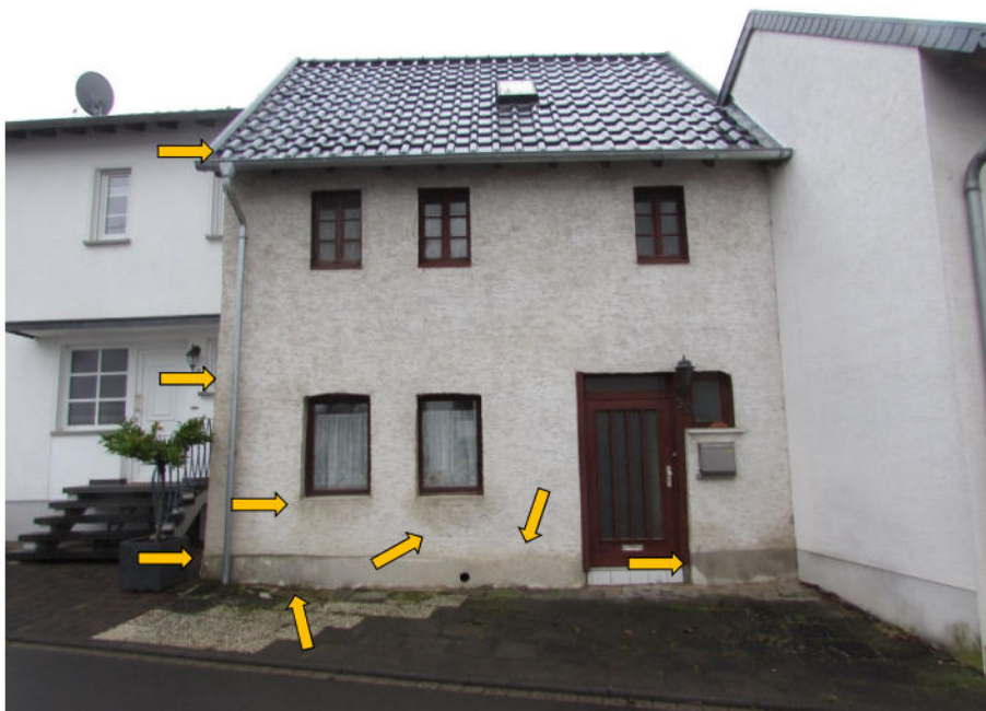
Foto 2: Wohnhaus, Straßenansicht, Feuchtigkeit an der Fassade, unebene Dachziegel