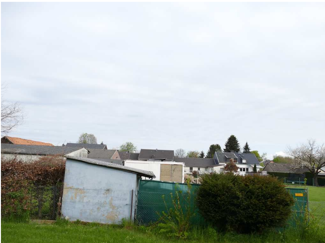
Bild 3: Rückansicht von der südlichen Grundstücksgrenze (Blick nach Norden)