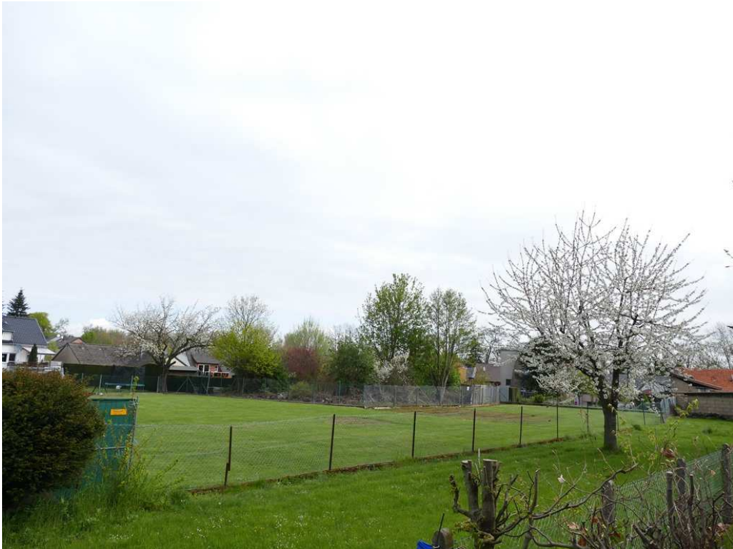
Bild 2: rückwärtige Wiesengrundstücke Teilgrundstückstücke a bzw. e (Blick nach Nordosten)