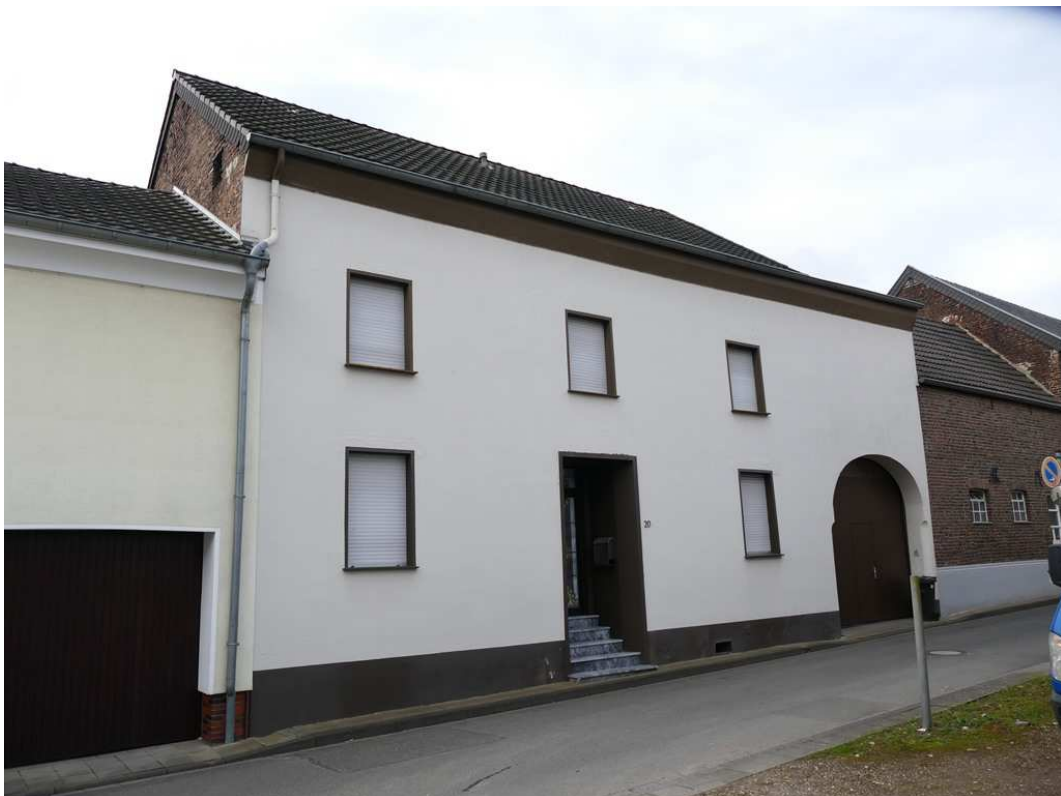
Bild 1: Frontansicht straßenseitiges Wohnhaus mit Tordurchfahrt auf Teilgrundstück a (Blick nach Südwesten)