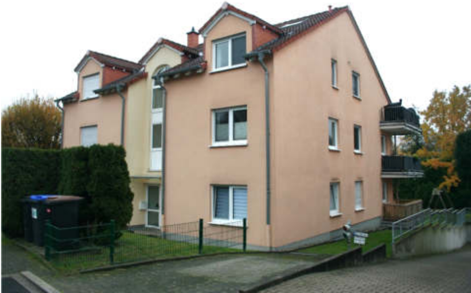
Bild 3: Straßenansicht Beisenweg 5 / Südwestansicht u. Südostgiebel