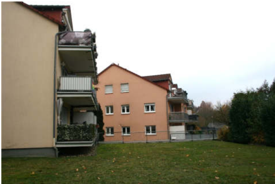
Bild 12: rückseitige Rasenfläche über der Tiefgarage / Südansicht Beisenweg 1