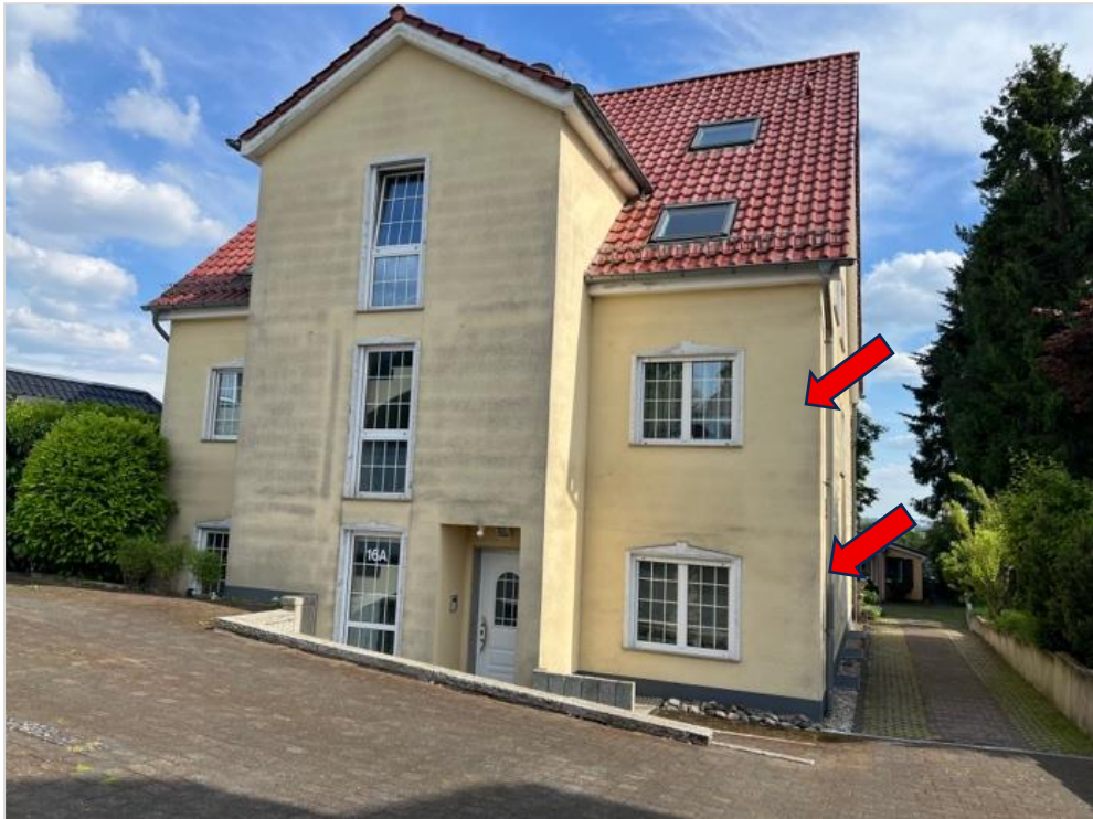
Nordfront 4-Familienhaus Obere Holzstr. 16a Lage Wohneigentum Nr. 2 (EG, OG)