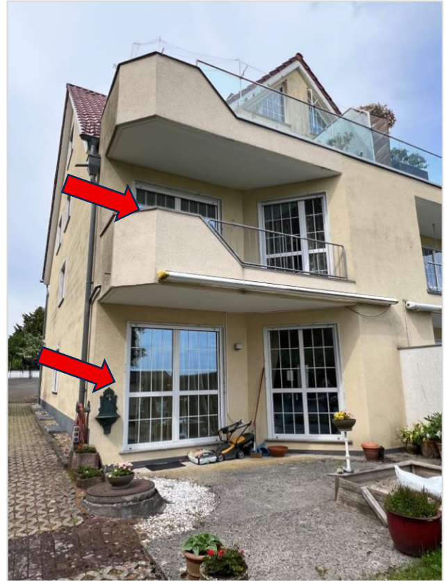
Wohneigentum Nr. 2 im EG mit Terrasse und anschließender Gartenfläche und im OG mit Balkon