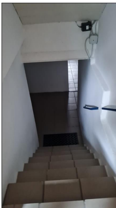
14) Blick in den Keller