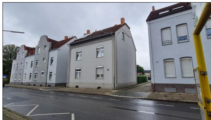
2) Straßenansicht Zufahrt