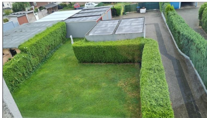
8) Garten/ Zufahrt zu den Garagen auf dem Nachbargrundstück (durch Baulast gesichert)