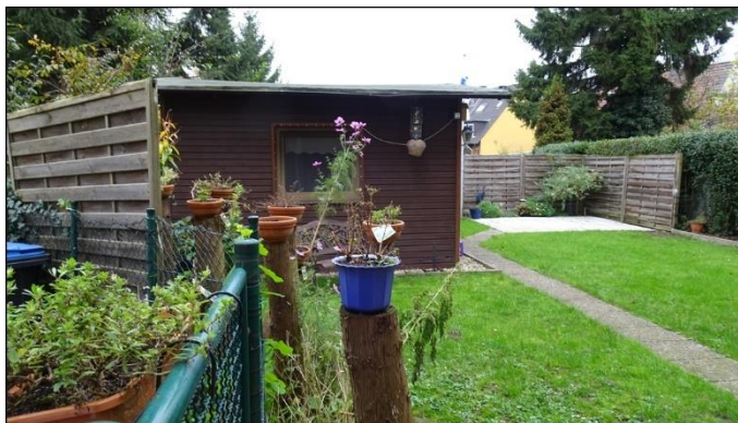
7) Gartenfläche im Sondernutzungsrecht der Erdgeschosswohnung