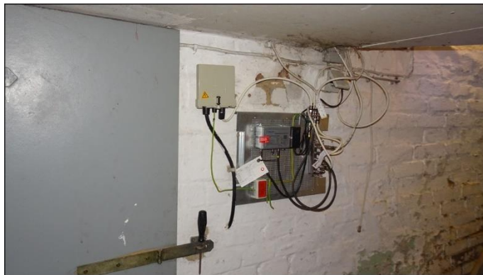
14) Keller / Anschluss Kabelfernsehen