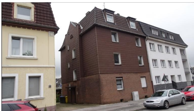
2) Straßen- und Giebelansicht