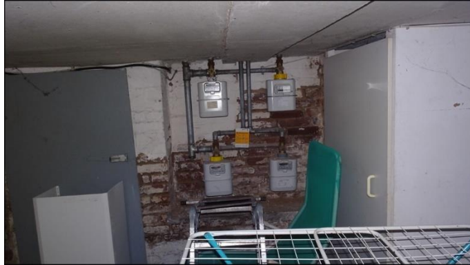
13) Keller/ Gaszähler