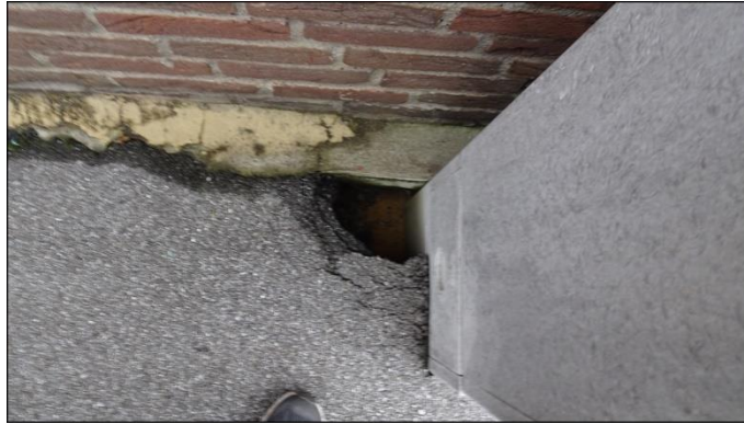
4) Gehwegschäden an der Straßenseite