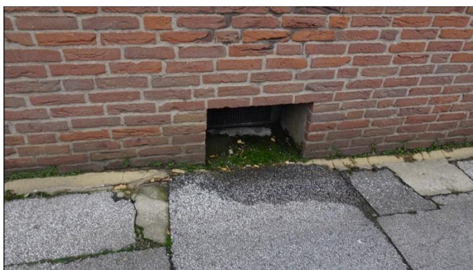
3) Kellerfenster/ Straßenseite