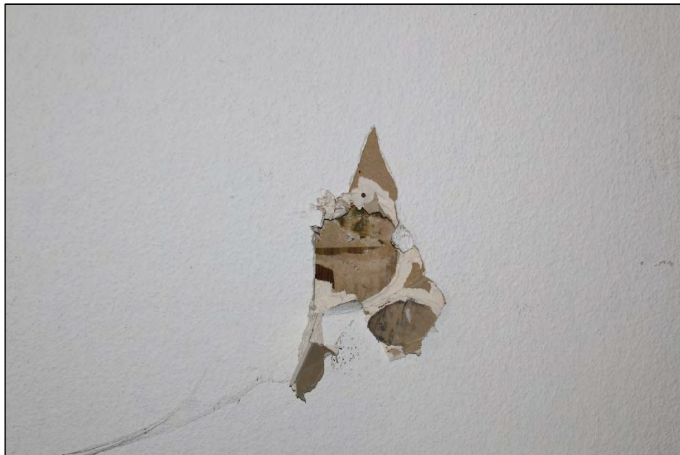
Foto Nr. 35: Gewerbeeinheit links, Erdgeschoss, Schäden Wandverkleidung