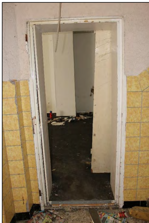
Foto Nr. 26: Gemeinschaftstreppehaus, Erdgeschoss, Zugang Gewerbeeinheit links