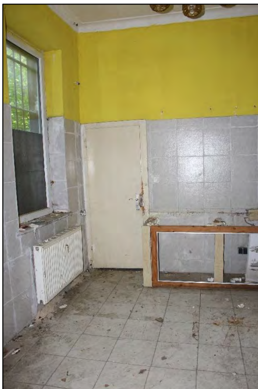
Foto Nr. 22: Gewerbeeinheit rechts, Erdgeschoss, Ladenlokal, rückwärtiger Ladenbereich