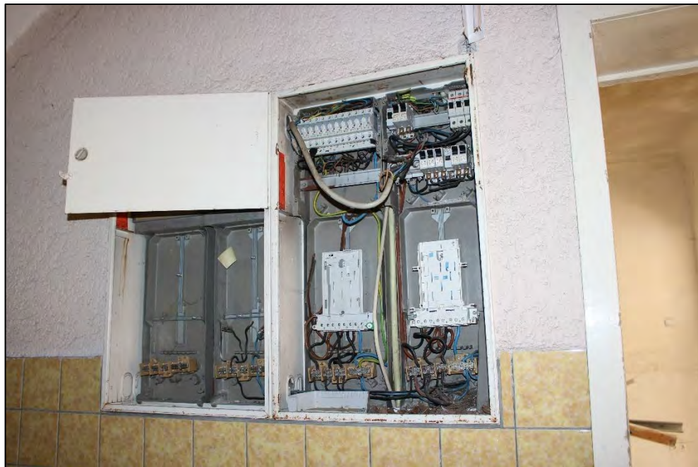
Foto Nr. 25: Gemeinschaftstreppehaus, Erdgeschoss, Elektrounterverteilung