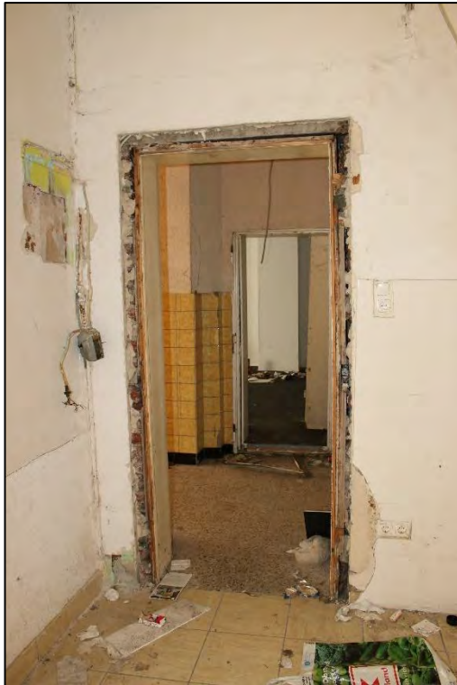
Foto Nr. 23: Gewerbeeinheit rechts, Erdgeschoss, Zugang zum Treppenhaus