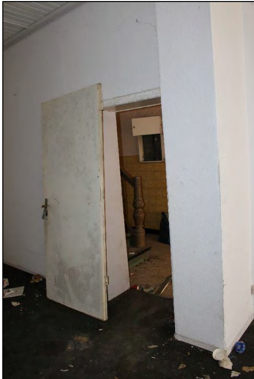
Foto Nr. 29: Gewerbeeinheit links, Erdgeschoss, Zugang zum Treppenhaus