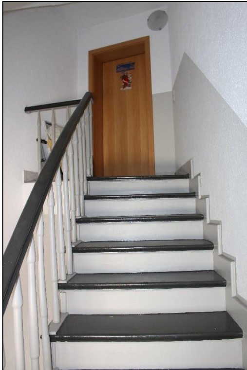
Foto Nr. 21: Gemeinschaftstreppe, Dachgeschoss, Eingang zur ETW Nr. 4