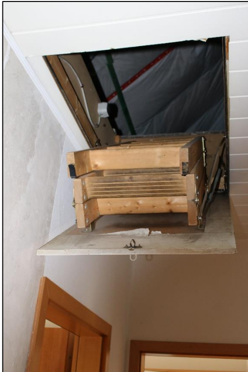
Foto Nr. 23: Dachgeschoss, ETW Nr. 4, Diele / Bodeneinschubtreppe