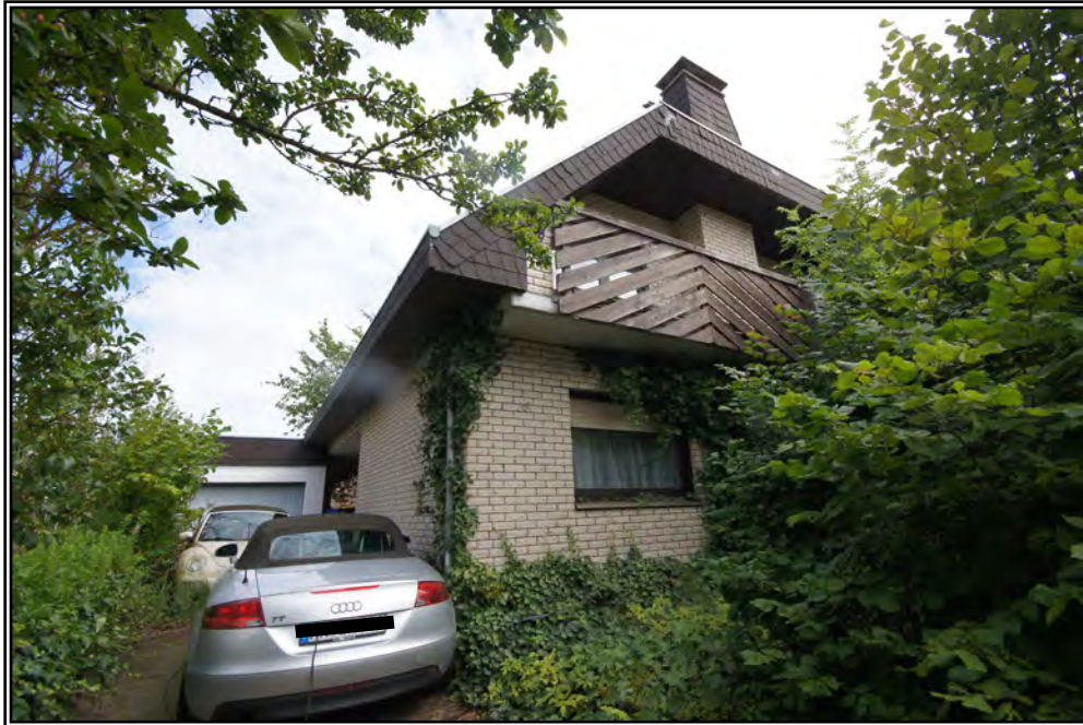
Ansicht von Nordwesten