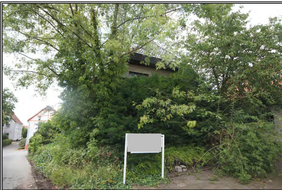
Rückwärtige Ansicht von Südosten