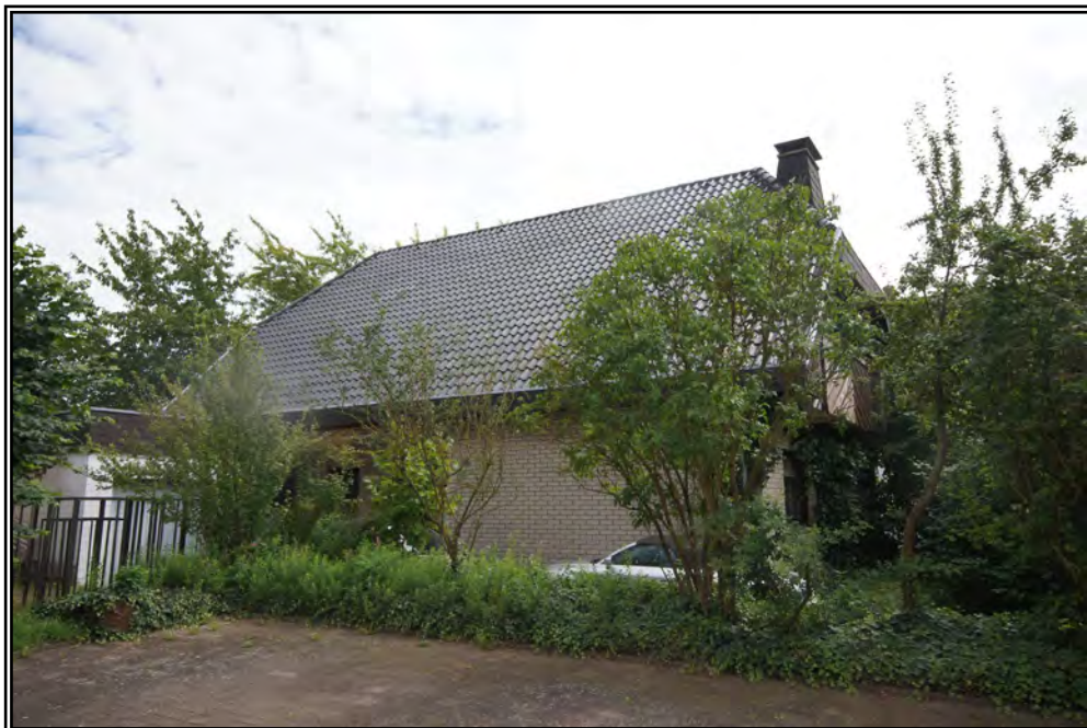
Ansicht von Norden