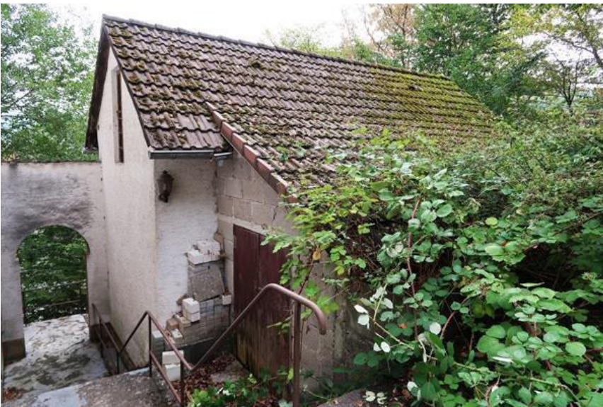
Stallgebäude – hangseitiger Anbau ohne Baugenehmigung, Außenwand unverputzt.