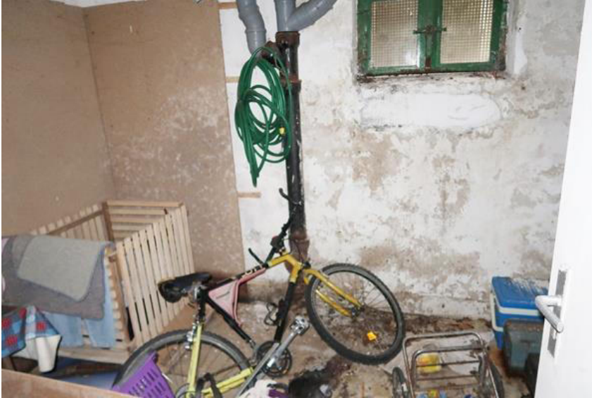
Abstellräume im Keller mit deutlichen Spuren der Feuchteinwirkung