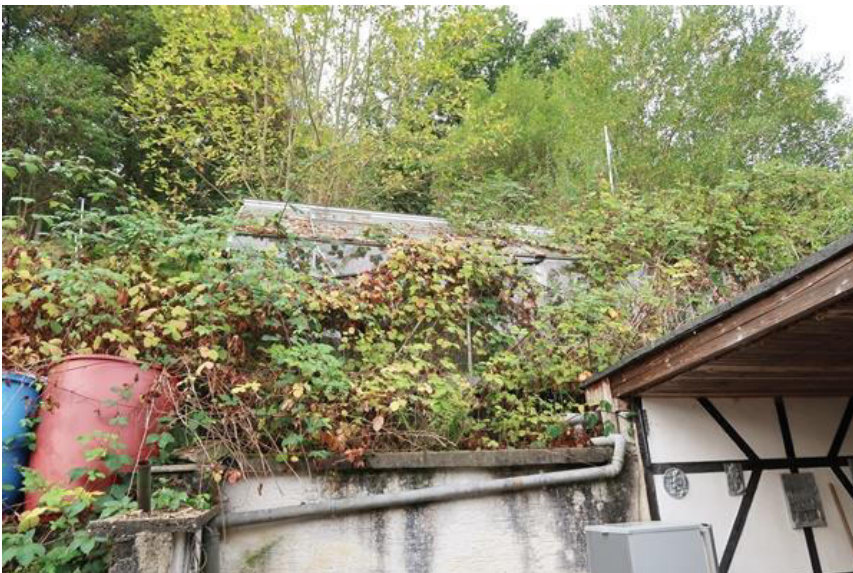
Blick auf das Gartengrundstück mit Gewächshaus (wurde nicht besichtigt)