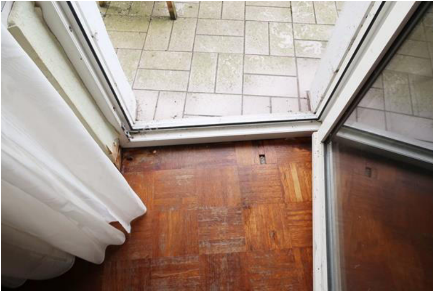
Schäden am Bodenbelag und Feuchtigkeitsspuren in der Balkontür – Laibung und im Estrich