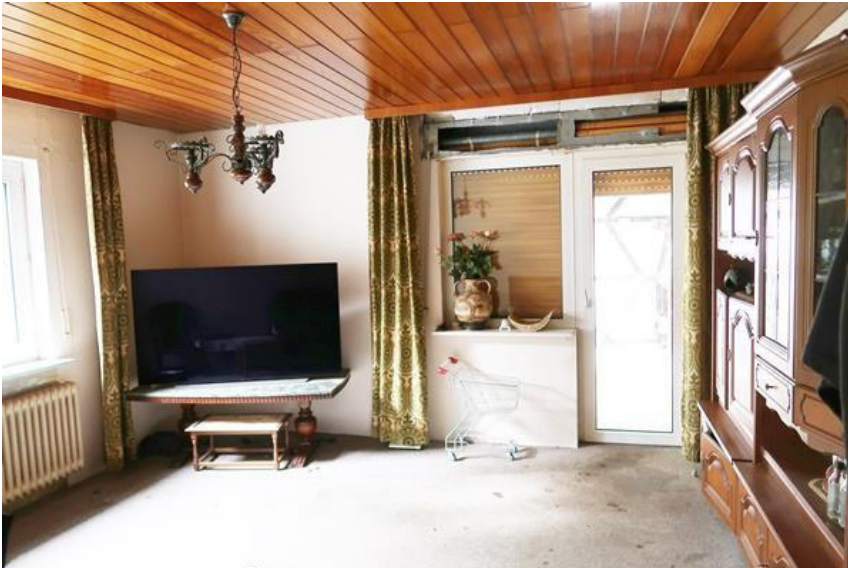
Wohnraum im Anbau – Rollladenkasten ohne Deckel