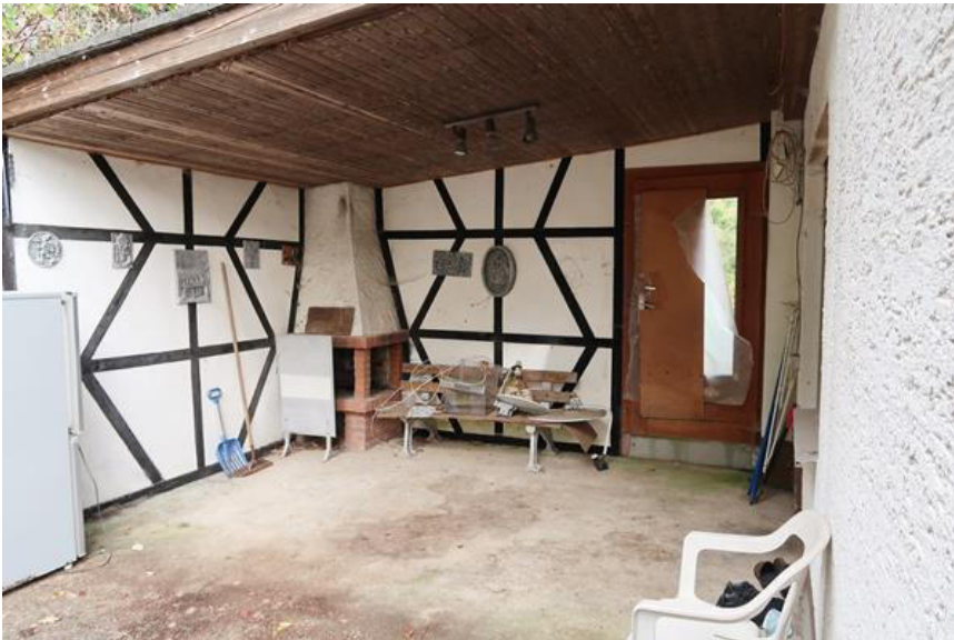
Terrasse am Wohnraum – Anbau