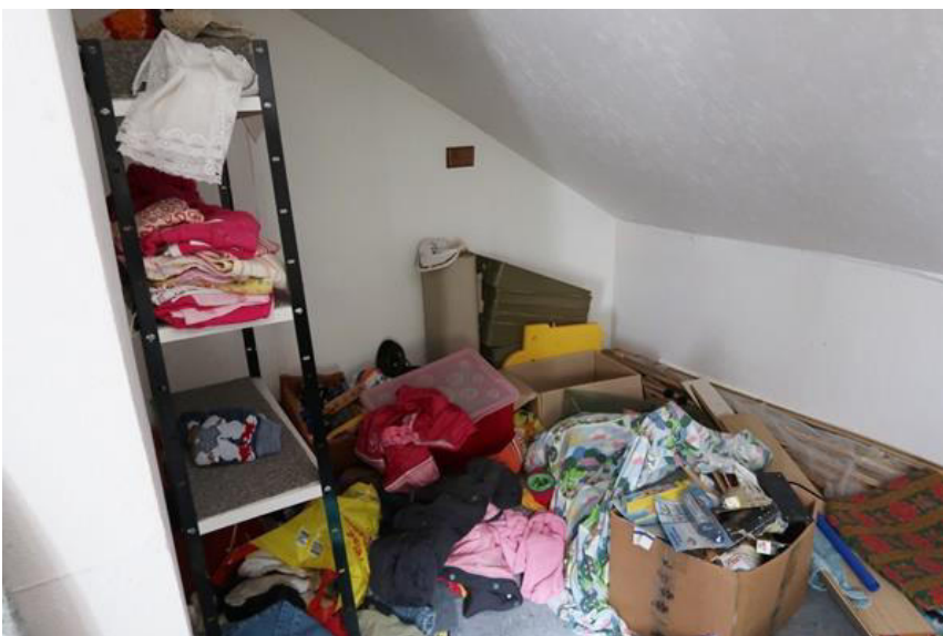
Abstellraum im Dach