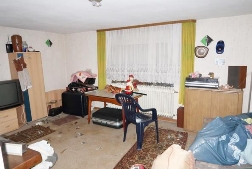
Zu Wohnzwecken ausgebauter Kellerraum – aufgrund der Feuchtigkeit nicht als Wohnraum nutzbar.