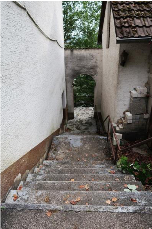
Fortsetzung Treppenaufgang zum Haus zwischen Wohnge- bäude und Stallgebäude