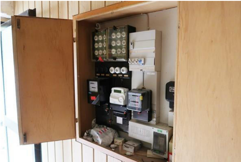
Zählerschrank Elektro im Eingangsbereich