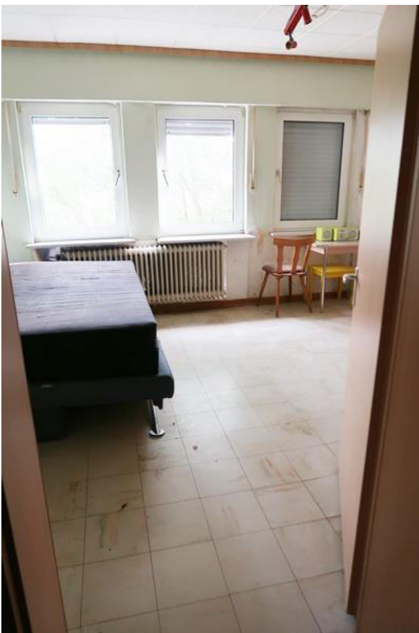
Schlafzimmer mit ursprünglichem Bodenbelag und Styropor – Deckenbekleidung