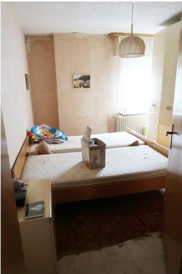
Eines der Schlafzimmer – ursprünglicher Bodenbelag, Styropor – Deckenbekleidung

Boden mit ursprünglichem Plattenbelag, Müll