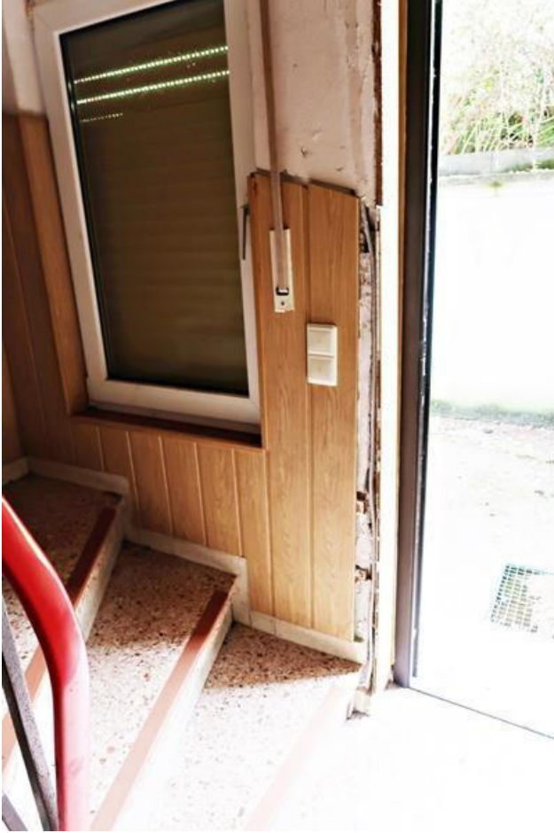
Putz- und Mauerwerksschaden im Bereich der Haustür - Lai- bung