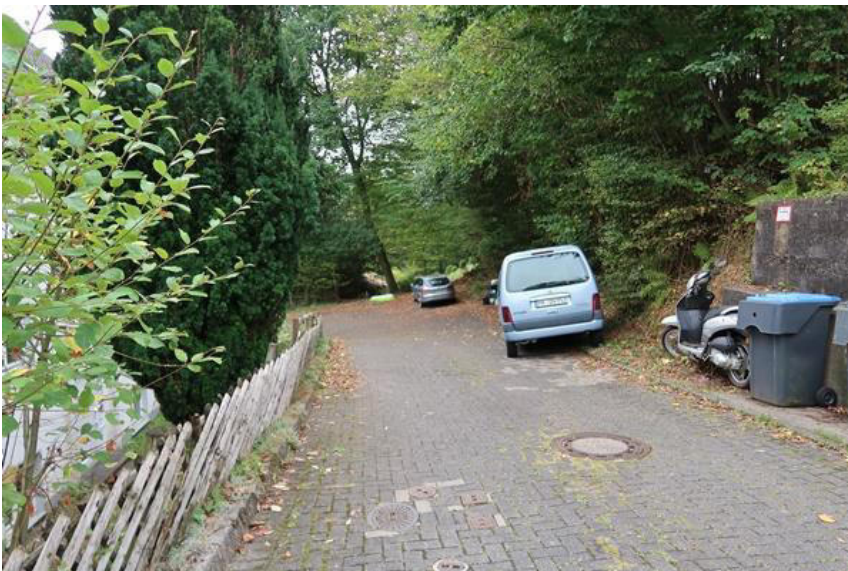
Die Straße Im Steinsiepen endet als Sackgasse wenige Meter weiter.