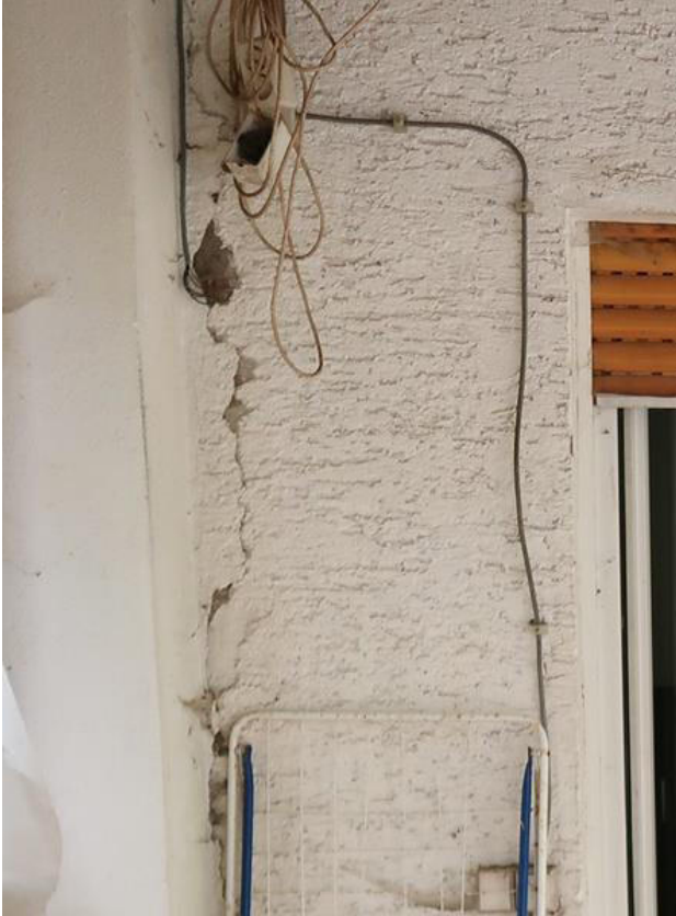
Mauerwerksriss neben der Terrassentür