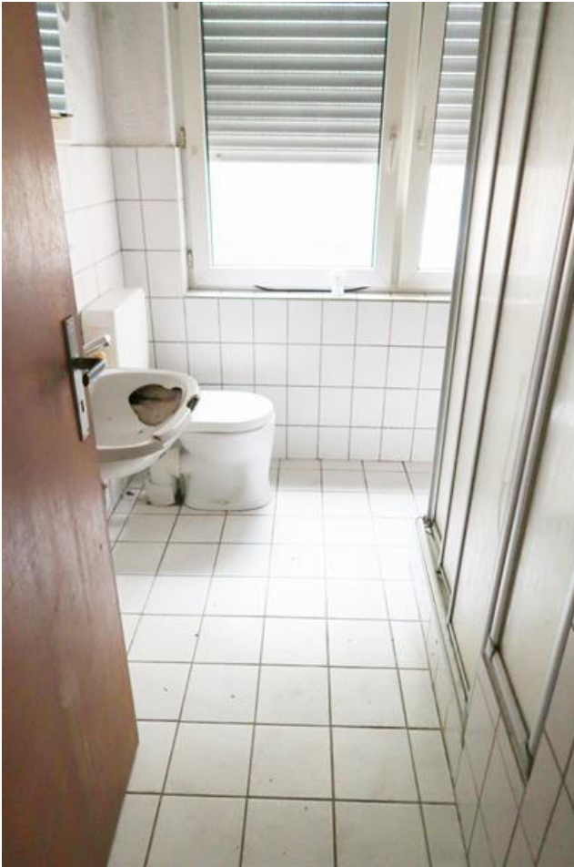
Badezimmer mit Dusche, WC und Waschbecken