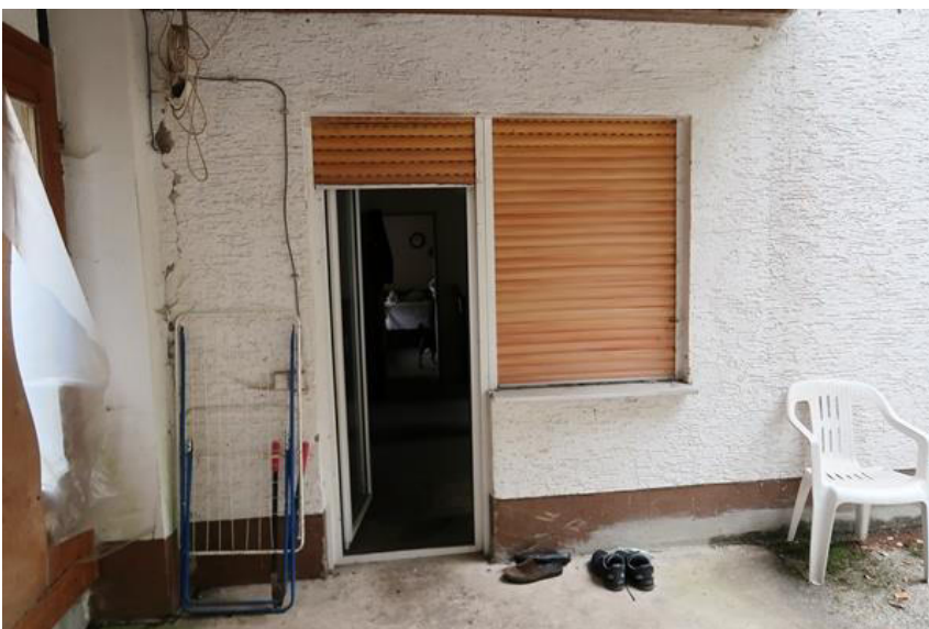
Zugang zur Terrasse