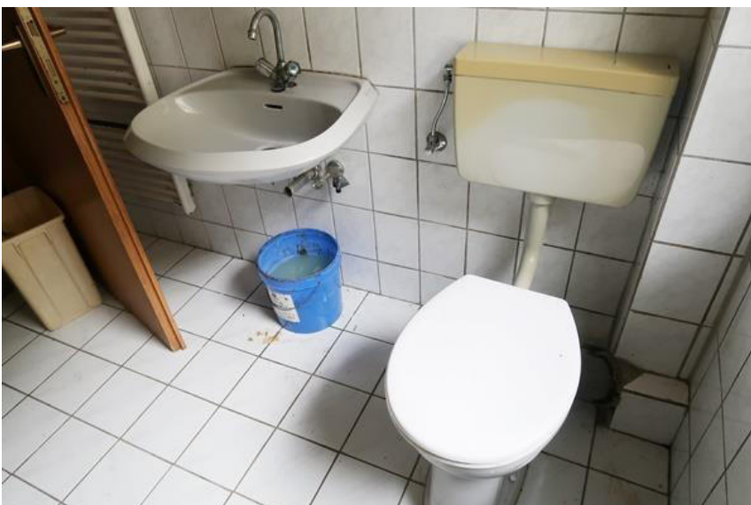
Waschbecken ohne Ablauf