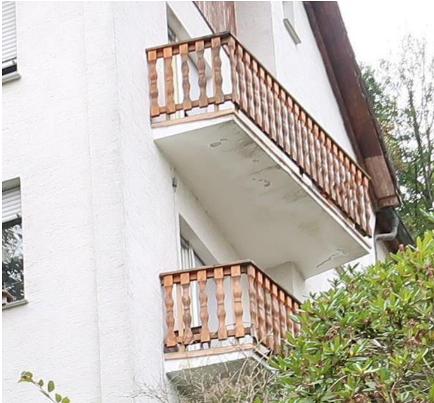
Feuchteschäden an beiden Balkonen unterseitig sichtbar.