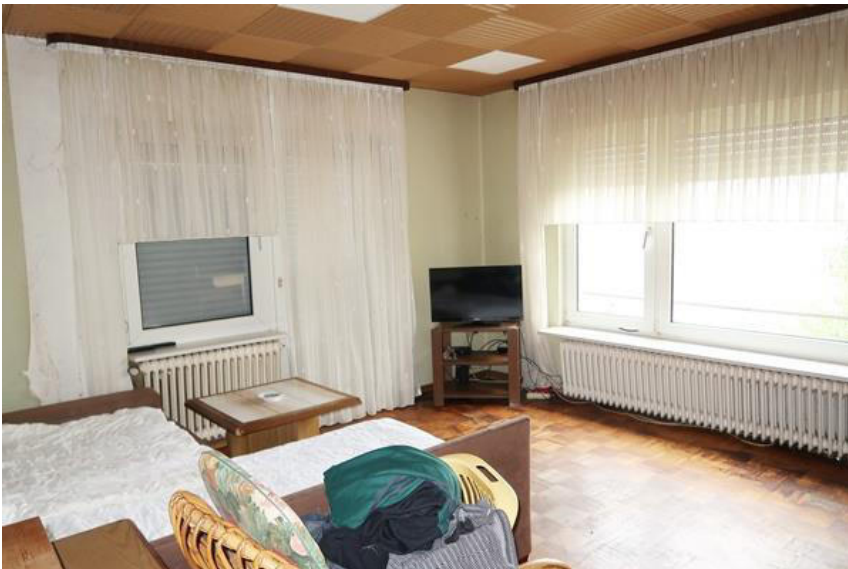
Wohnzimmer mit Styropor Deckenbekleidung und diversen Fehlstellen