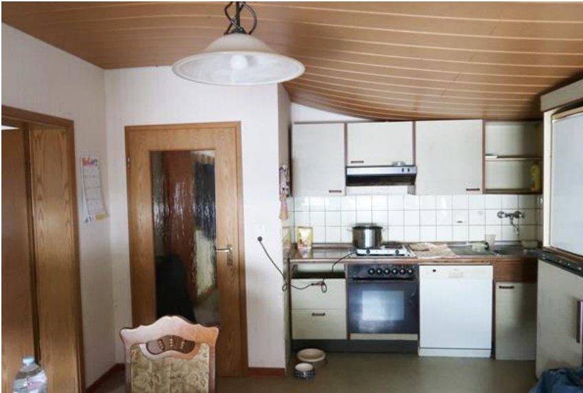
Küche – Deckenpaneele haben sich infolge Feuchtigkeitseintritt im Dach gelöst