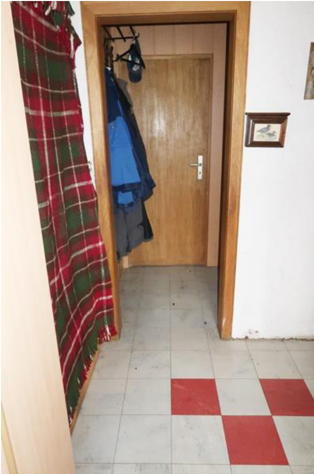
Flur mit ursprünglichem Bodenbelag