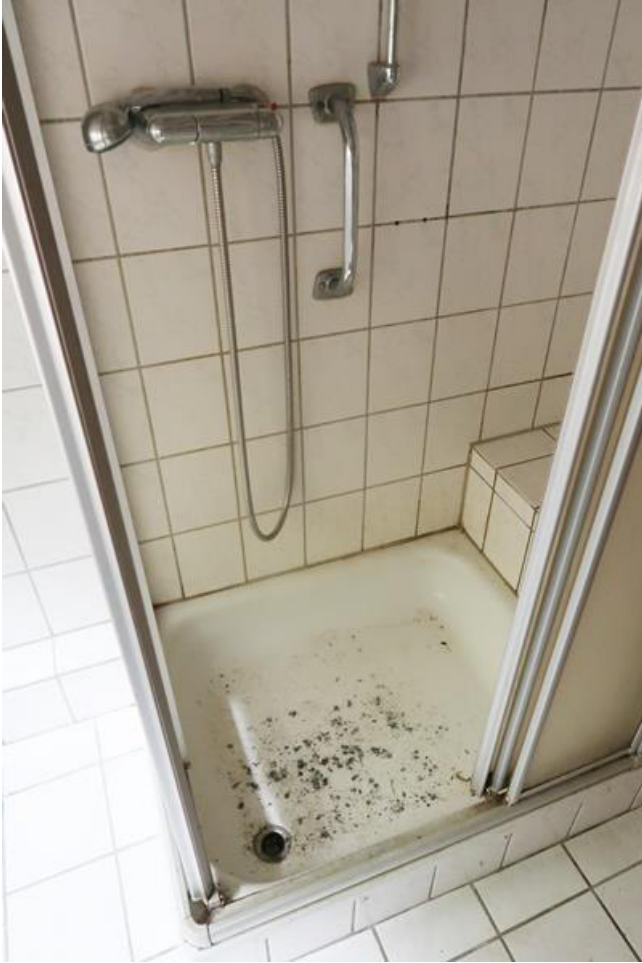
Dusche mit Schimmelpilzbelag