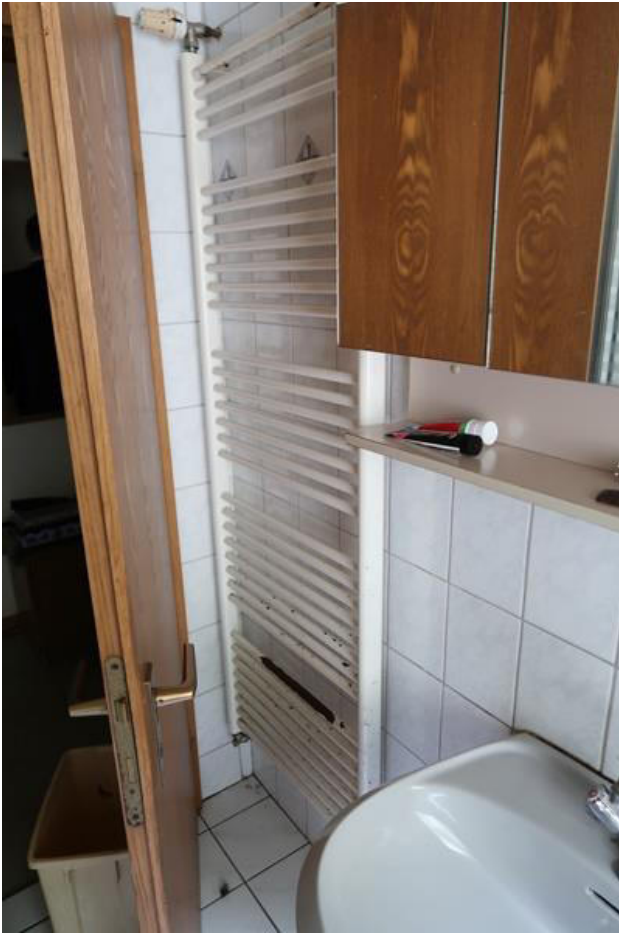
Röhrenradiator mit deutlichen Korrosionsspuren.