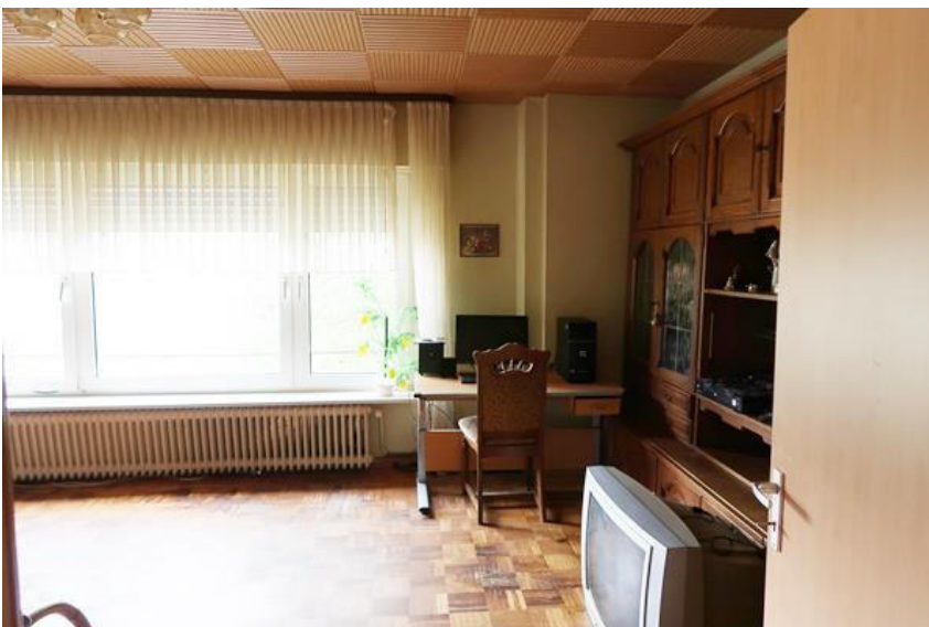
Wohnzimmer mit stark abgenutztem Parkettboden