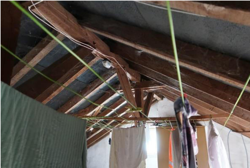
Dachkonstruktion (Ursprungsgebäude) mit Dachpappe als zweiter Entwässerungsebene, ohne Dämmung.