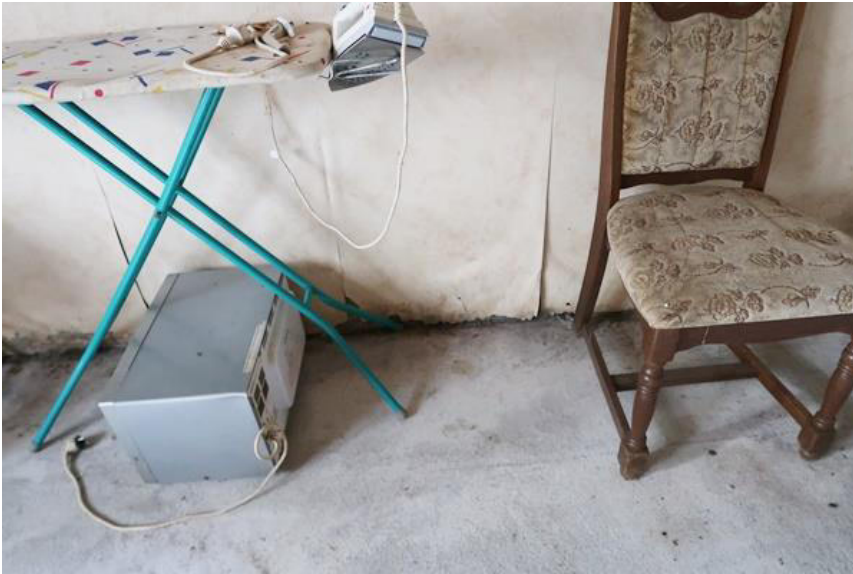
Feuchtigkeitseintritt insbesondere im unteren Wandbereich