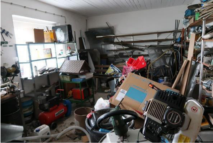
Werkstattraum im Stallgebäude