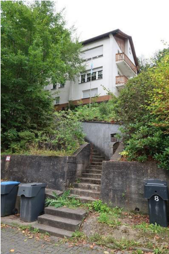
Hausansicht Nordosten von der Straße Im Steinsiepen aus.