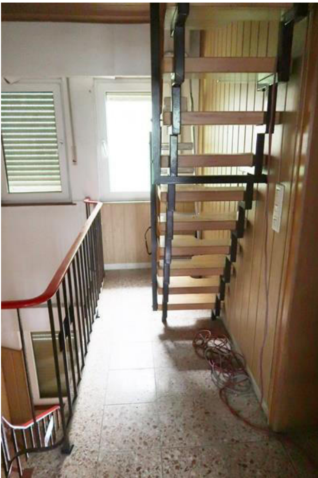
Raumspartreppe zum Spitzboden