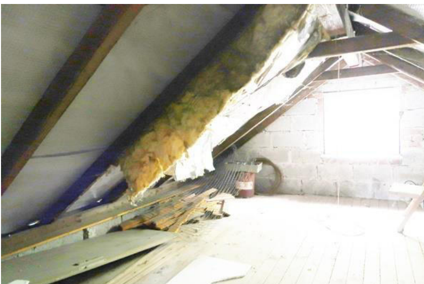
Schäden an der Dämmung