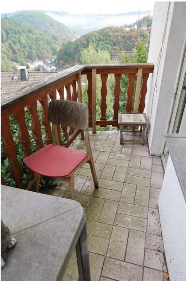
Balkongeländer behelfsmäßig gestützt.