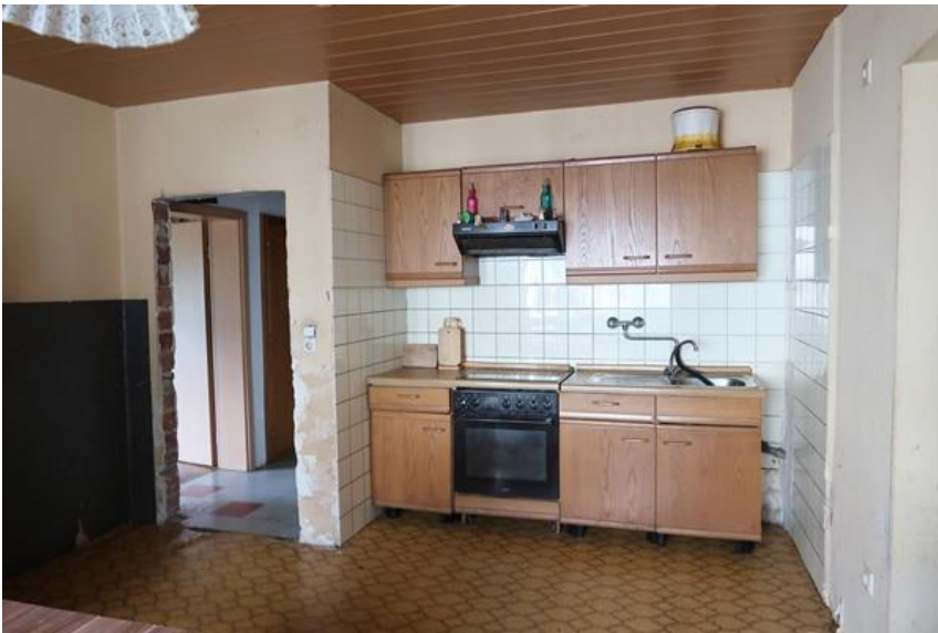
Wohnung im Erdgeschoss