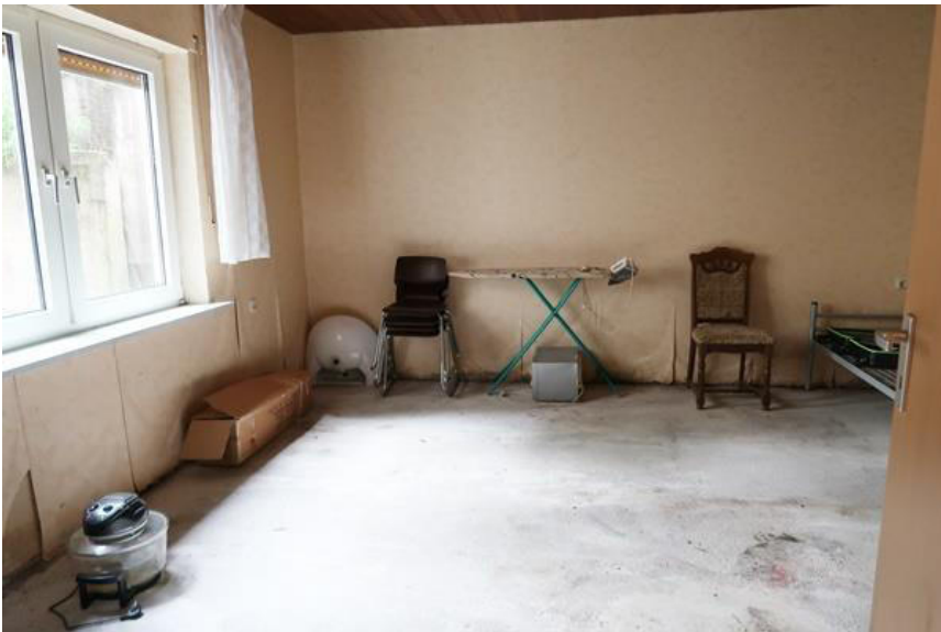
Wohnraum im Anbau