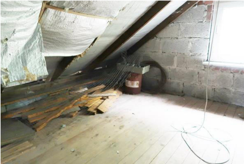
Dampfsperre/Dampfbremse ohne Funktion