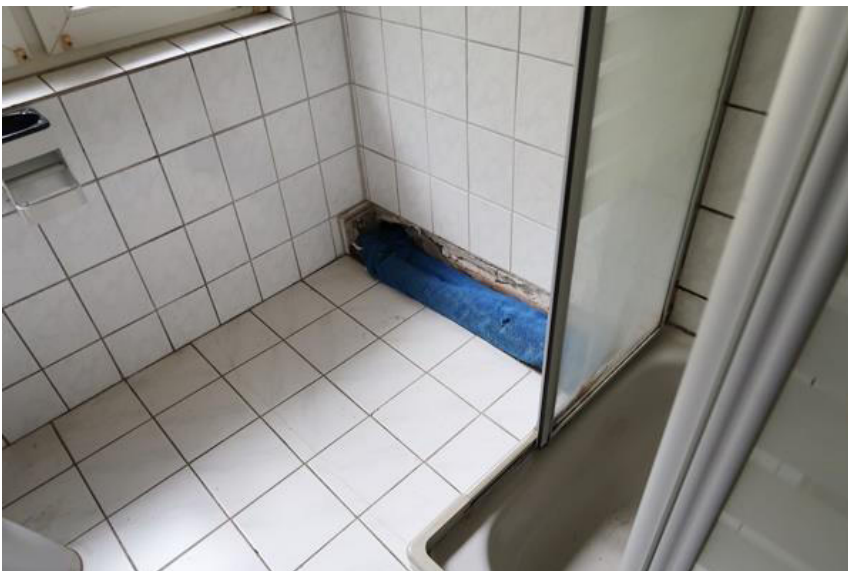
Nach Rohrleitungsschaden nicht reparierte Wand- und Bodenverfliesung.