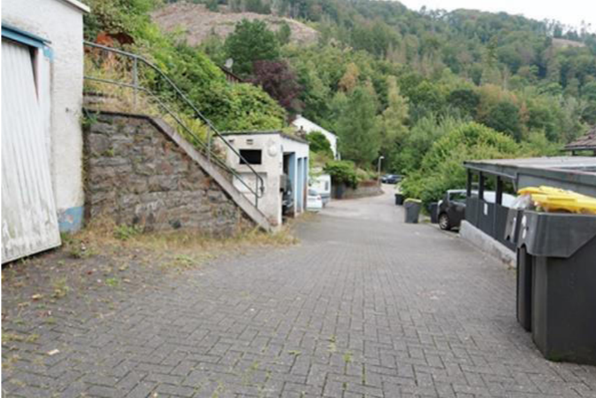
Straßenbereich Im Steinsiepen – Blickrichtung Norden