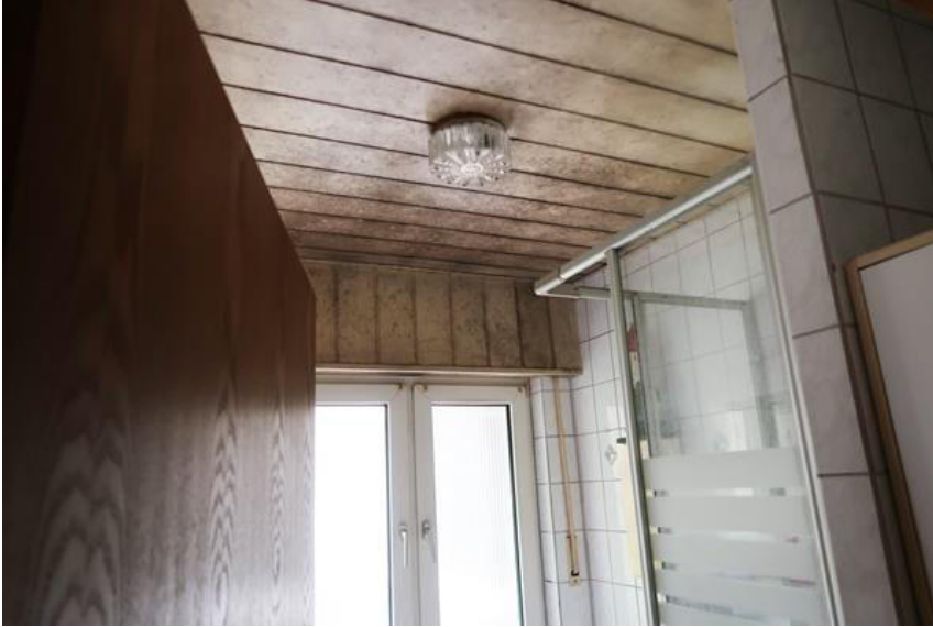
Badezimmer – Schimmelpilzbeläge an Wand- und Deckenbelägen.