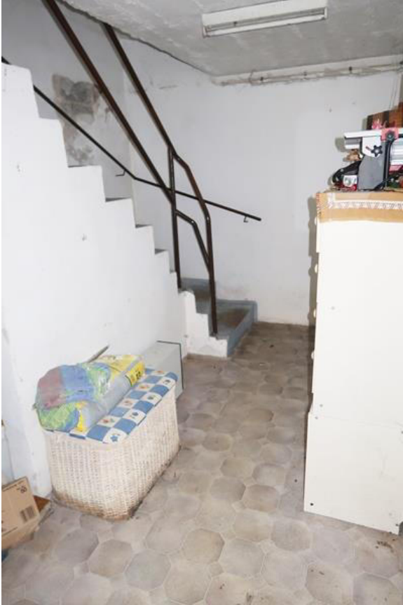
Treppenabgang zum Keller