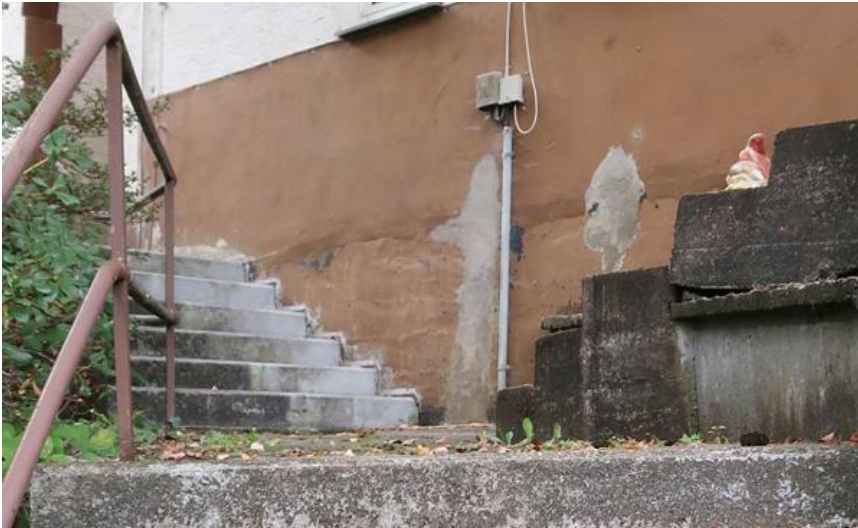
Fortführung Treppenaufgang, Schäden an Putz- und Beschich- tung im Sockelbereich des Hauses