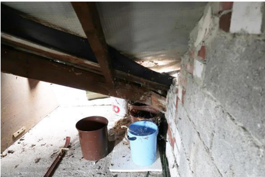
Schadensort – Regenwassereintritt in das Gebäude, Schäden an der Dacheindeckung