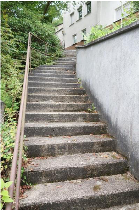
Treppenaufgang zum Haus