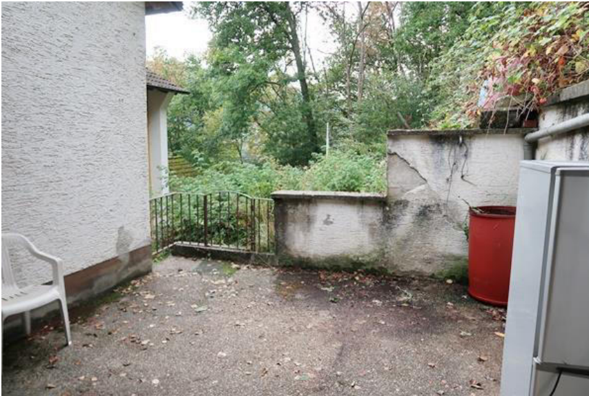
Terrasse mit Geländeabfangung und Absturzsicherung