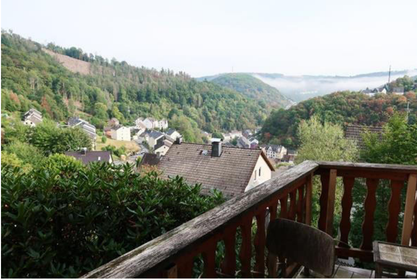
Blick über den Ortsteil Breitenhagen