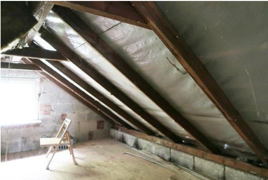
Dachkonstruktion über dem Anbau