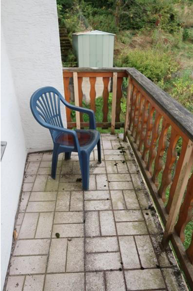
Balkon – Geländer behelfsmäßig gestützt