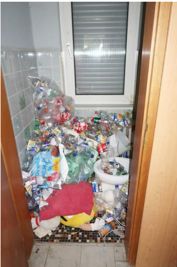
Gäste – WC