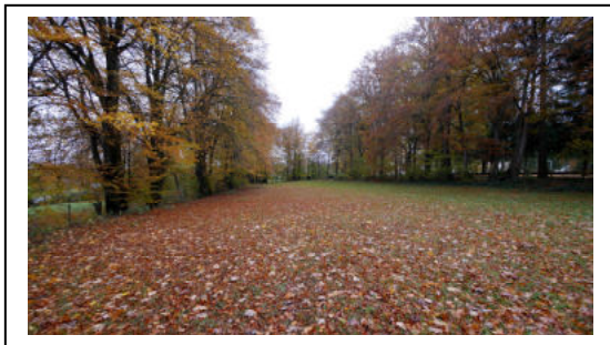
Ansicht Flurstück 155