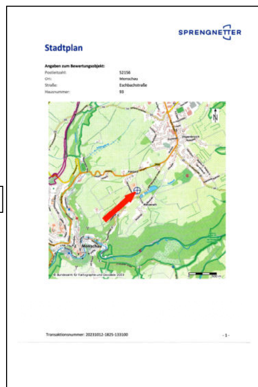
Lage im Ort