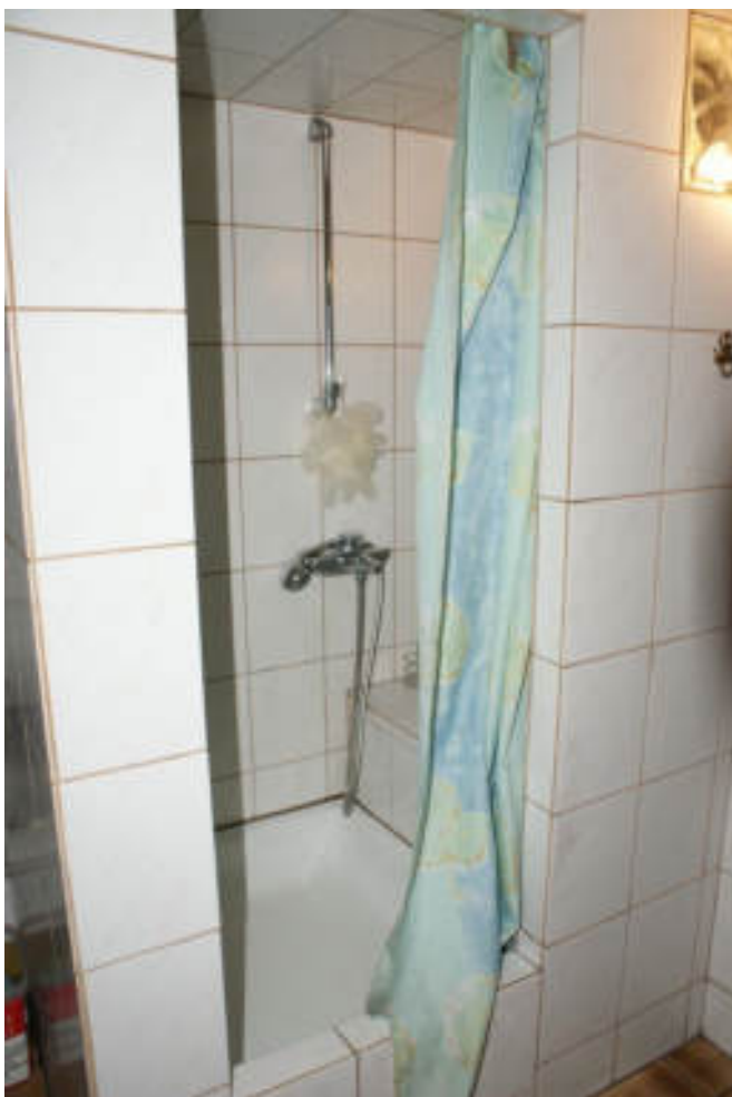
Bild 37 Einfache Dusche auf der Hofseite des Heizungsraums