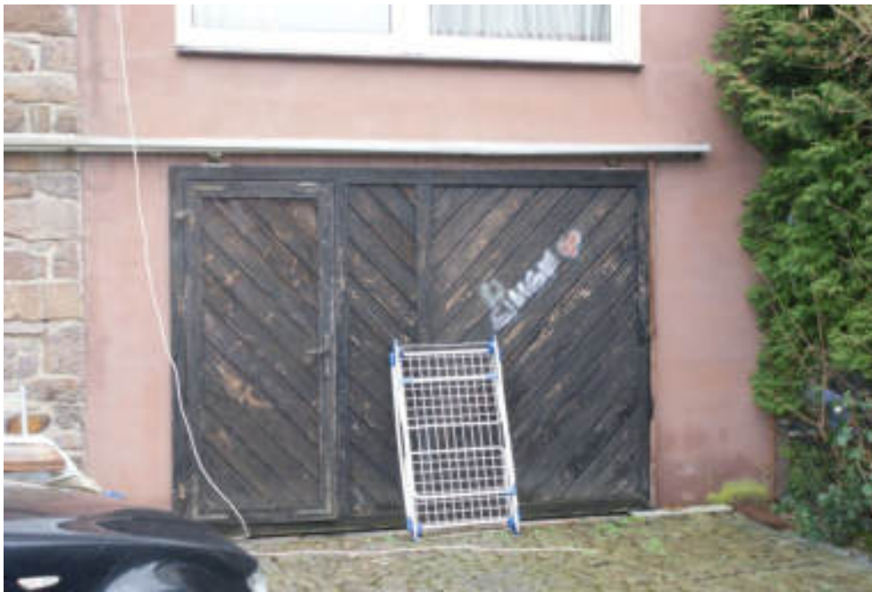
Bild 21 Garage im KG Anbau, nicht zu besichtigen / darüber Wohnraum UG