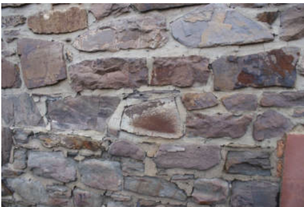
Bild 60 Beispiel für Risse und Fehlstellen im Bruchsteinmauerwerk rückseitig