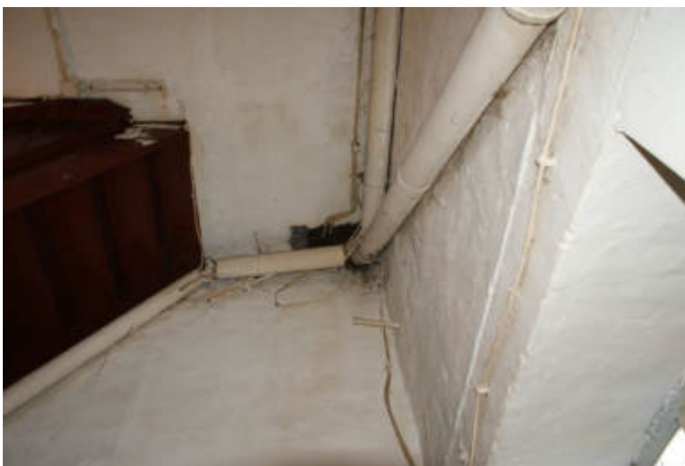
Bild 32 Flur/Treppenhaus KG