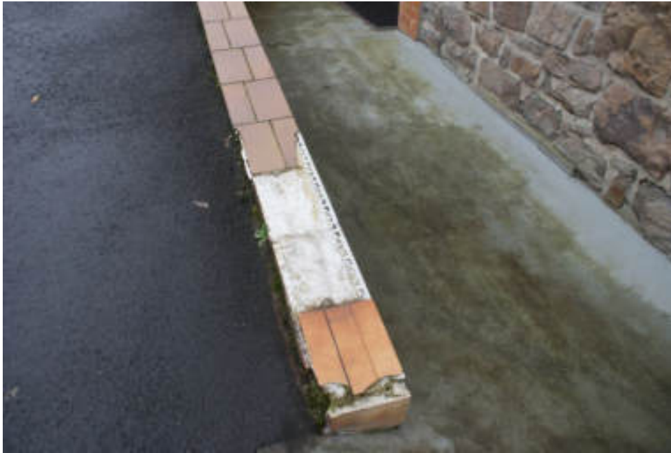
Bild 61 Stark schadhafte Stützmauer am Zugang zum UG