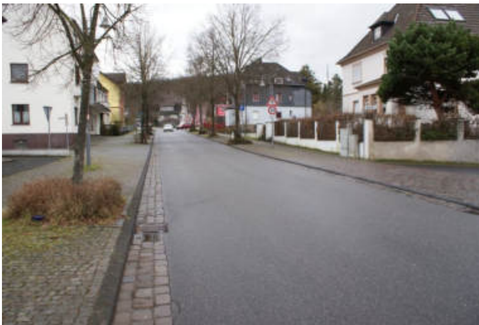
Bild 1 „Bahnhofstraße“ (L 112) in Au/Sieg Richtung Norden zum Bahnhof