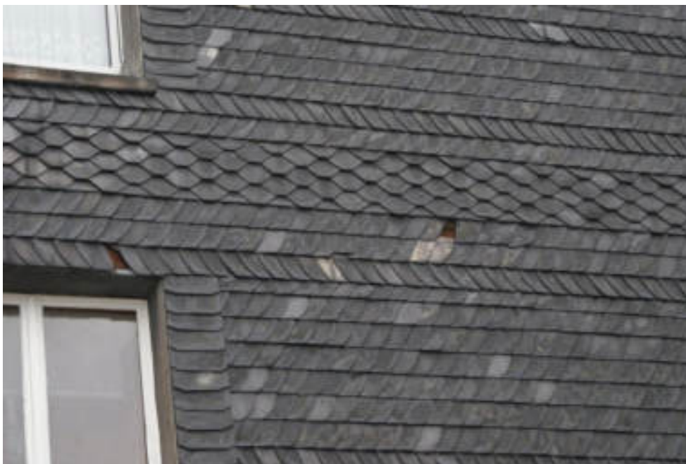
Bild 59 Weiter Schäden an der Verschieferung