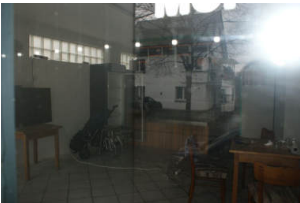
Bild 40 Blick durch die Schaufensterscheibe Anbau in den Kiosk