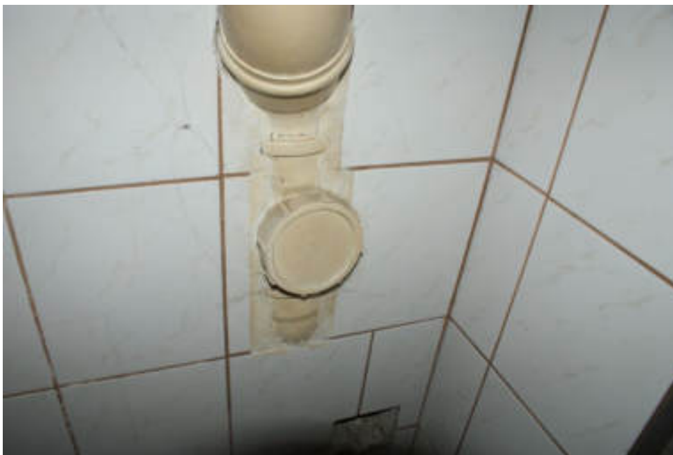
Bild 67 Fliesenschäden im Heizungskeller / alte Abwasserleitungen