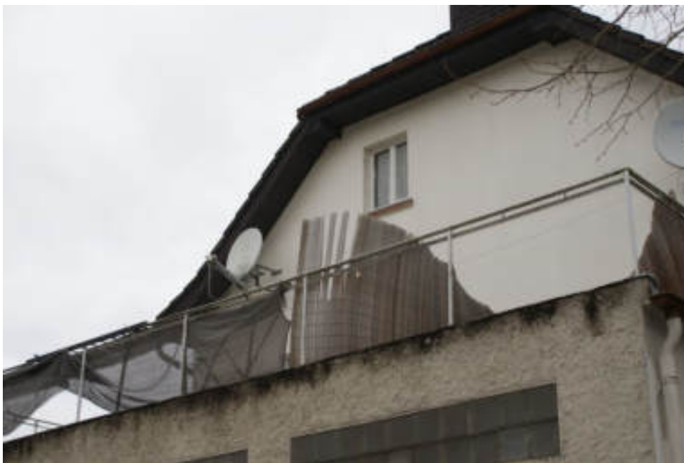
Bild 57 Nässeschäden vom Balkon Anbau / desolate Balkonbrüstung