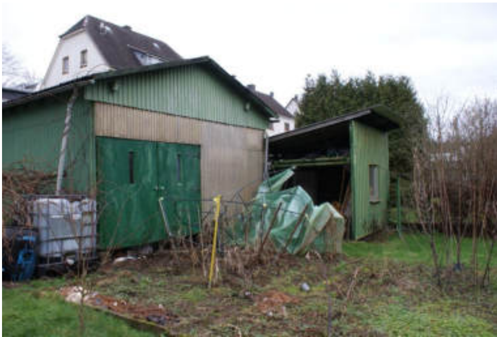
Bild 27 Rückseite Carport / rechts Schuppen hinter der Garage an der Grenze