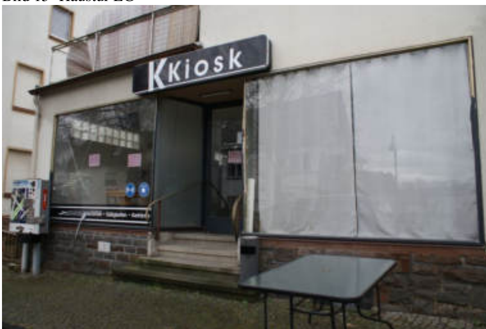
Bild 16 Frontansicht Kiosk / rechts Raum im Haupthaus / links Anbau an der Grenze