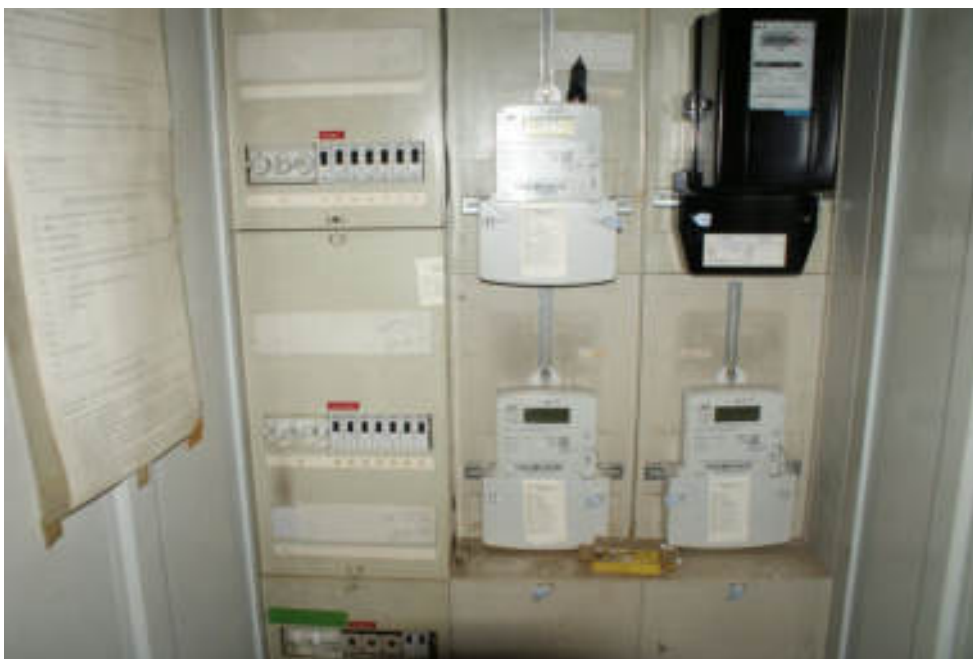
Bild 39 Teilmodernisierter Zählerschrank