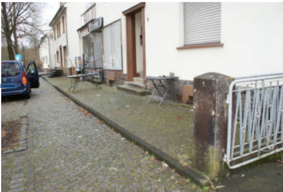
Bild 3 (von r. nach l.) Vorfläche vor dem Gebäude, Gehweg und Parkstreifen