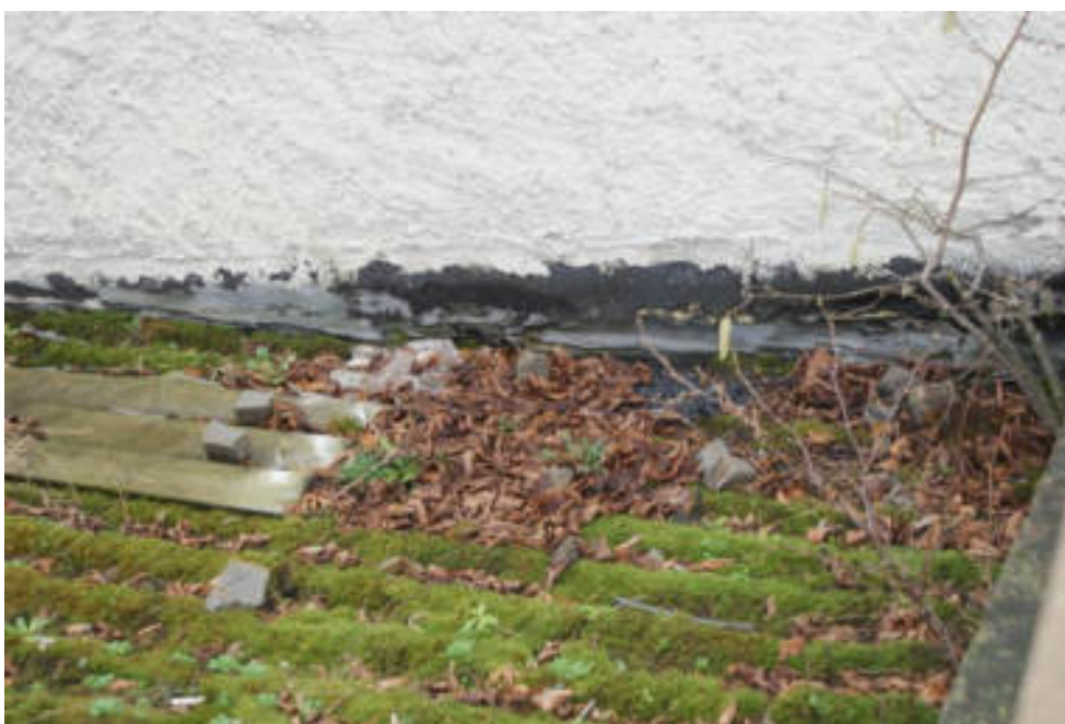
Bild 56 Schäden am Anbau im Bereich des Schuppens von Haus Nr. 7, Flurstück Nr. 89