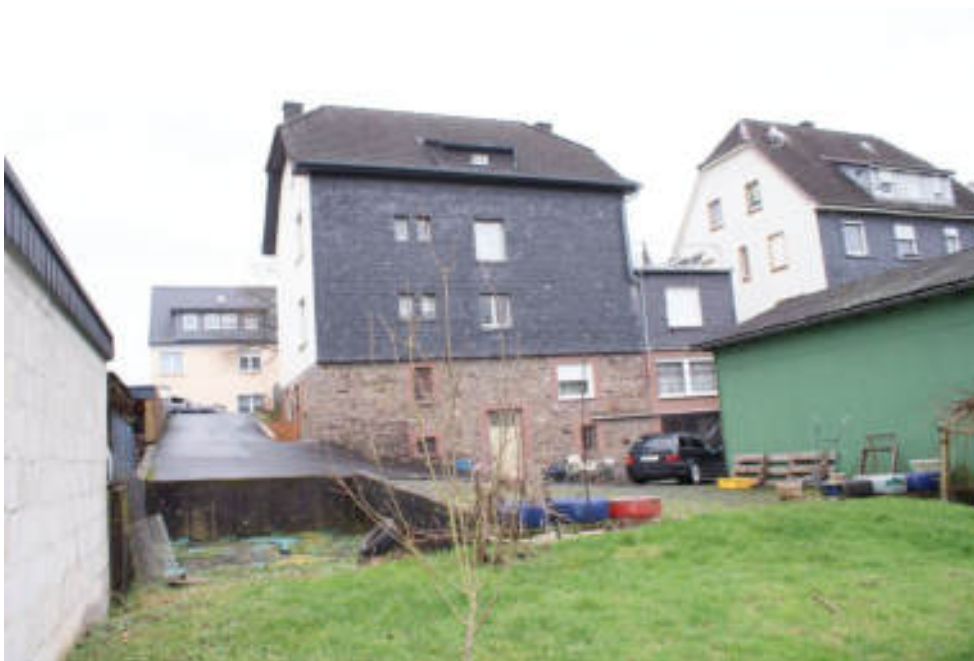
Bild 9 Rückansicht vom Garten / Rechts Carport