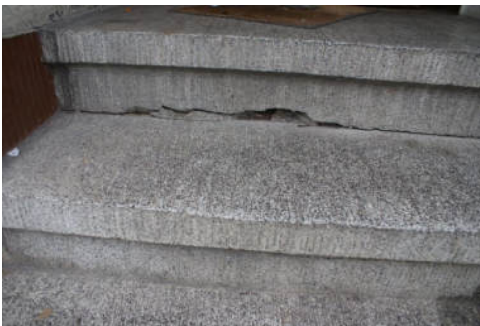
Bild 50 Starke Beschädigung der Natursteinstufen Hauseingang