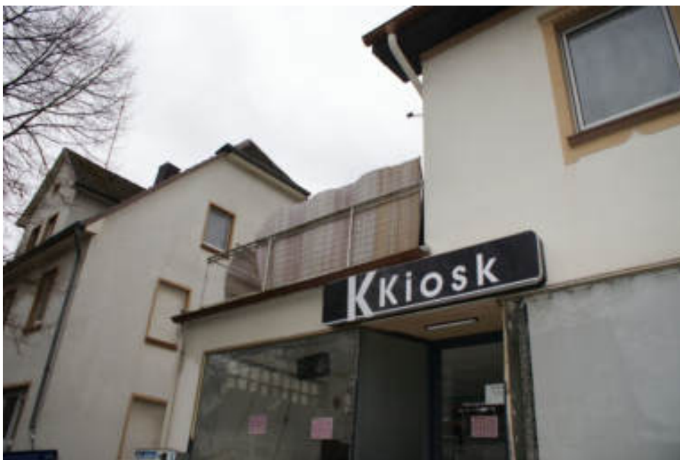
Bild 17 Anbau mit Kiosk im EG, darüber Terrasse OG an der Grenze