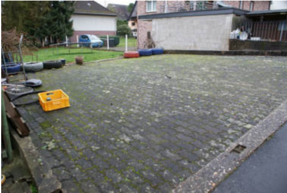
Bild 25 Befestigte Stellplätze nördlich des Carports