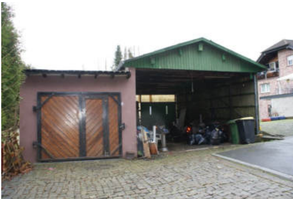
Bild 23 Links grenzständige Massivgarage / rechts Carport, beide aus 1983