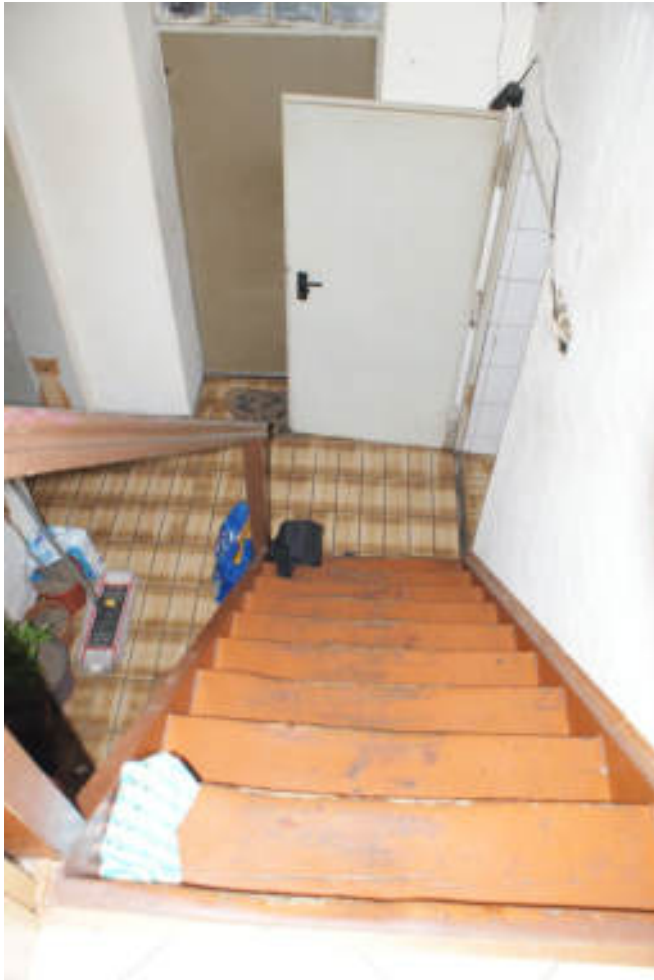
Bild 33 Treppe vom KG zum UG