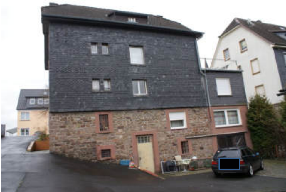
Bild 10 Rückansicht Haus Nr. 9 / links Haupthaus / rechts Anbau