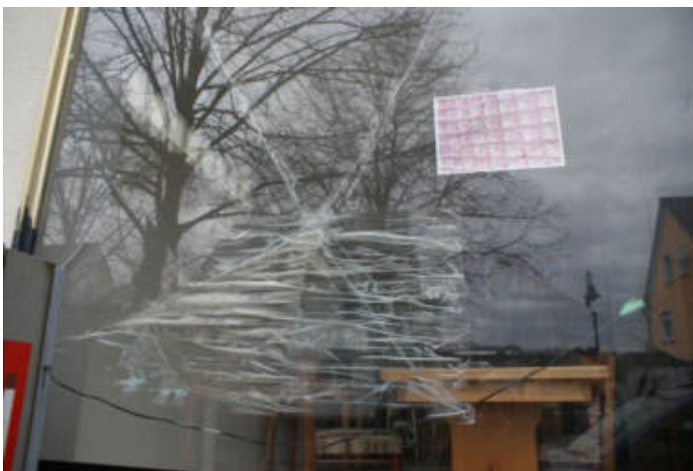
Bild 42 Blick zu Außenwand, defekte; gerissene und abgeklebte Scheibe