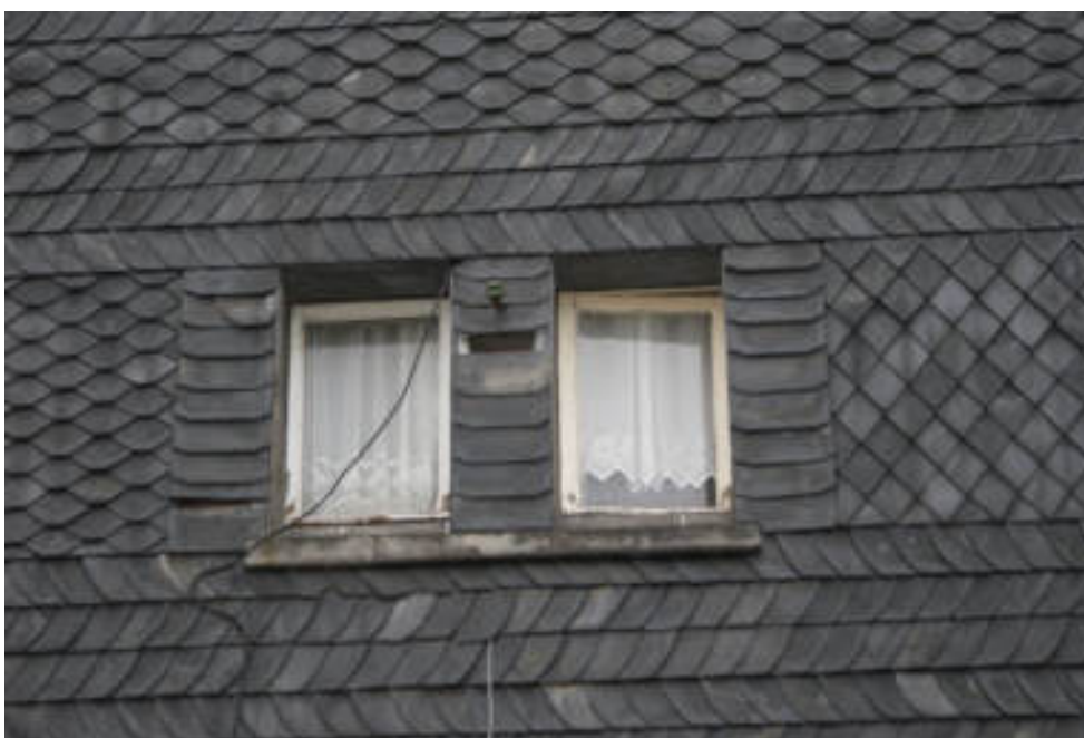
Bild 58 Beispiel für alte Holzfenster im OG rückseitig / Schieferschaden