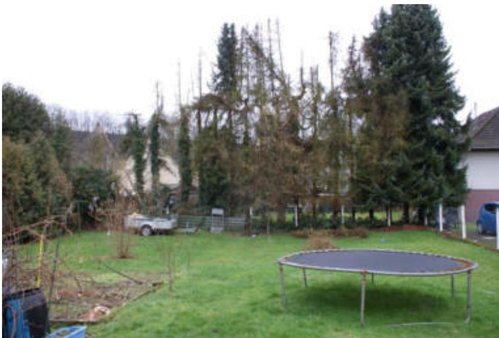
Bild 26 Blick in den Garten nach Westen