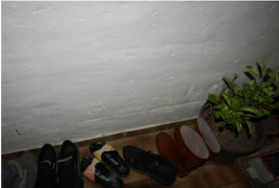
Bild 69 Beispiel für Putzschäden in den Wohnebenen