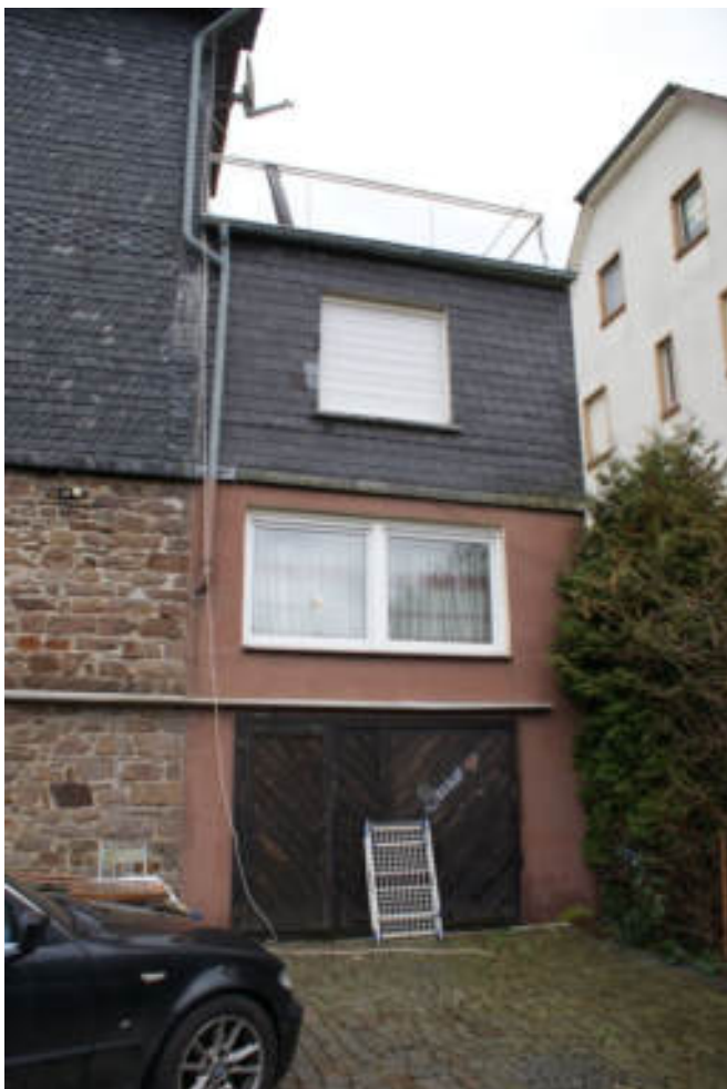
Bild 13 Anbau an der Südseite KG = Garage / UG = Wohnraum / EG = Kiosk