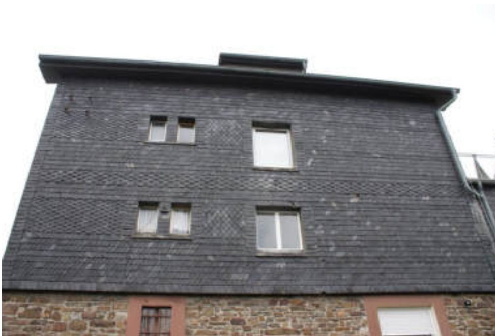
Bild 12 Rückseite EG und OG über Bruchsteinmauerwerk UG