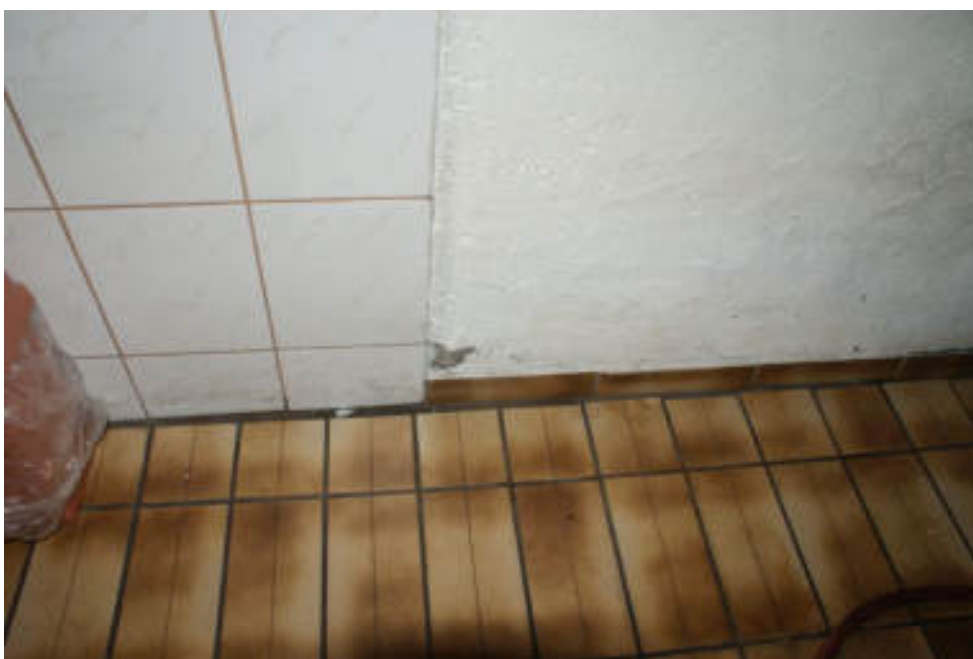
Bild 66 Beispiel für Feuchte- und Putzschäden im KG