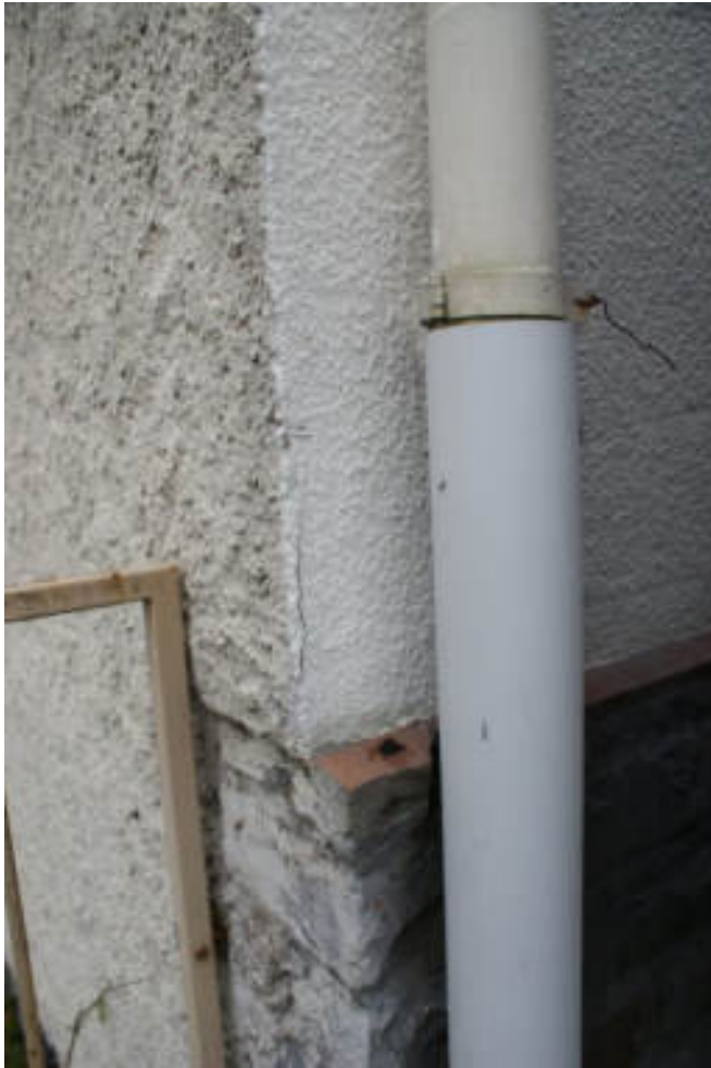
Bild 51 Putzschaden an der Nordostecke