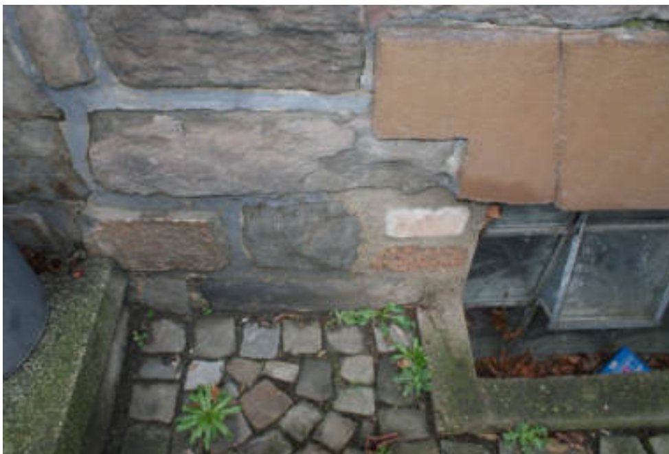
Bild 49 Weitere Schäden Bruchsteinsockel