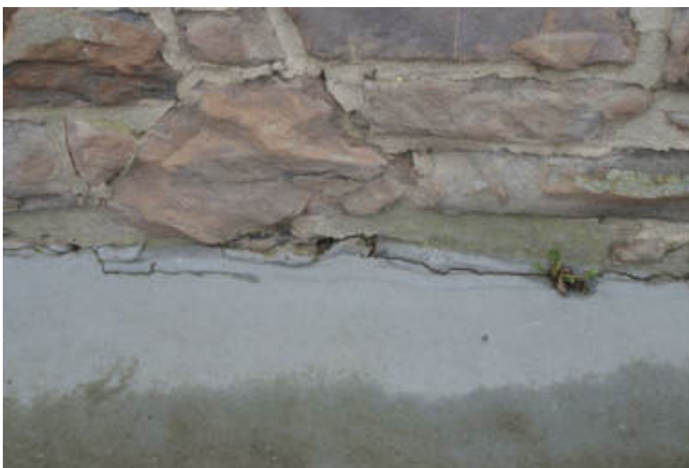
Bild 64 Nässeschäden am Betonweg zur Haustür UG