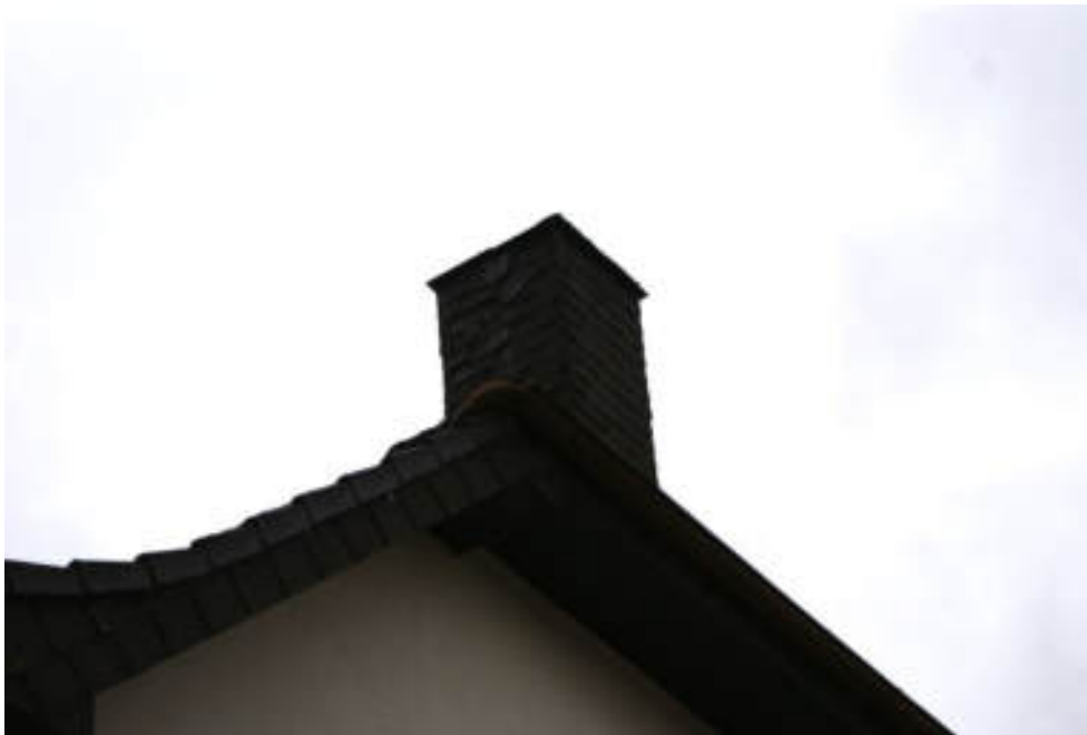
Bild 53 Schadhafter Schornsteinkopf Nordseite