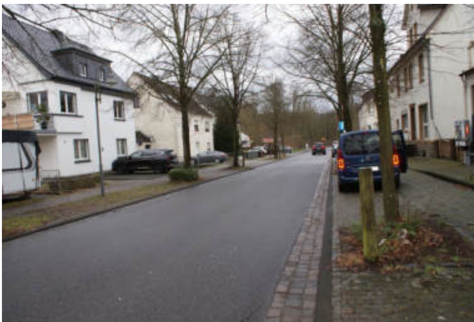
Bild 2 „Bahnhofstraße“ (L 112) in Au/Sieg Richtung Süden zur „Hammer Straße“ (B256)