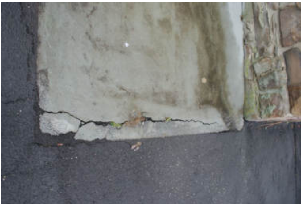
Bild 62 Betonschäden am Zugang zum UG