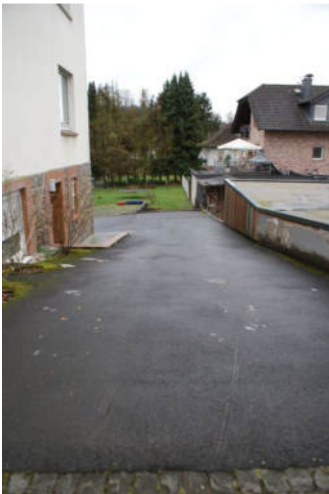
Bild 7 Rampe an der Grenze zu Haus Nr. 11 zum Hof