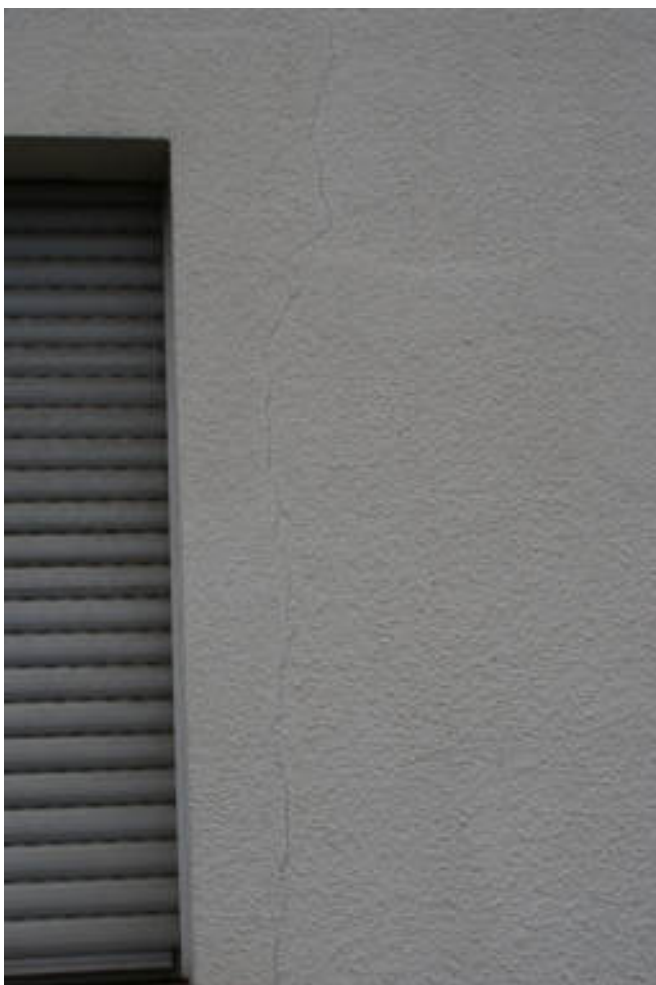
Bild 45 Detail Riss neben dem Fenster EG