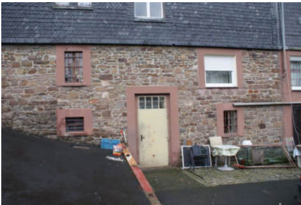
Bild 11 Haupthaus KG und darüber Zwischengeschoss (UG) / Kellereingang, rechts davon einfacher Aufenthaltsraum, links Heizungsraum