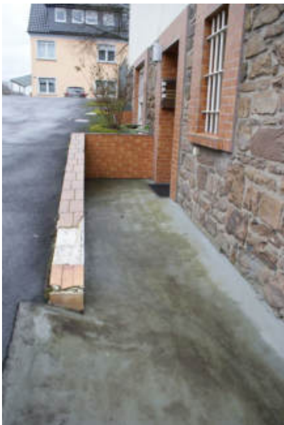
Bild 19 Zugang zum UG an der Nordseite