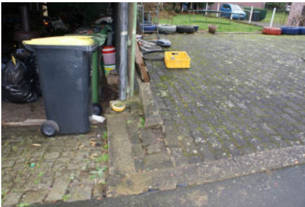
Bild 65 Schäden an der Hofbefestigung im Bereich Carport/Stellplätze