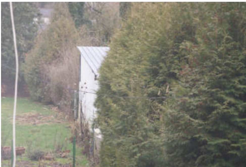
Bild 29 Ansicht Schuppen an der Grenze zu Flurstück 89 (Haus Nr. 7)