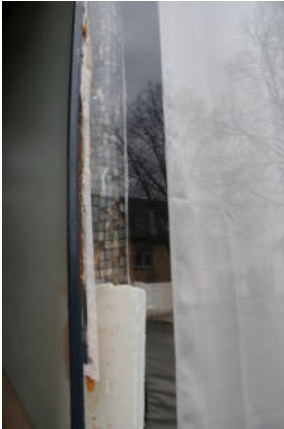
Bild 43 Blick Richtung Raum im Haupthaus