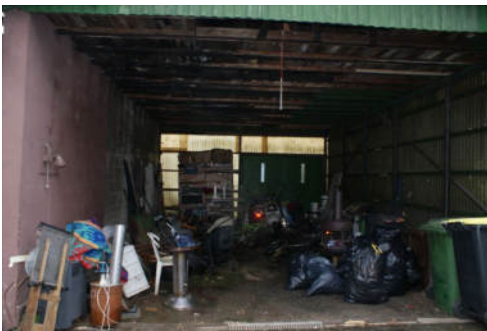
Bild 24 Blick in den Carport