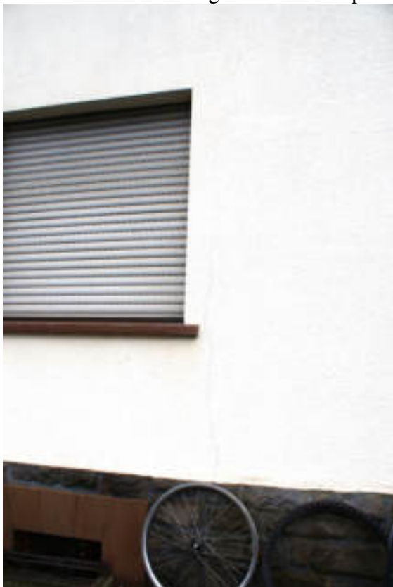
Bild 44 Beispiel für Putz und Mauerrisse, hier in der Frontseite