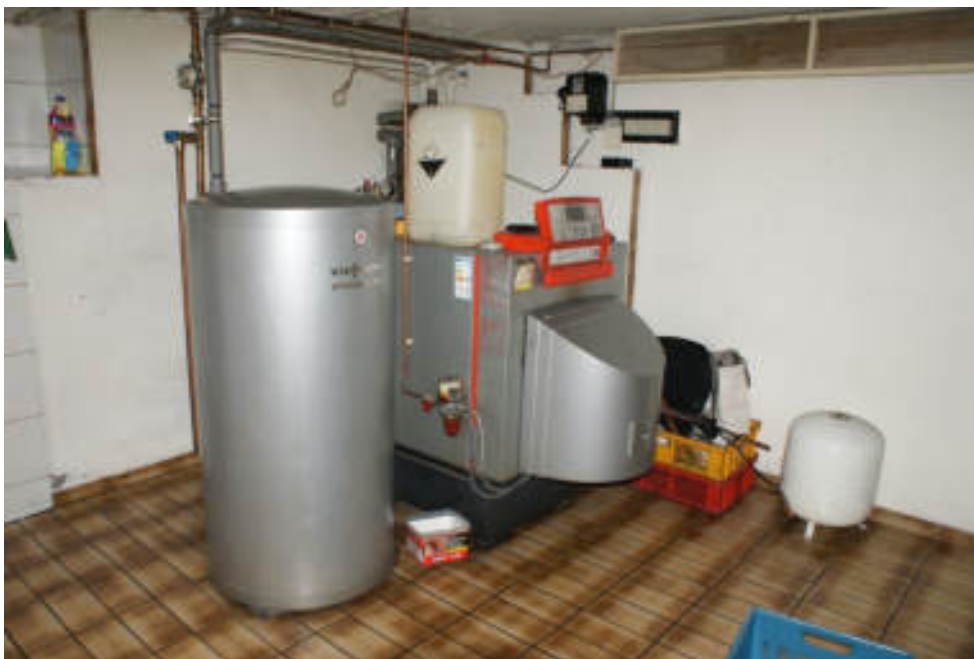
Bild 36 Heizungskeller mit Ölheizung und Warmwasserspeicher