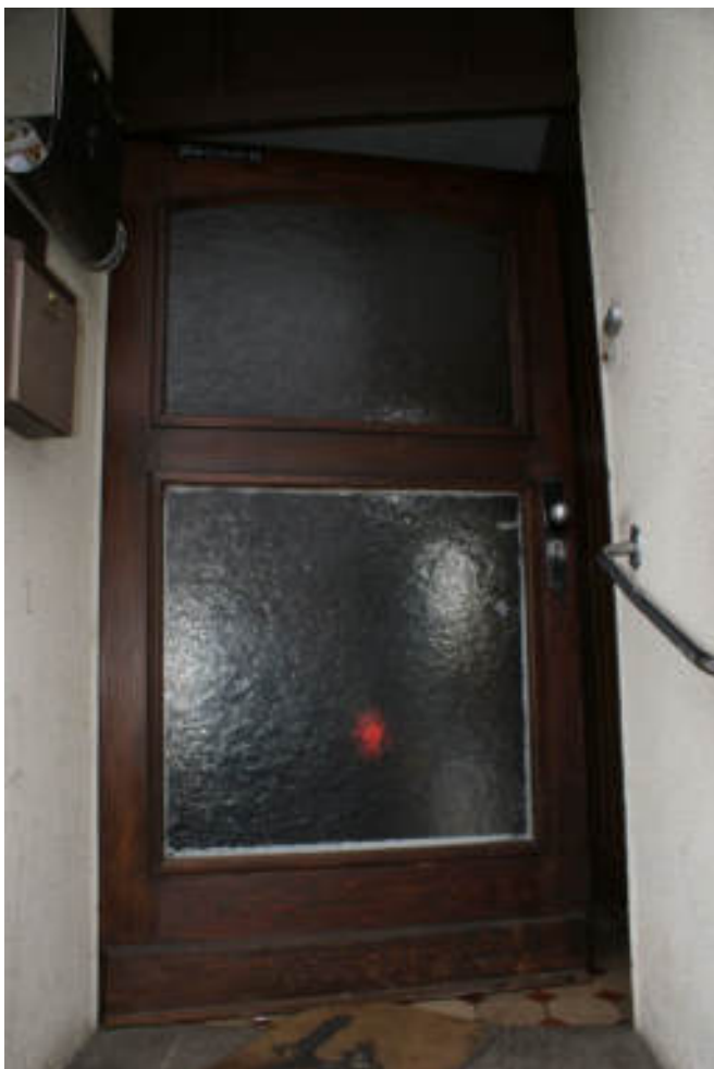
Bild 15 Haustür EG