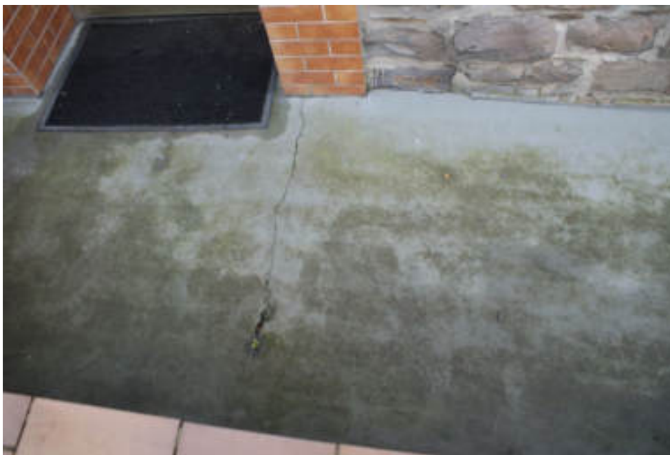
Bild 63 Riss im Beton des Zugangs zum UG