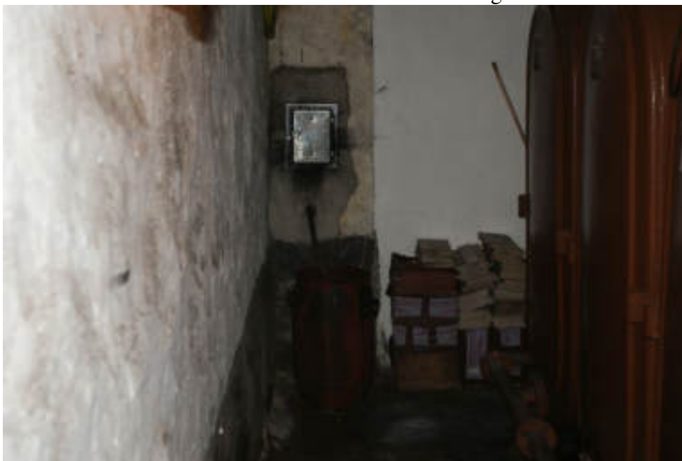
Bild 38 Öltankraum mit drei Stahltanks je 1.500 l