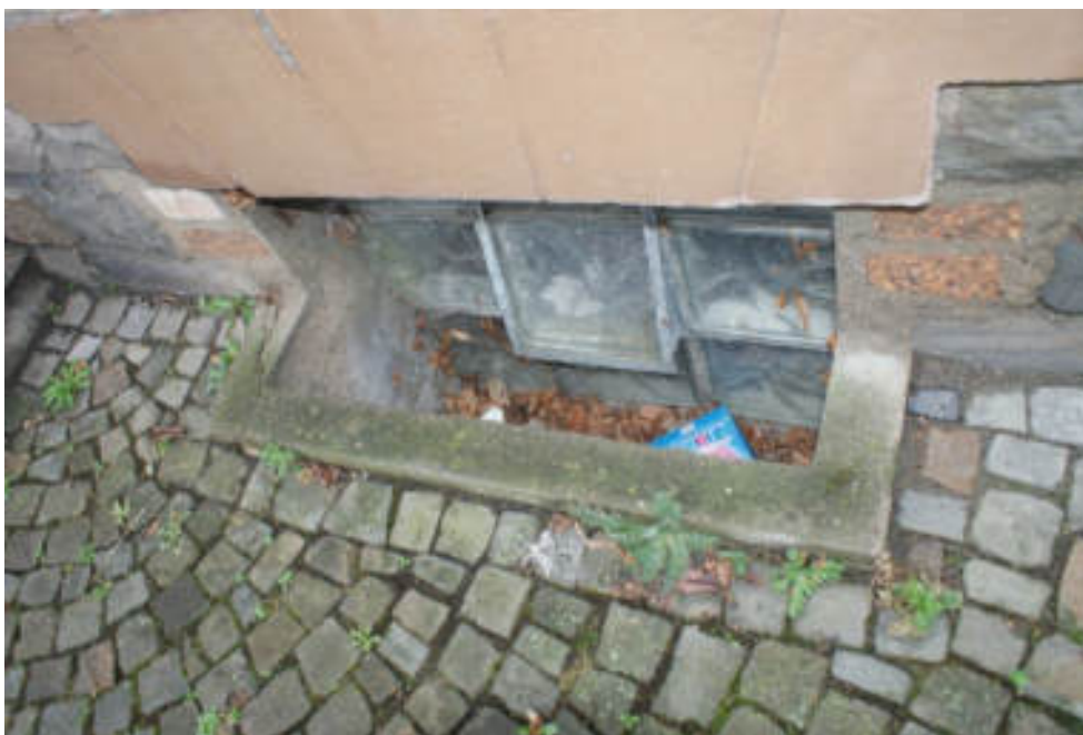
Bild 47 Unzureichende Belichtung + Belüftung der Räume im UG straßenseitig