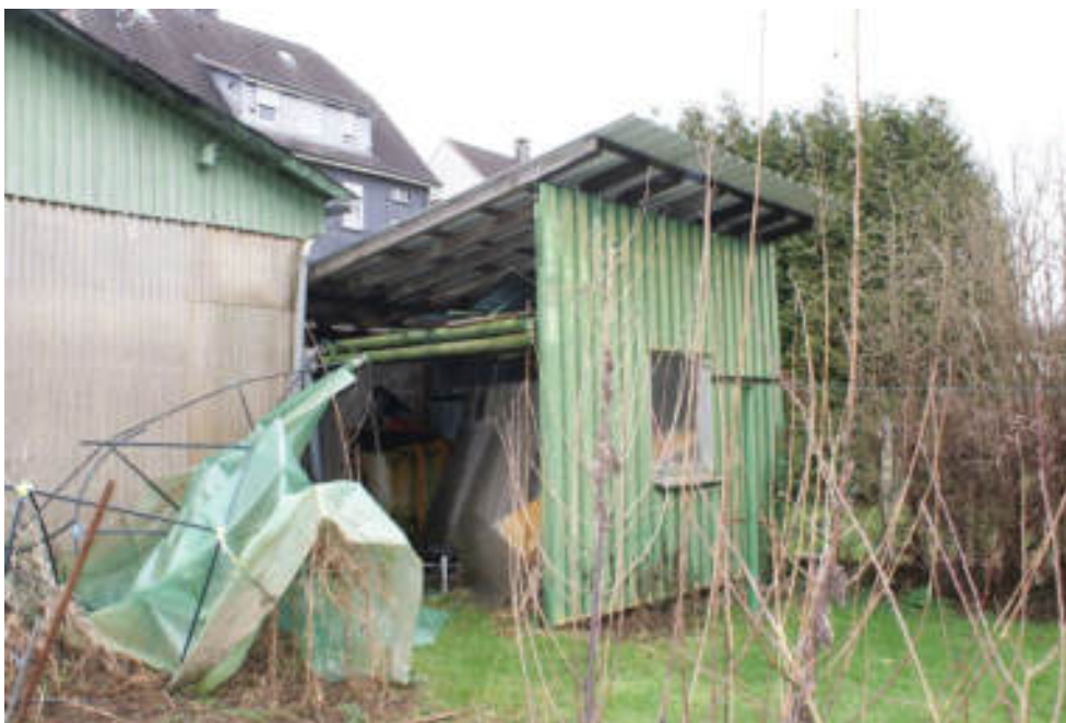
Bild 28 Detailansicht halboffener Schuppen