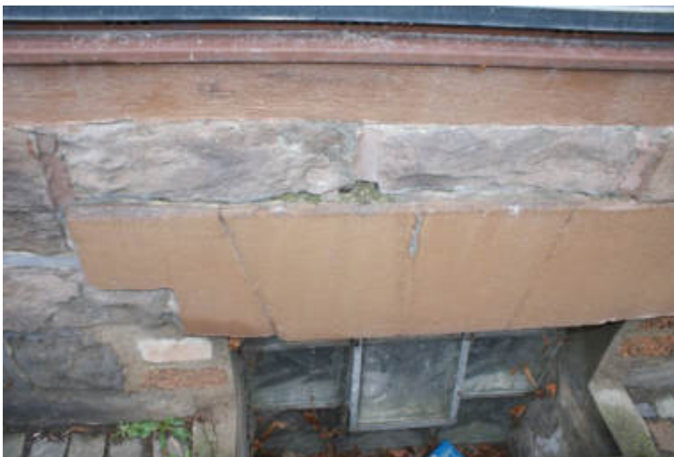
Bild 48 Beispiel für Mauerwerksschäden Bruchstein frontseitig