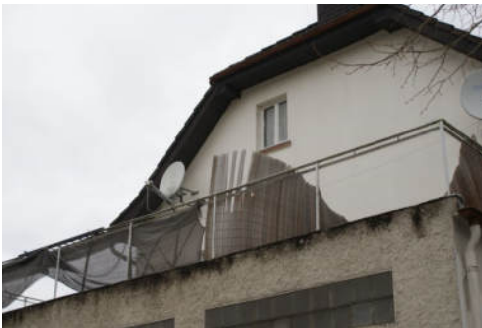
Bild 18 Anbau Südseite / darüber Terrasse OG und Südgiebel OG + DG