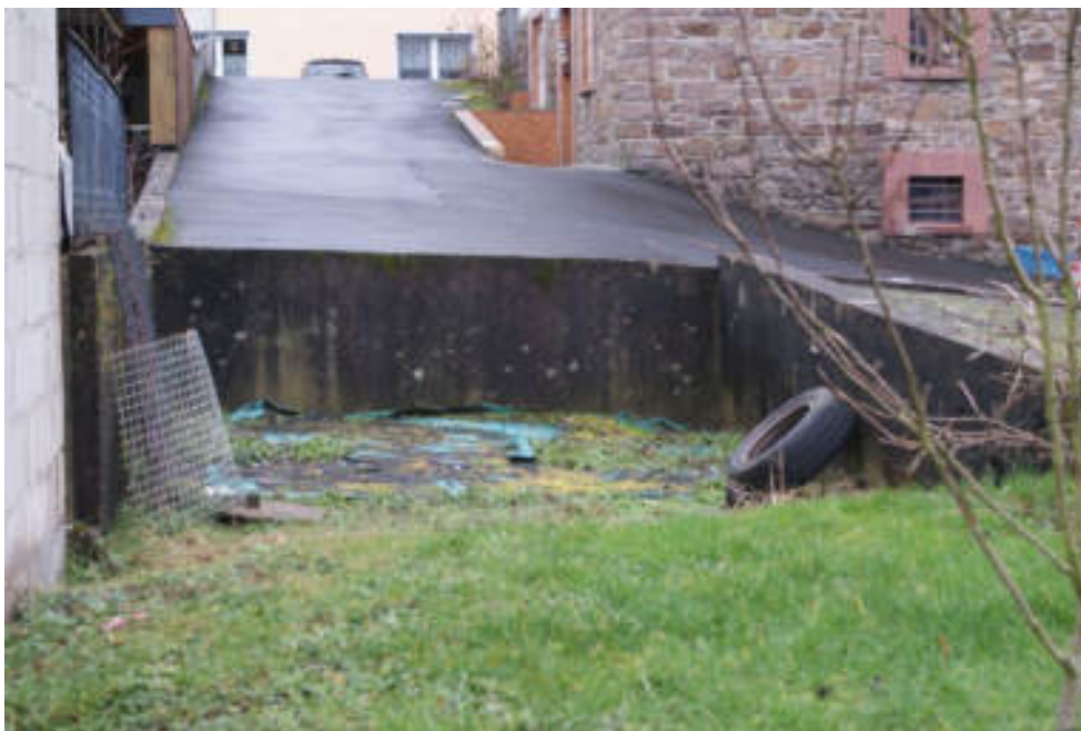
Bild 31 Blick vom Garten auf Rampe zur Straße und Stützmauern