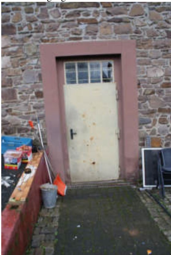
Bild 20 Zugang zum KG hinten vom Hof