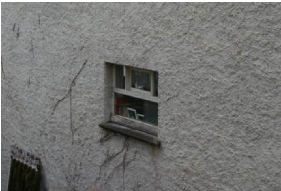
Bild 55 Beispiel für Putzschäden und Bewuchs Südseite Anbau UG/ Fenster UG