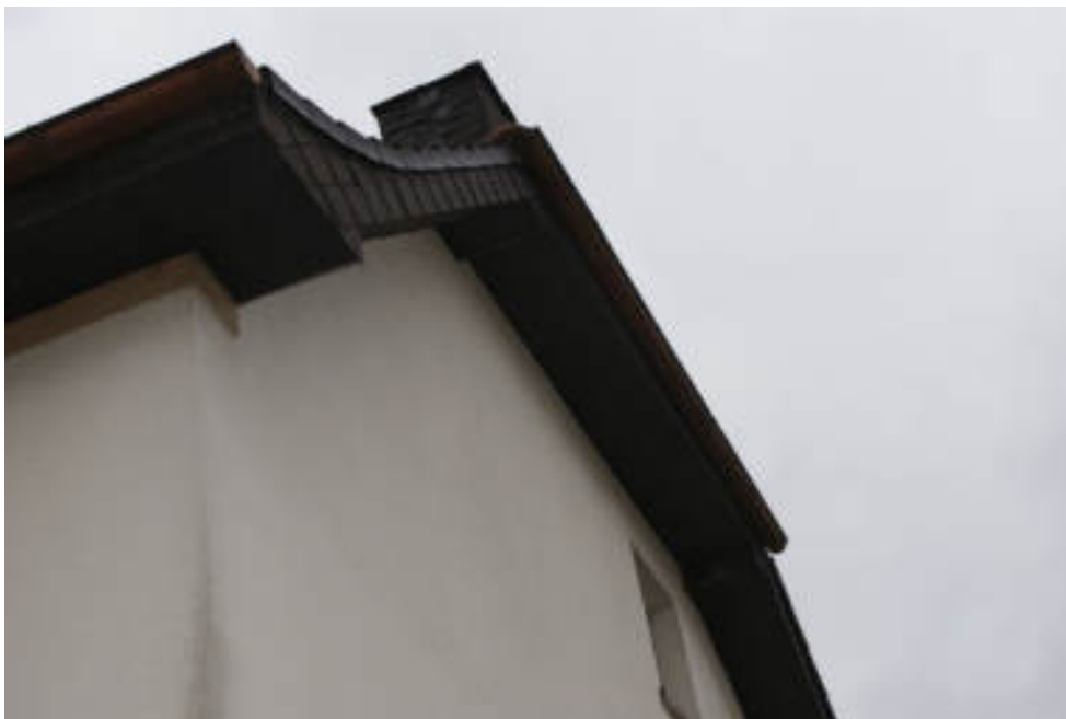
Bild 52 Schäden Putz und Holzwerk Nordgiebel sowie Dachentwässerung