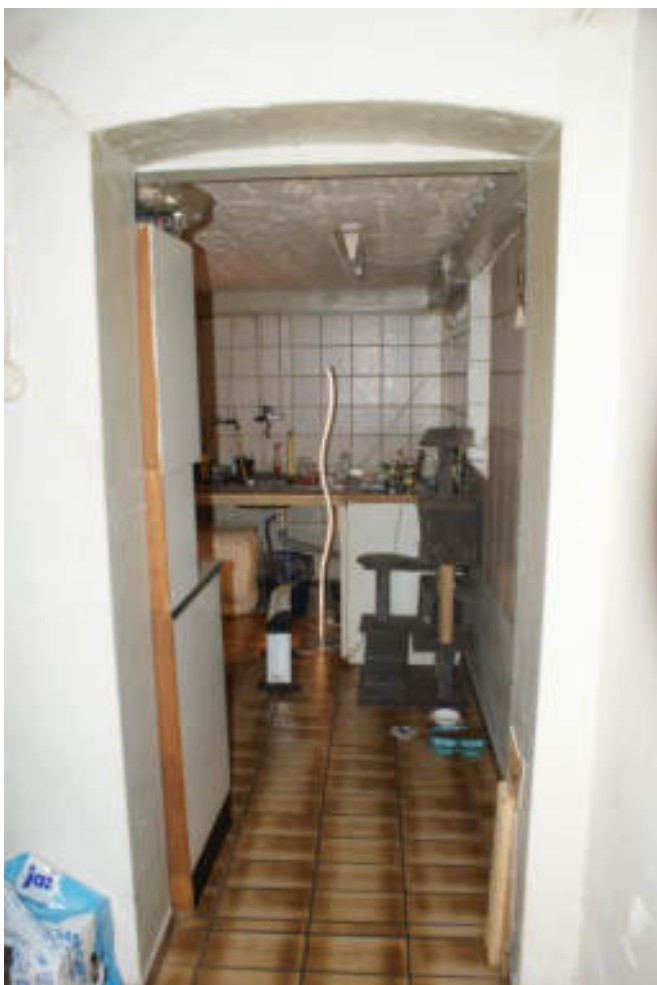
Bild 35 Blick in den Aufenthaltsraum KG