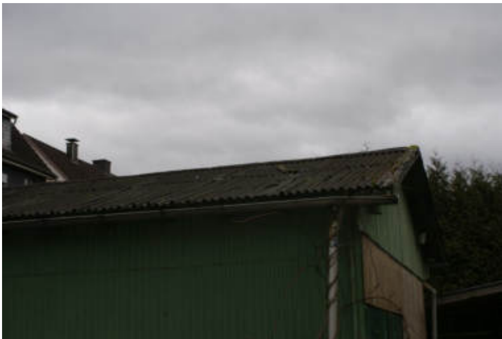
Bild 70 Schadhafes Dach und Dachentwässerung Carport