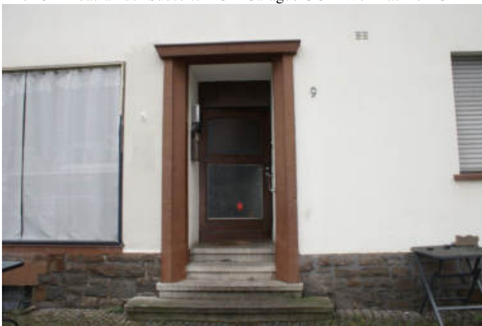
Bild 14 Frontseite mit mittigem Eingang / Links Gewerberaum im Haupttrakt