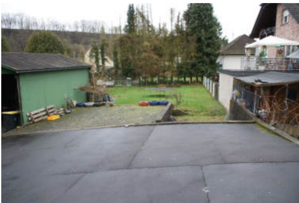
Bild 30 Blick von der Rampe auf Stellplätze und in den Garten Richtung Westen