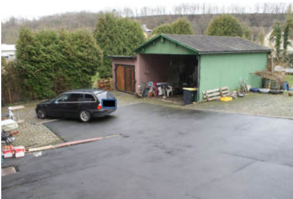
Bild 22 Blick von der Rampe über den Hof auf Grenzgarage und Carport