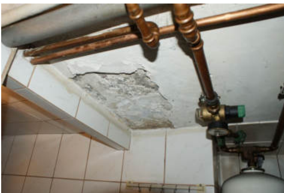
Bild 68 Beispiel für Putzschäden Betonkappendecke im KG