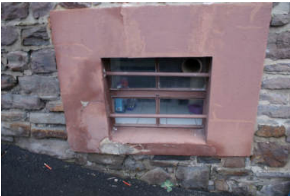
Bild 54 Schäden im Bereich der Fensterfaschen Rückseite