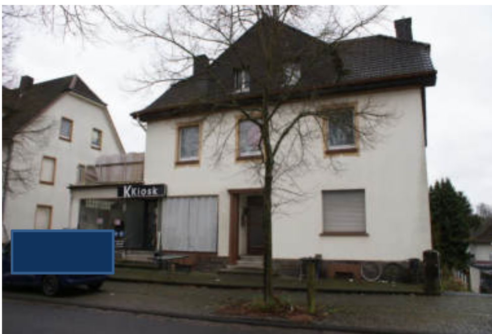
Bild 4 Frontansicht Ostseite Bewertungsobjekt „Bahnhofstraße 9“, Au/Sieg