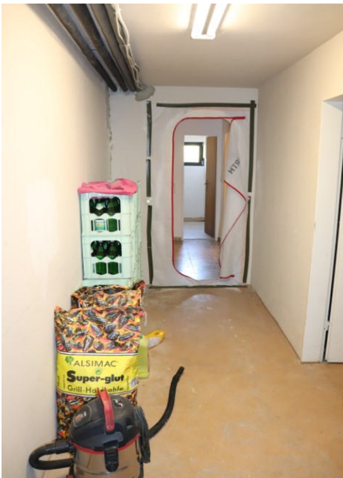
Bild 24 Kellergeschoss -Kellergang (provisorisch mit Staubwand zum Kellerflur)-