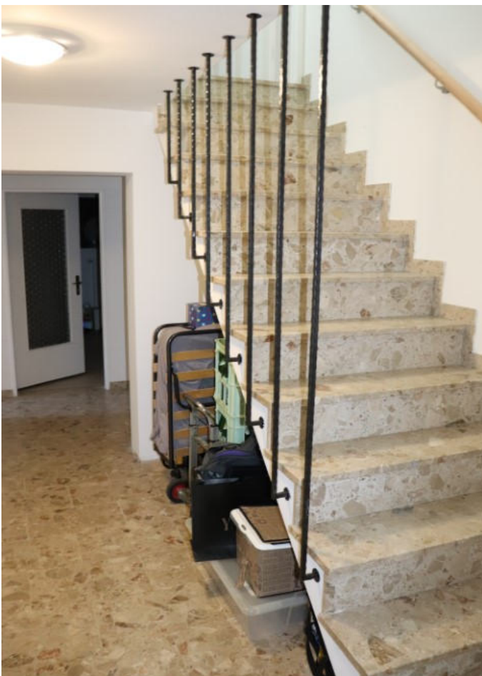
Bild 18 Kellergeschoss -Kellerflur-