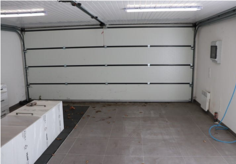
Bild 28 Doppelgarage (im hinteren Bereich mit abgeteiltem Abstellraum)