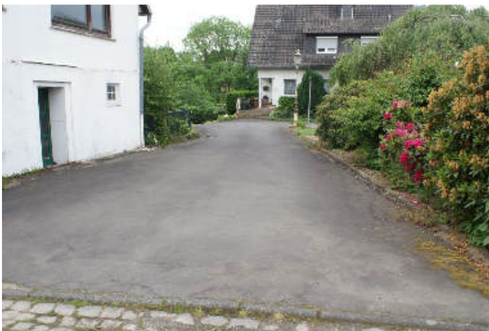
Bild 8 Befestigte Zuwegung zwischen Nr. 22 und Nr. 24 / Grenze verläuft etwa 2 Meter neben dem Südgiebel von Haus Nr. 22