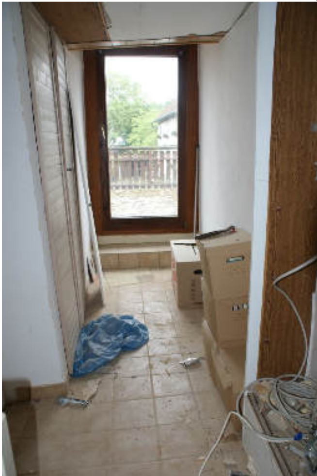
Bild 32 Flur OG von der Treppe zum Balkon