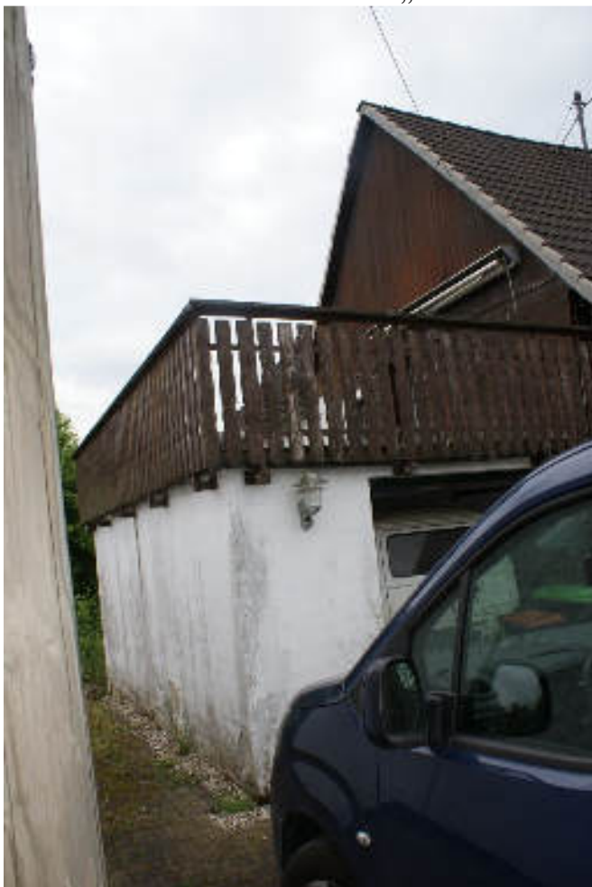
Bild 6 Garage in der Nähe der Nordgrenze zu Nr. 20