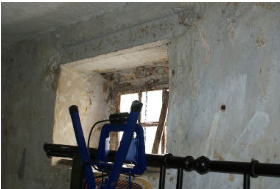
Bild 78 Beispiel für Nässe an Fenster des ehem. Stallanbaus / Rost am Stahlträger und Stahlfenster