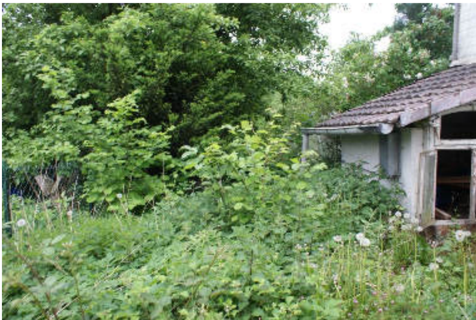
Bild 14 Blick in den überwucherten Garten Nordseite neben dem Schuppen