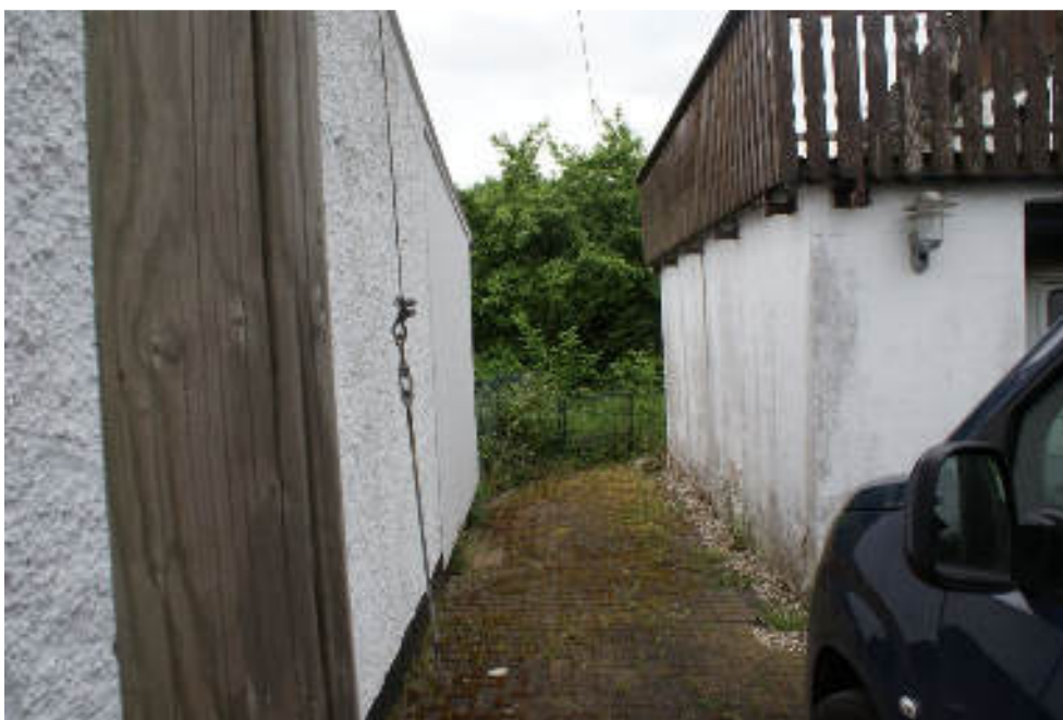
Bild 12 Durchgang neben der Garage an der Nordgrenze in den Innenhof und Garten / Vorne Strommast der Freileitung