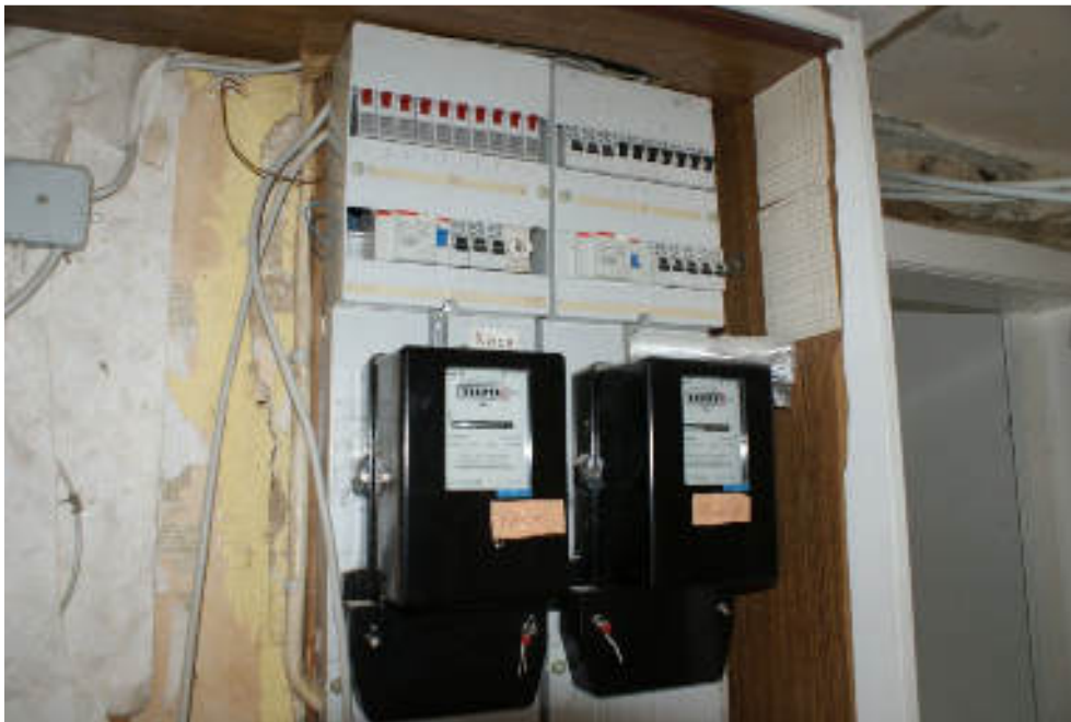
Bild 33 Detail Elektroählerkasten OG/ Versorgung vom Dachreiter