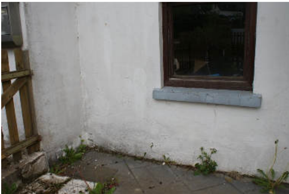
Bild 64 Putzschäden am Sockel und zur Garage vorne