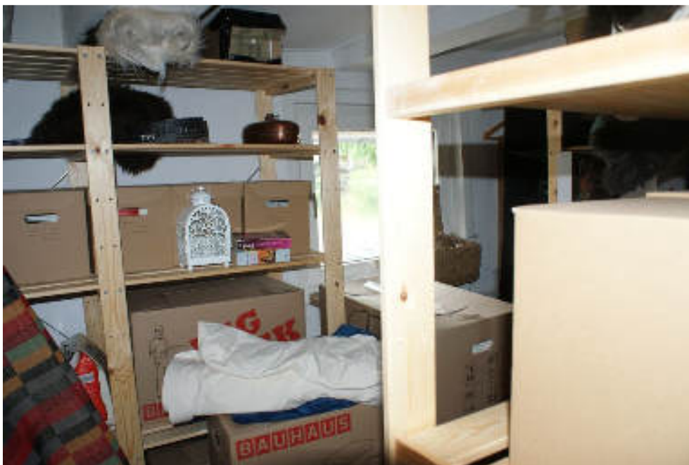
Bild 34 Raum 1 OG vorne links komplett zugestellt, nicht begehbar