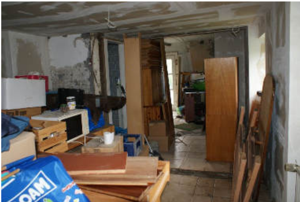
Bild 25 Blick von Diele in Flur EG an der Frontseite / links Küchenbereich