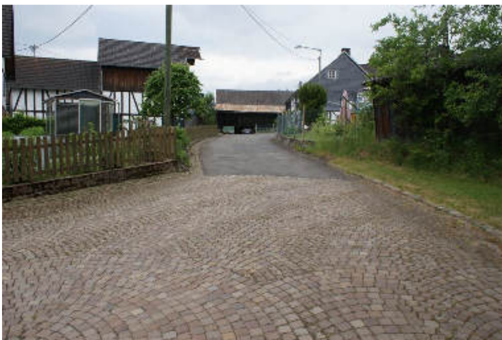
Bild 2 „Wiesenstraße“ nördl. Straßenarm nach Westen zur „Zinshardt. Str.“