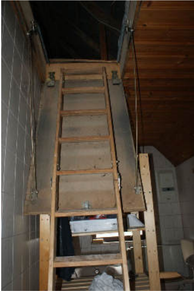
Bild 49 Einschubtreppe im Bad zum Dachboden