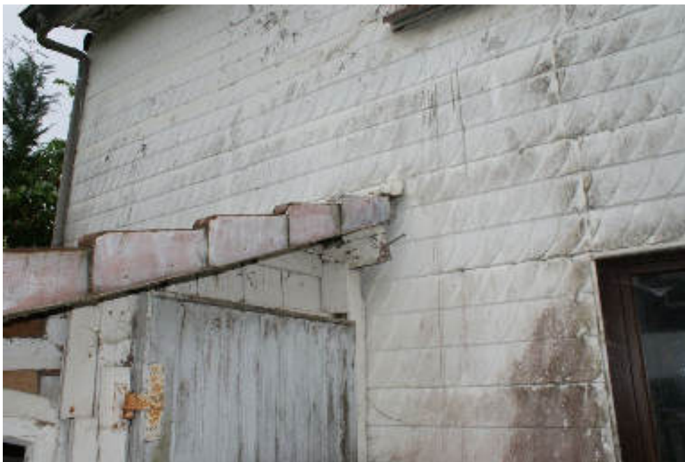
Bild 68 Schäden am Anbau zum Schuppen