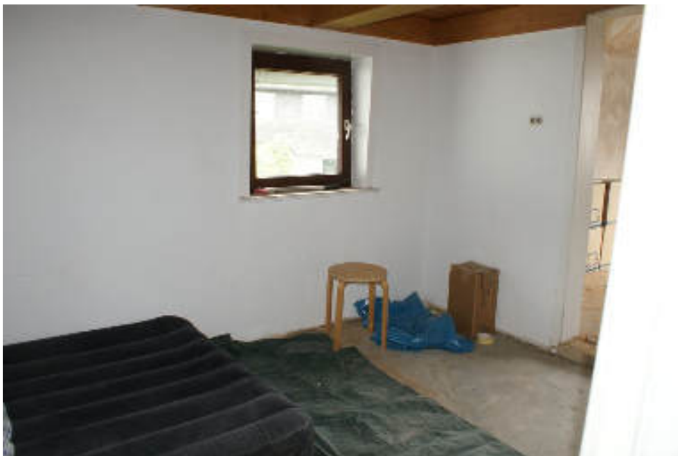
Bild 42 Weiterer Raum OG