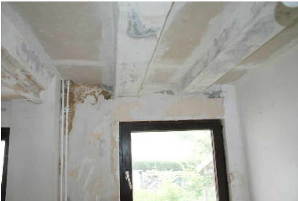
Bild 81 Schäden an Deckenbalken Anbau /Wasserschaden oben