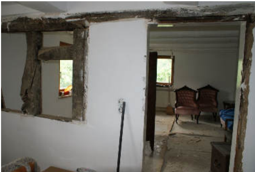
Bild 39 Angrenzender Anbau OG/ Detail alte Außenwand Fachwerk