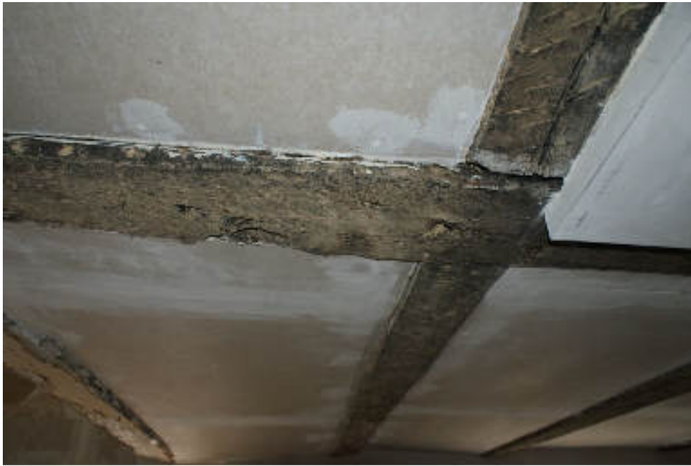
Bild 75 Beispiel für marode Deckenbalken im Vorderhaus