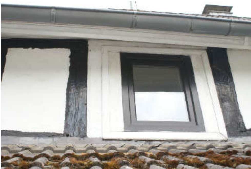
Bild 57 Fachwerkschäden OG Vorderhaus