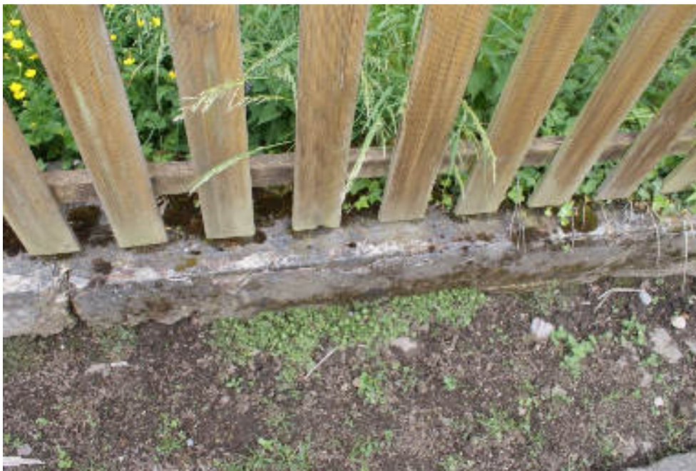
Bild 87 Beispiel für Risse und Schäden an Stützmauer zur Straße / Alter Zaun

Bei Bedarf können weitere Fotos besonders zu Mängeln und Schäden angefügt werden