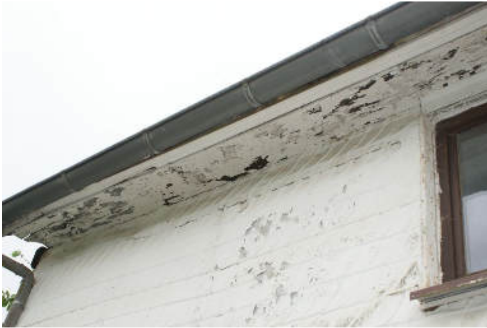
Bild 67 Beispiel für Schäden am Holzwerk, hier am Anbau