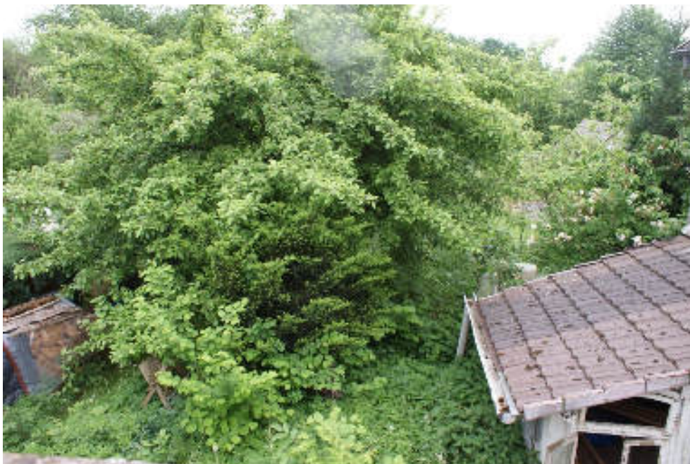
Bild 38 Blick nach Osten auf den verwilderten Garten