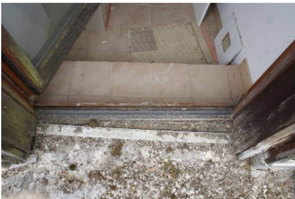
Bild 74 Mangel: OG liegt unter der Dachterrasse Gefahr von Wassereintritt