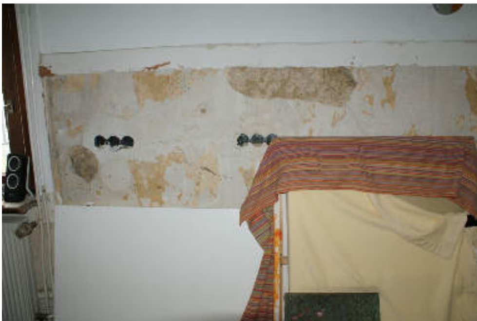
Bild 84 Beispiel für begonnene, unfertige Elektroinstallation