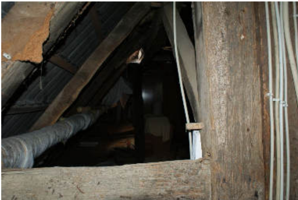
Bild 51 Dachraum Anbau / links Heizungsleitung