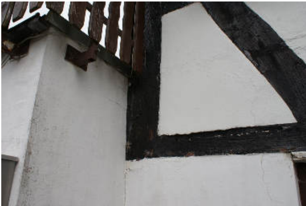
Bild 65 Holzschäden am Anschluss der Garage / Risse in Ausfachungen und an der Garage