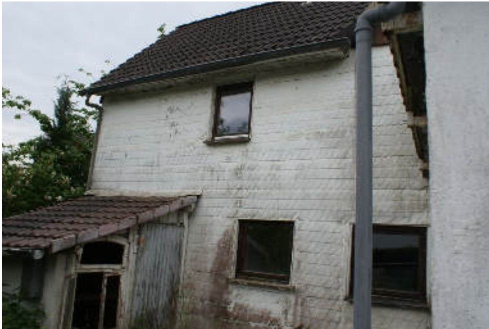
Bild 13 Blick auf Anbau und Innenhof hinter der Garage