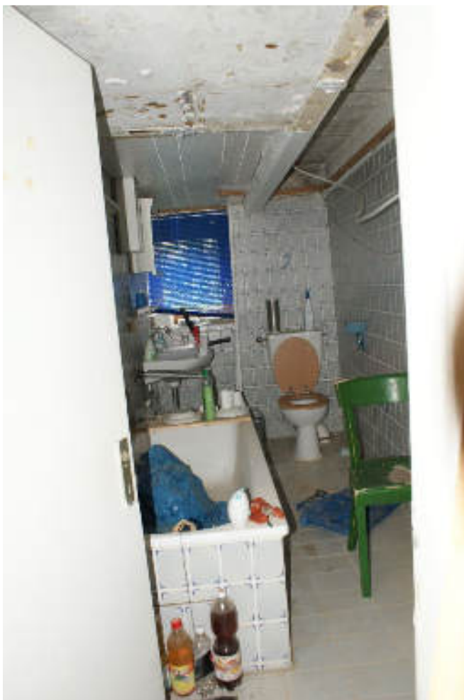
Bild 26 Blick in altes Bad EG