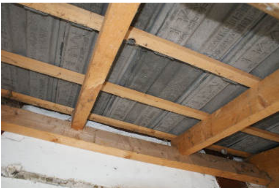
Bild 54 Ungedämmtes offenes Dach des Windfangs