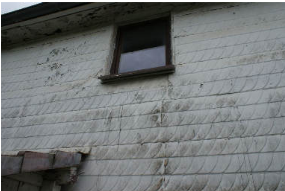
Bild 66 Schadhafte Blechverkleidung am Anbau