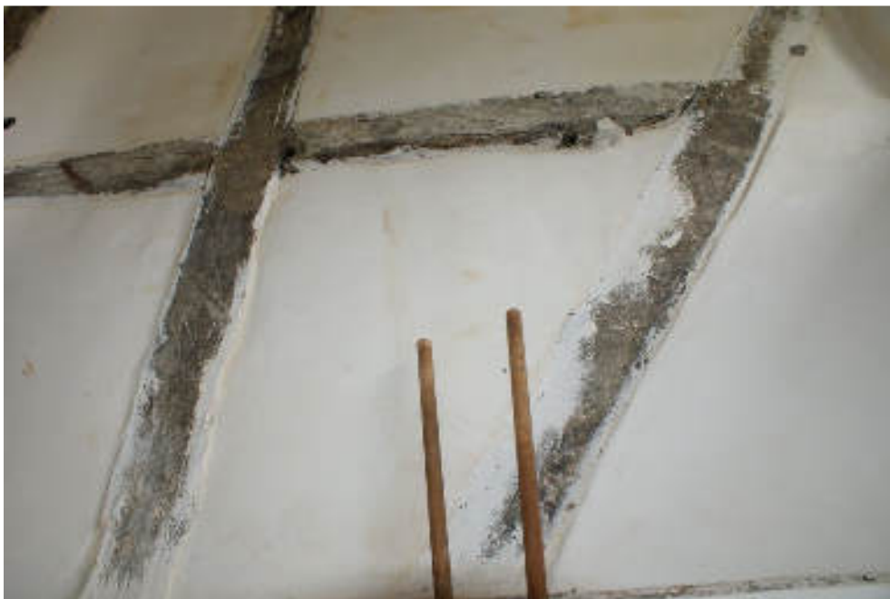
Bild 76 Putzschäden innen am Fachwerk