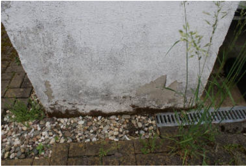
Bild 71 Ebenso vorne neben dem Garagentor, Feuchte zieht auch nach innen