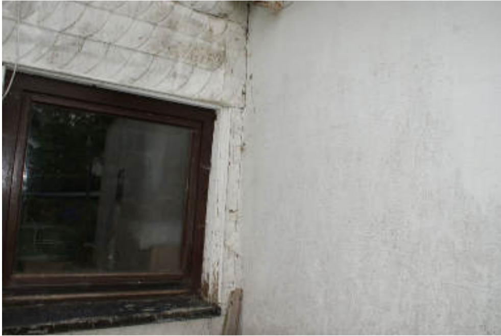
Bild 63 Schäden am Übergang Anbau zu Garage und Holzleibungen