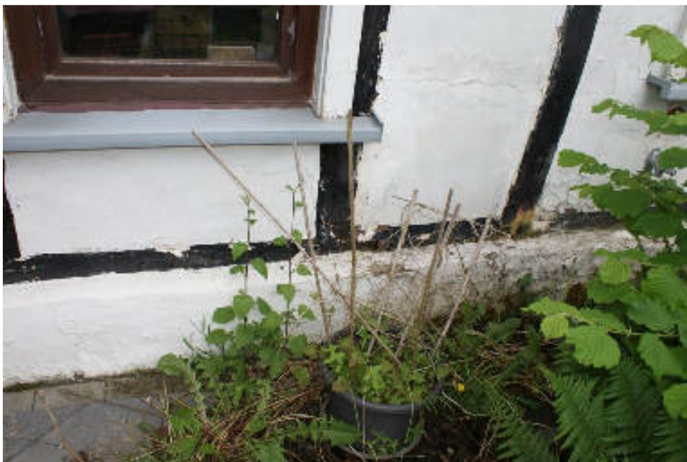
Bild 56 Beispiel für Schäden am Fundament/Sockel und Fachwerk Vorderhaus