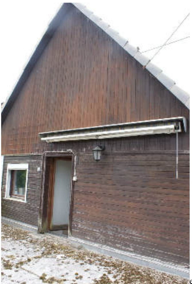
Bild 36 Nordgiebel über der Terrasse /alte Holzverschalung + Markise