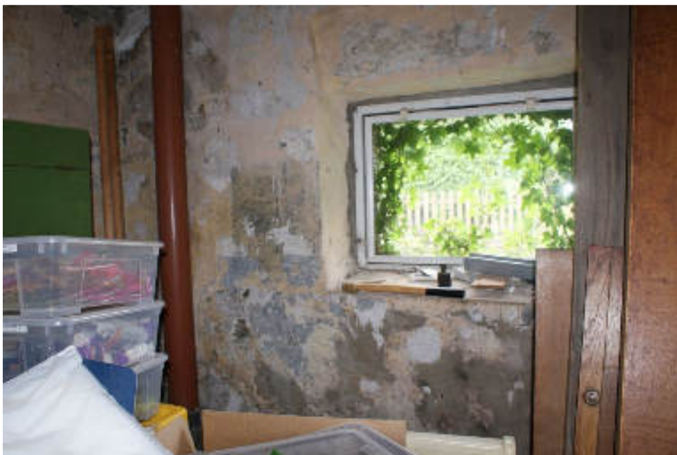
Bild 28 Abstellraum mit altem Fenster nach hinten /Osten / Schimmel