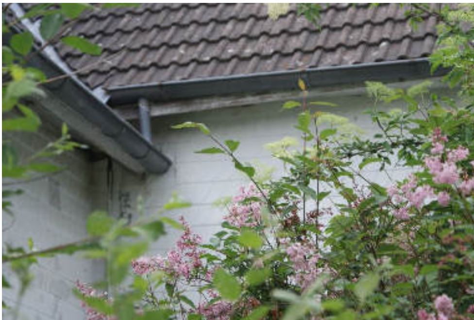
Bild 11 Detail Übergang Vorderhaus/Anbau / in der Ecke Gasleitung zum Dachboden