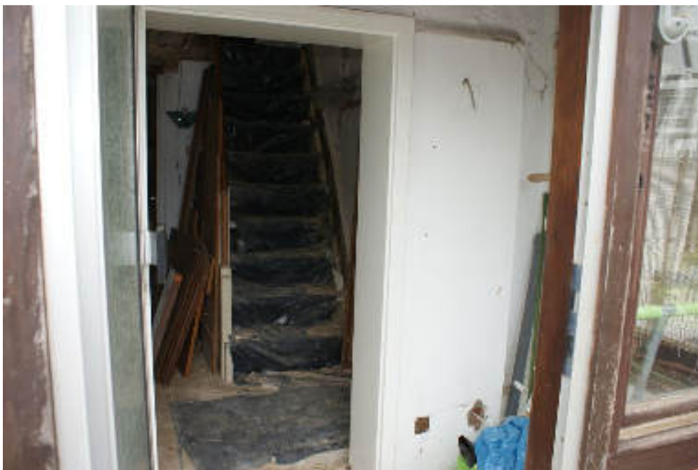
Bild 20 Eingang im einfachsten Windfang/Blick in Diele Treppenhaus