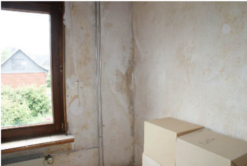
Bild 85 Aufputzinstallation und Feuchte /Risse in der Ecke