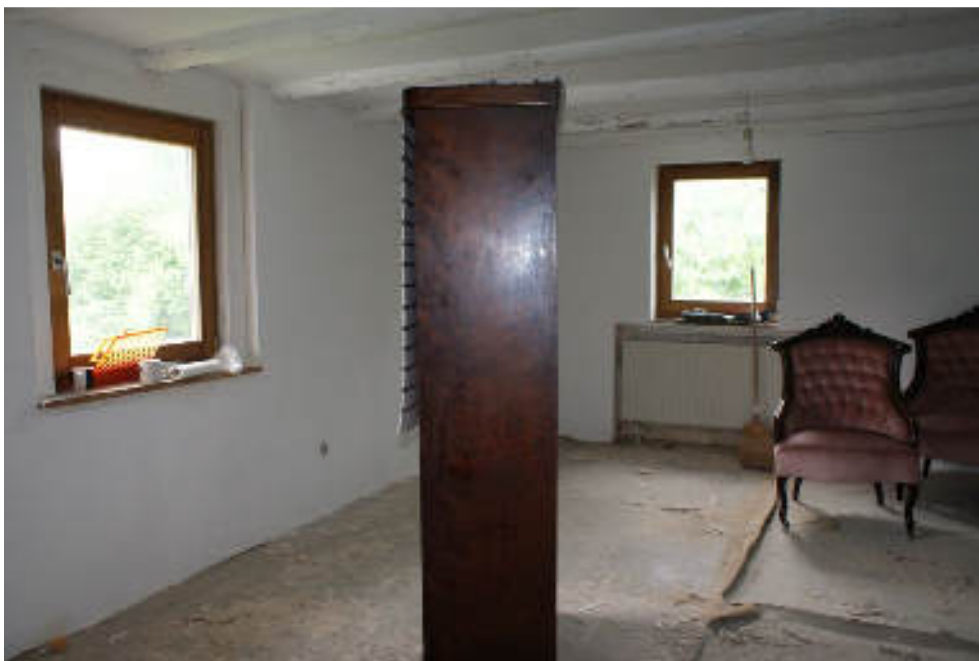
Bild 40 Raum OG im Anbau