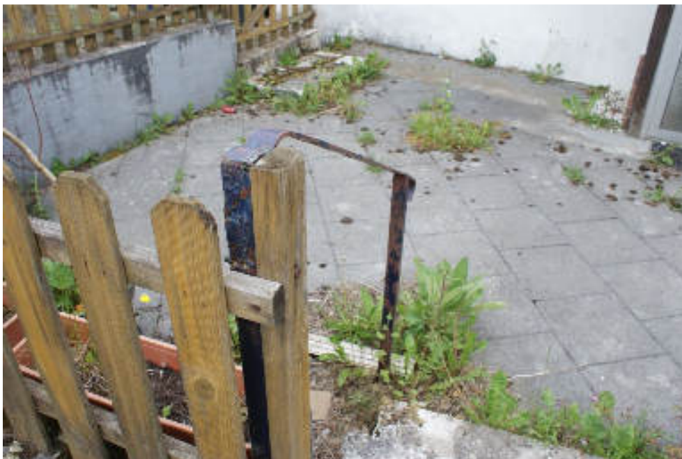
Bild 18 Treppe mit drei Stufen von der Straße als Zugang