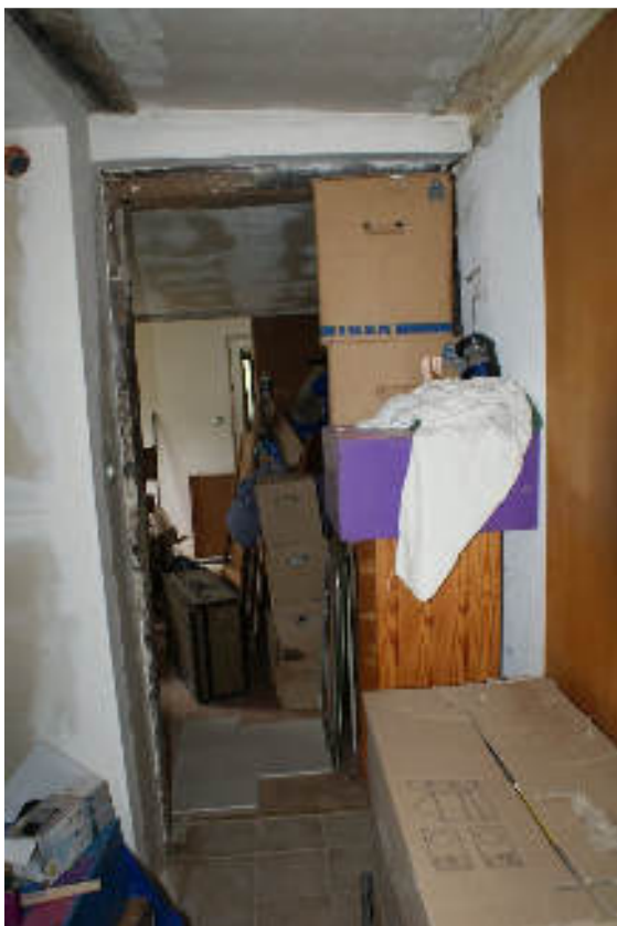
Bild 22 Durchgang nach hinten