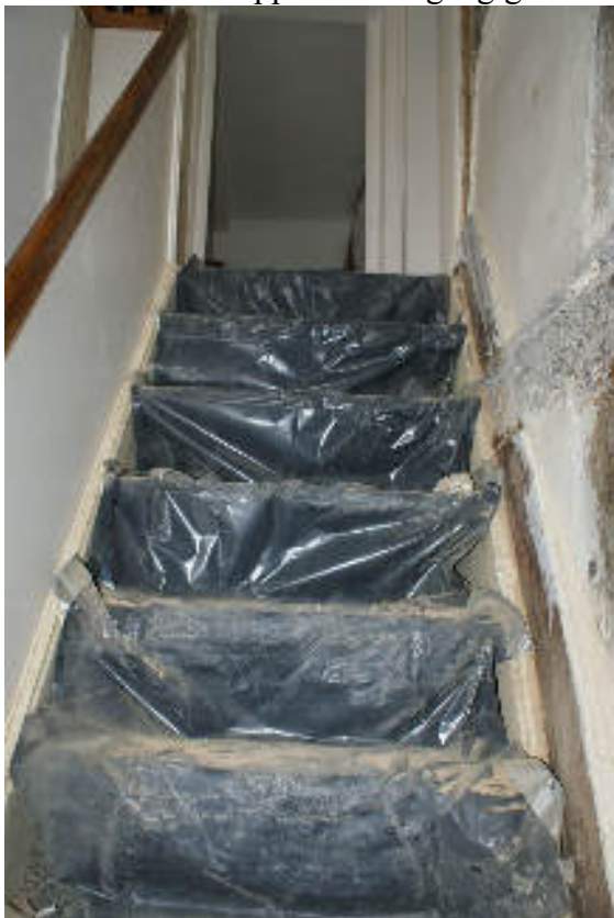
Bild 24 Einfache alte Holztreppe/Stiege zum OG