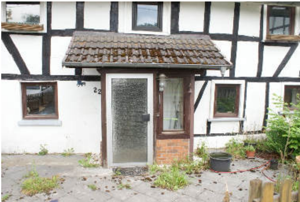
Bild 19 Hauseingang mit vorgesetztem, einfachstem Windfang