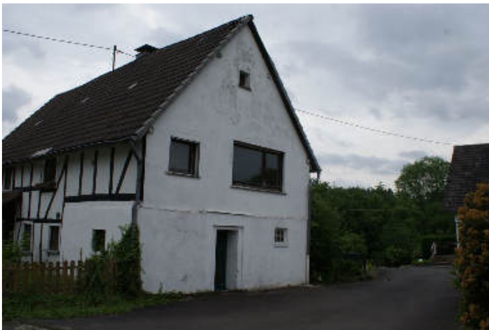
Bild 7 Ansicht Vorderhaus von Süden / ehem. Stallanbau mit Nebeneingang