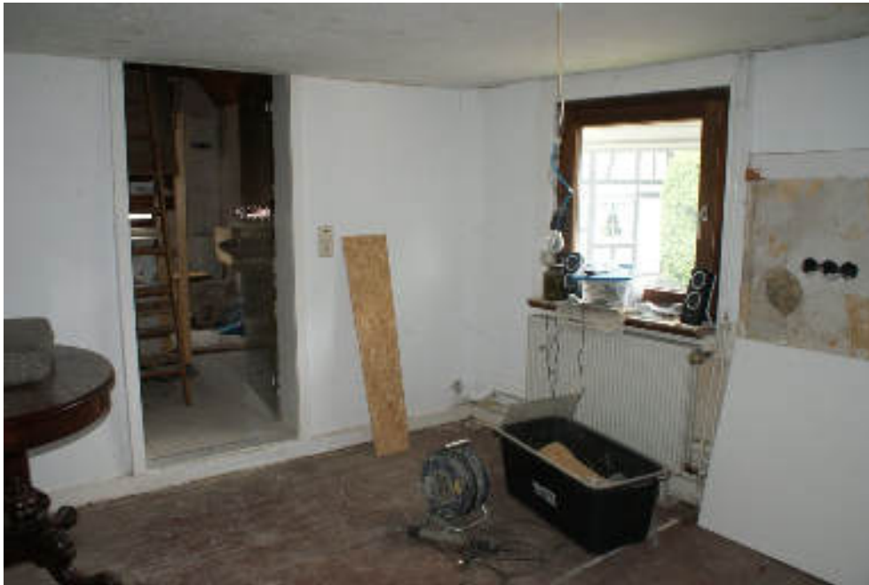
Bild 45 Zimmer OG frontseitig / gefangenes Bad OG