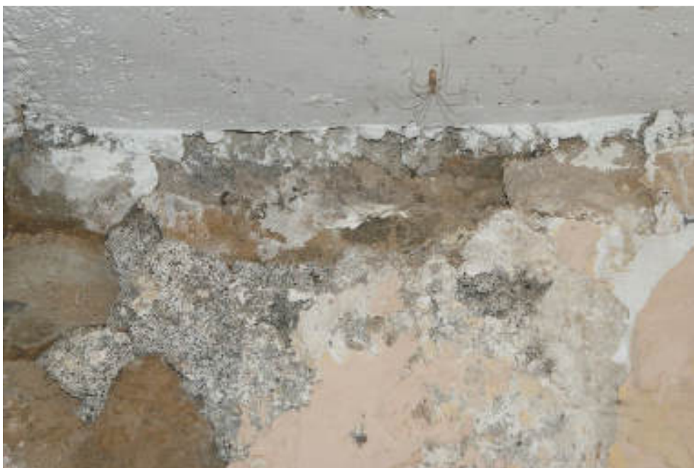
Bild 80 Putzschäden mit Schimmelbildung an alter Steinmauer