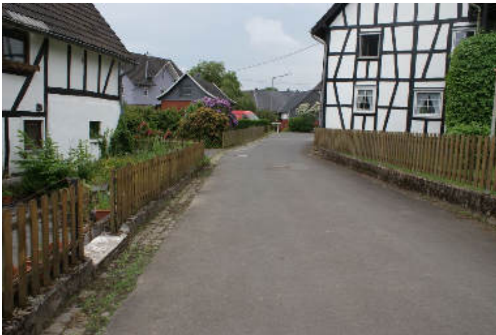
Bild 3 „Wiesenstraße“ südlicher Straßenarm nach Südwesten „Zinshardter Straße“ / links Bewertungsobjekt Nr. 22