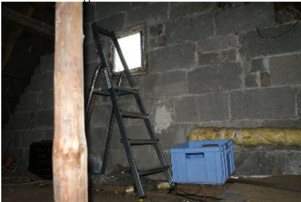
Bild 50 Dachboden / Giebel in jüngerem Bimsmauerwerk