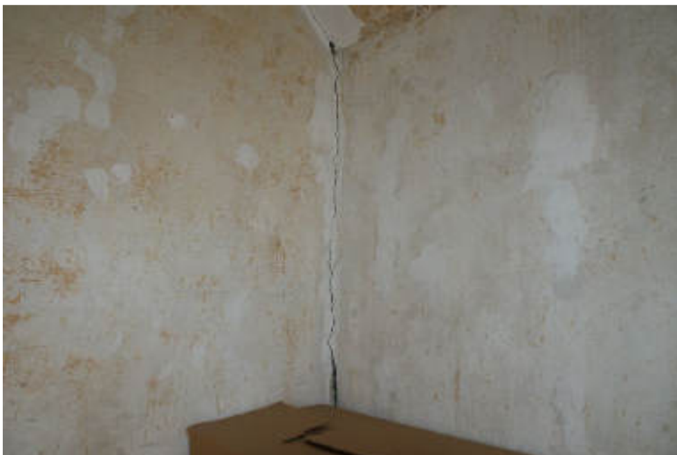
Bild 86 Riss in der Ecke im OG ehem. Stallanbau