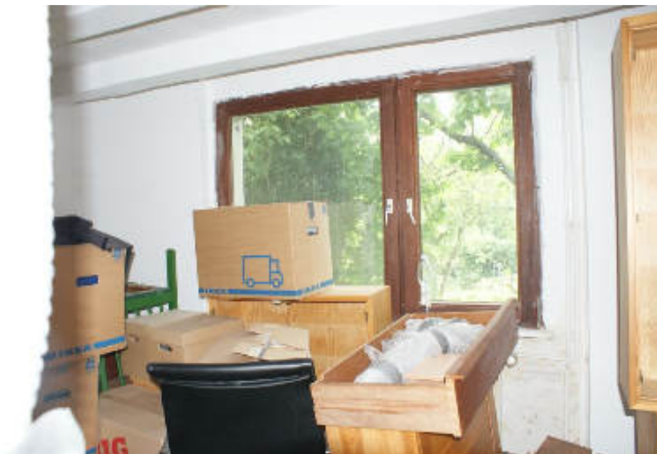
Bild 30 Blick in Zimmer Anbau EG