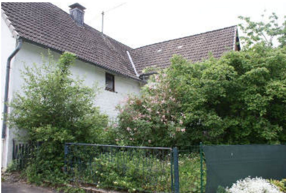
Bild 9 Vorderhaus von Südosten / rechts rückseitiger Anbau / Davor im Garten soll der Flüssiggastank stehen / überwuchert und nicht auffindbar