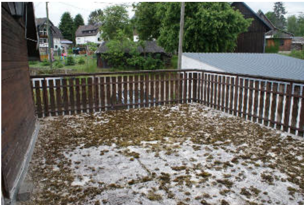
Bild 35 Blick auf die Dachterrasse an der Nordseite und zur Straße, ohne Belag