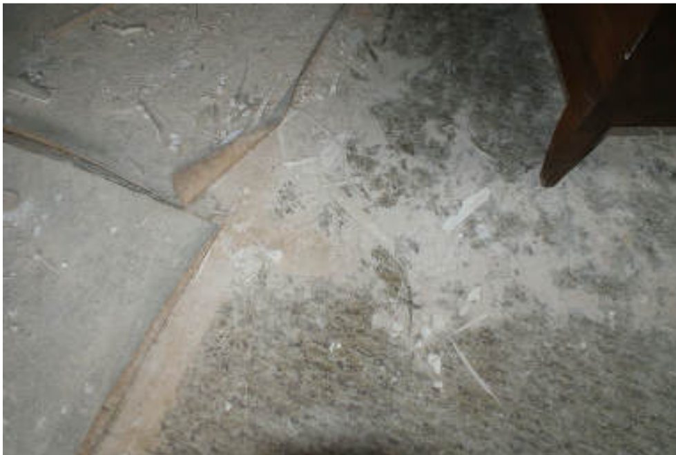
Bild 83 Desolate alte PVC-Böden im OG