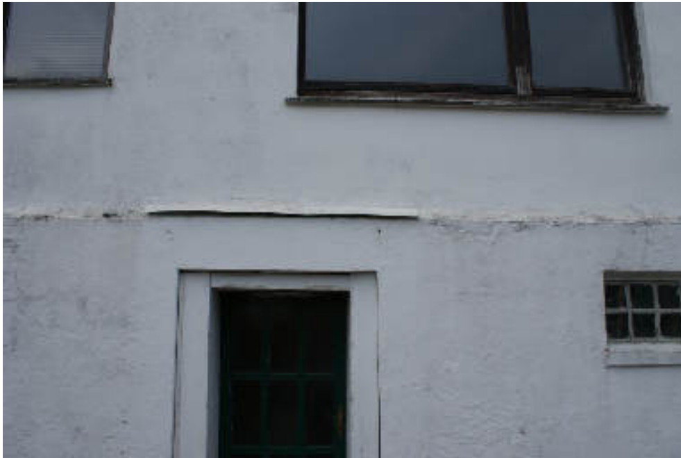
Bild 59 Putzschäden EG zu OG ehem. Stallanbau, verm. später aufgestockt