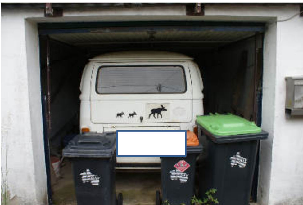
Bild 15 An der Nordseite angebaute Massivgarage / früher Schuppen