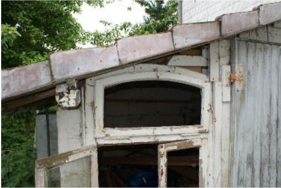
Bild 69 Desolater alter Schuppen, abgängig