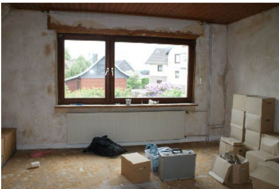
Bild 44 Raum OG im ehem. Stallanbau mit Fenster im Südgiebel