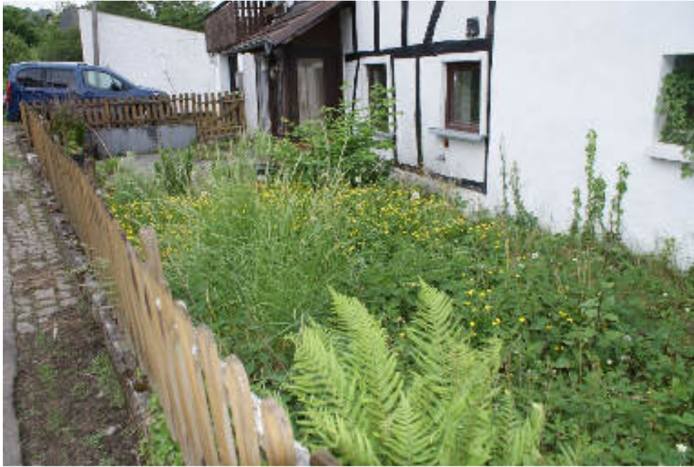
Bild 17 Verwilderter Vorgarten von Süden Richtung Norden