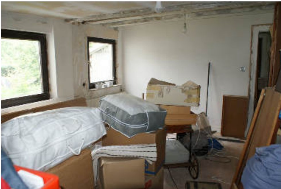
Bild 29 Zimmer Vorderhaus hinten