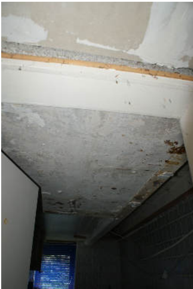
Bild 77 Stark schadhafte Decke Bad EG mit Wasserschaden