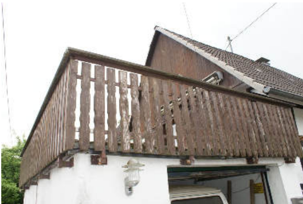
Bild 16 Dachterrasse auf der Garage ohne entsprechenden Grenzabstand