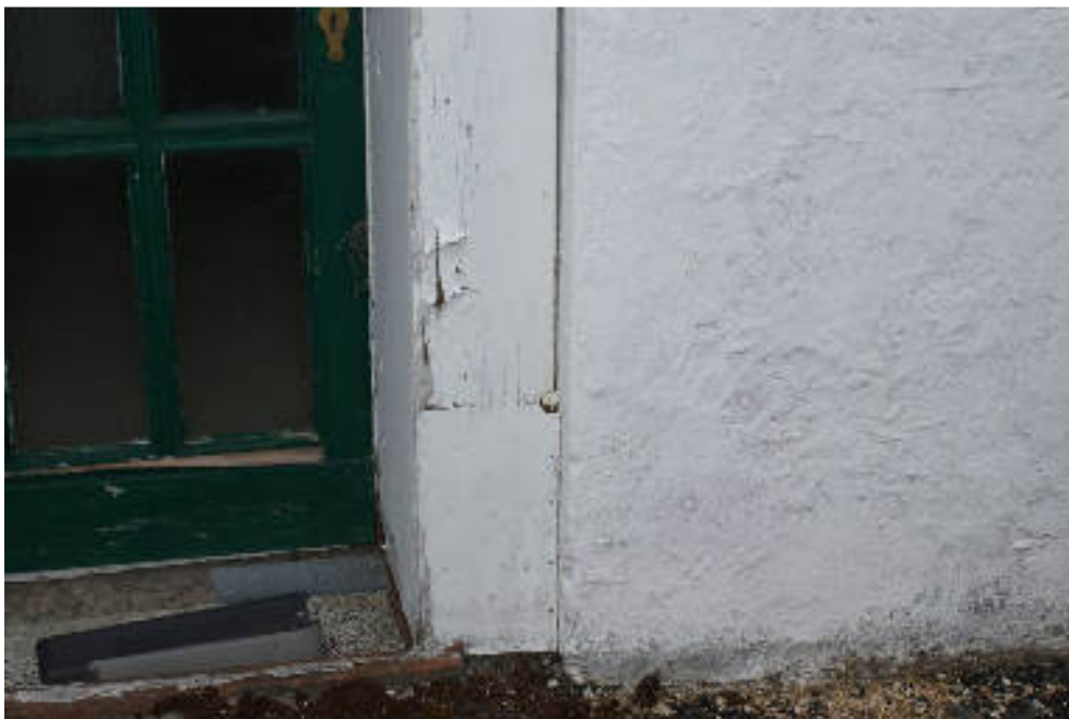
Bild 58 Nässe und Sockelputzschäden an der Südseite Bereich der Nebentür