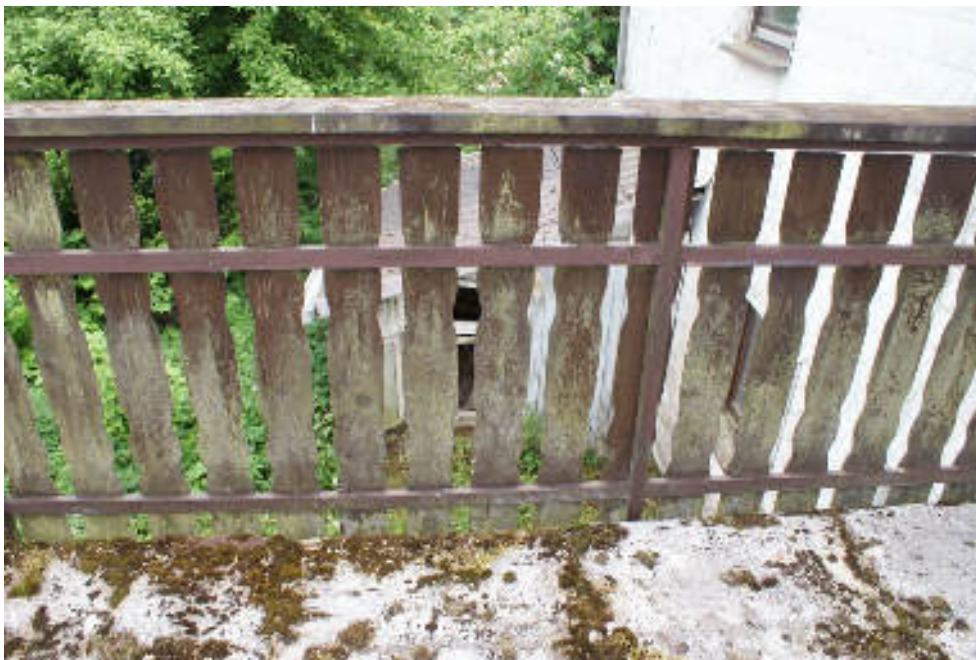
Bild 73 Fehlender Belag und Rinne an der Dachterrasse / Verwitterte Brüstung