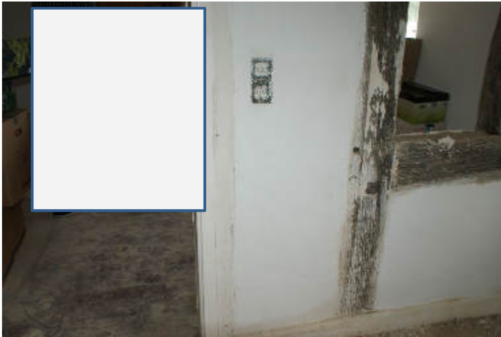
Bild 41 Alte Holzböden OG