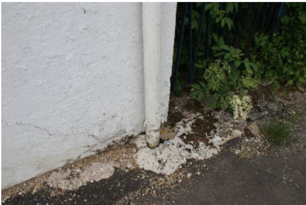
Bild 62 Stark schadhafes Fallrohr und Mauerwerksschäden Südgiebel