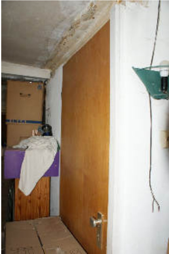
Bild 23 Kellertreppe nicht zugänglich