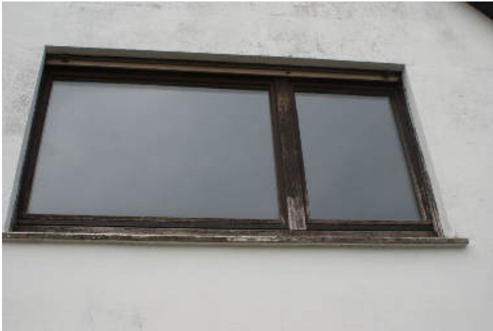
Bild 61 Beispiel für verwittertes altes Holzfenster