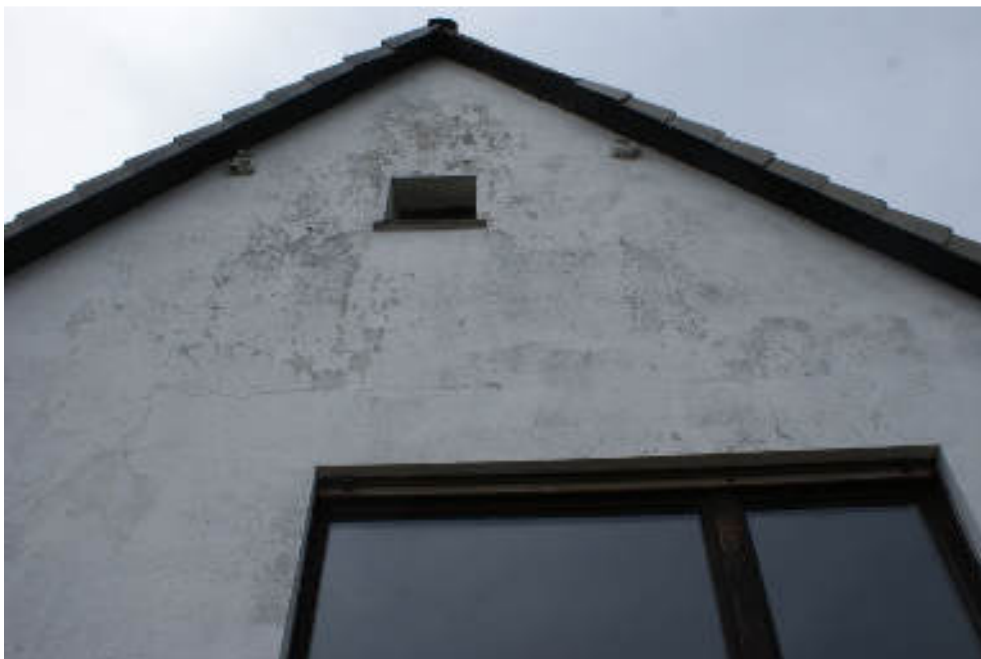
Bild 60 Beispiel für Feuchte- und Putzschäden Südgiebel