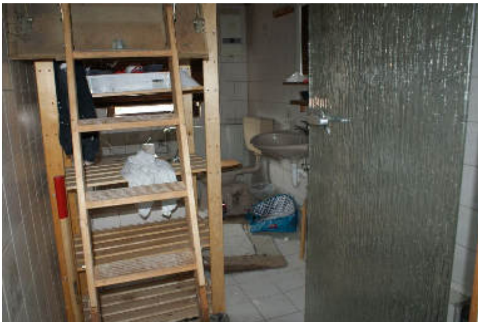
Bild 46 Blick in das Bad OG