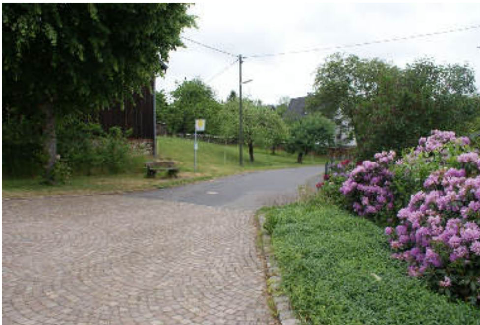
Bild 1 „Wiesenstraße“ mit Kreiselparkplatz am Zusammenfluss der beiden Straßenzüge in östliche Richtung mit Haltestelle des Bürgerbusses