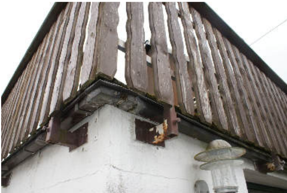
Bild 72 Beispiel für Nässe- und Rostschäden Garagendecke + Dachterrasse