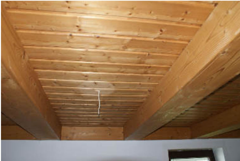
Bild 43 Detail Holzdecke OG