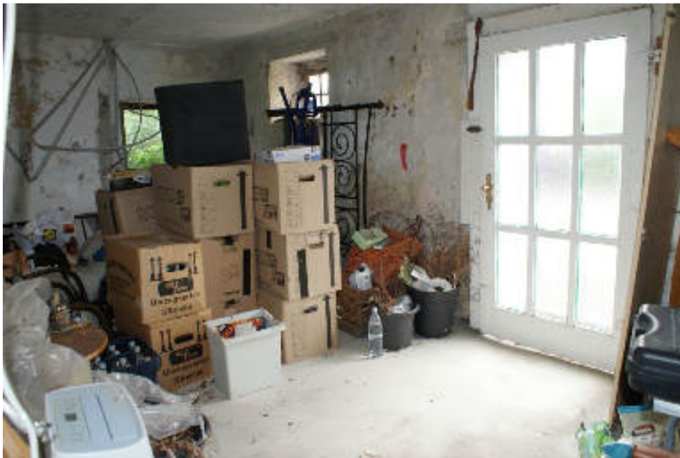
Bild 27 Südlicher Trakt im EG ehem. massiven Stallanbau / Tür im Südgiebel