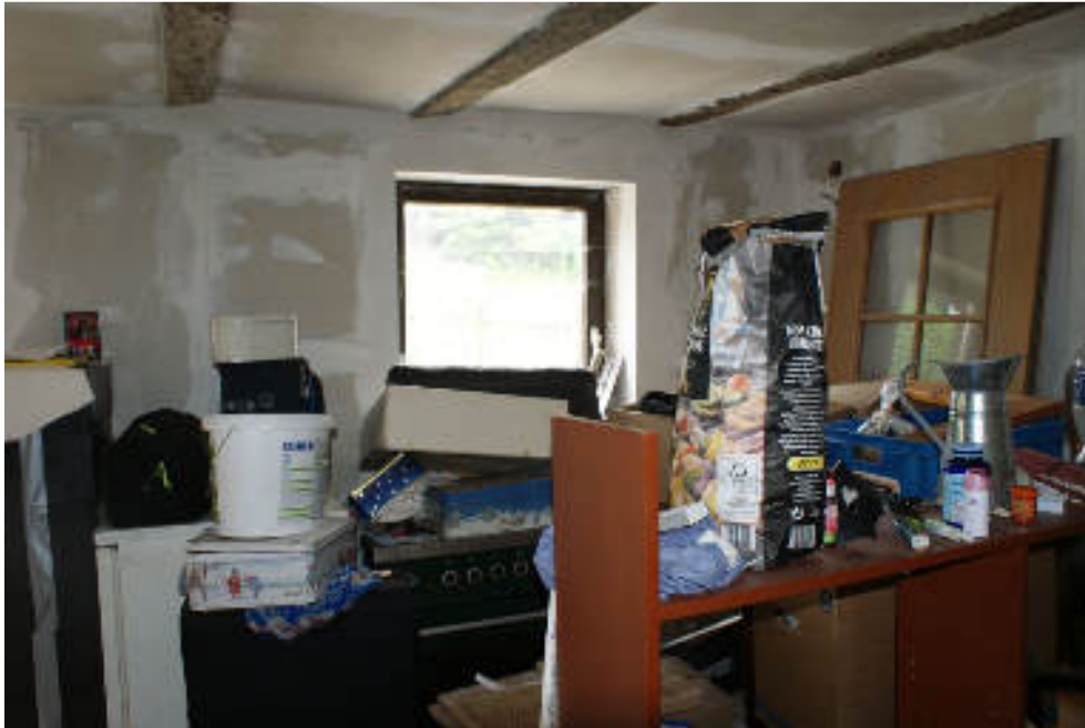
Bild 21 Diele EG vorne links