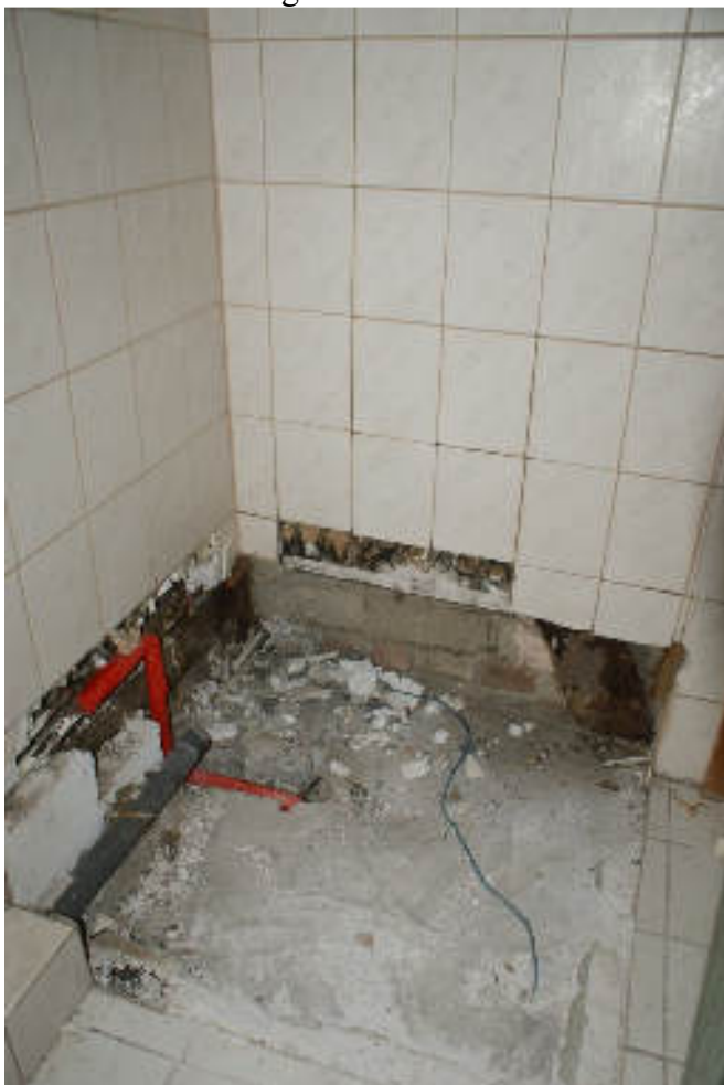
Bild 48 Bereich der ehemaligen, entfernten Dusche