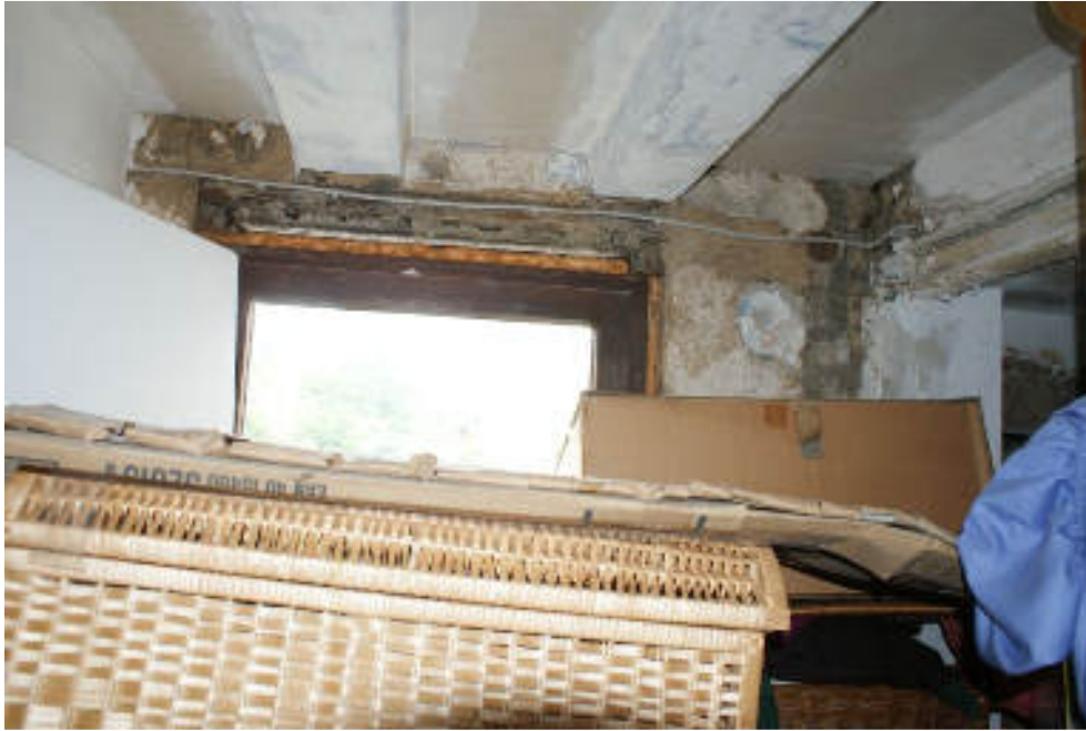
Bild 31 Weiterer Raum Anbau EG raumhoch vollgeräumt