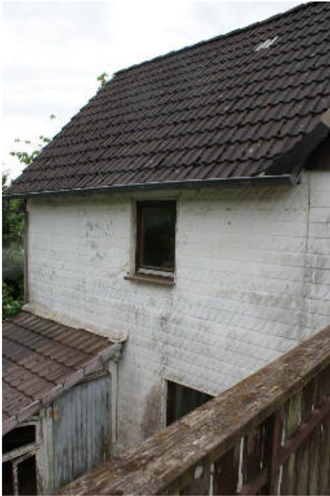
Bild 37 Blick vom Balkon nach Osten / Anbau