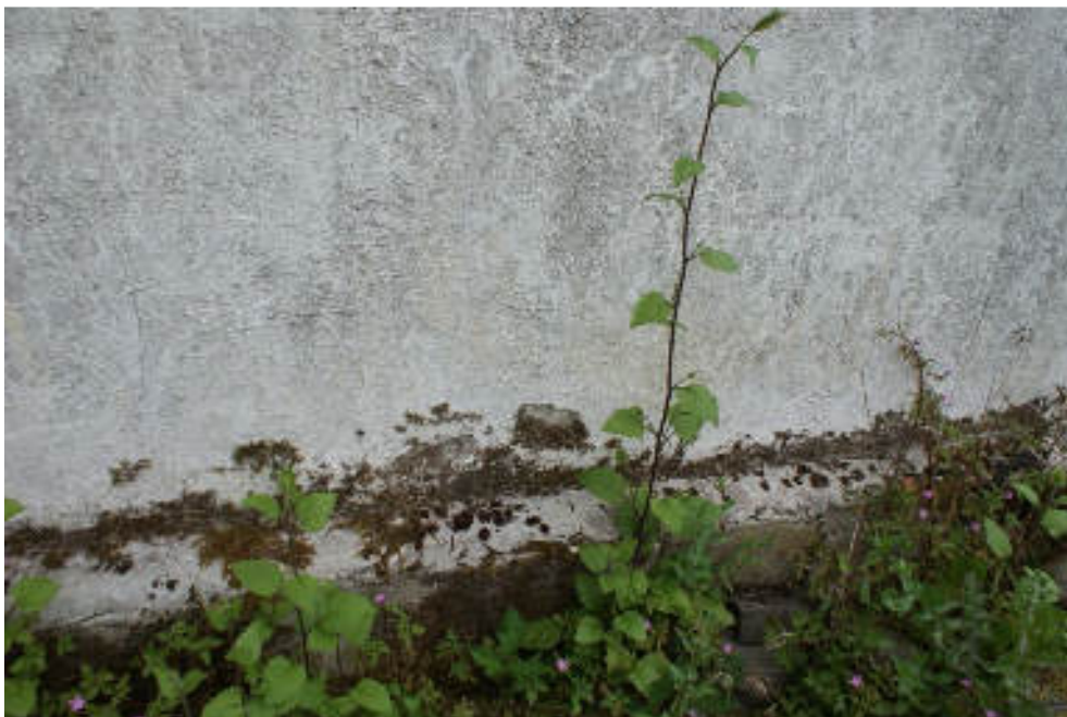
Bild 70 Nässeschäden am Sockel der Garage hinten