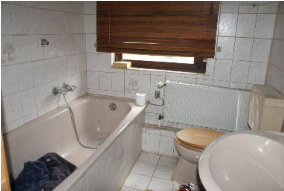
Bild 47 Ausstattung Bad OG