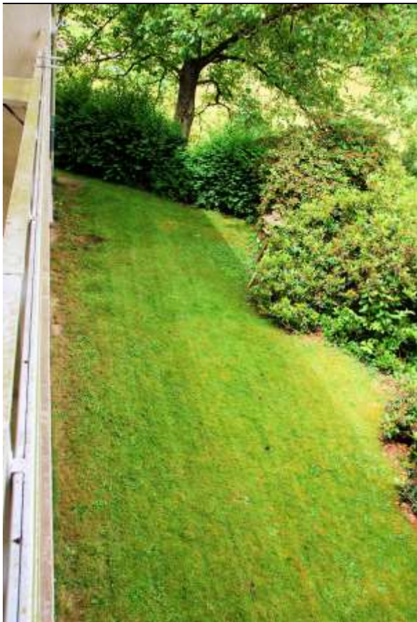
▼ Foto 10 Ritterseifener Weg 30, Garten auf der Rückseite, südlicher Teil