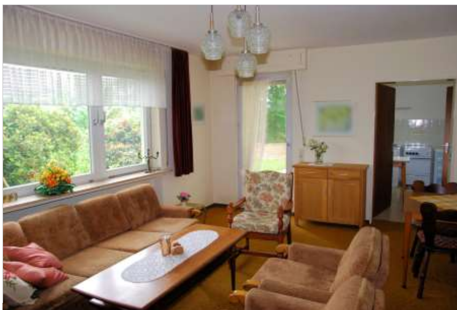
Foto 42 Ritterseifener Weg 30, Untergeschoss, Wohnraum