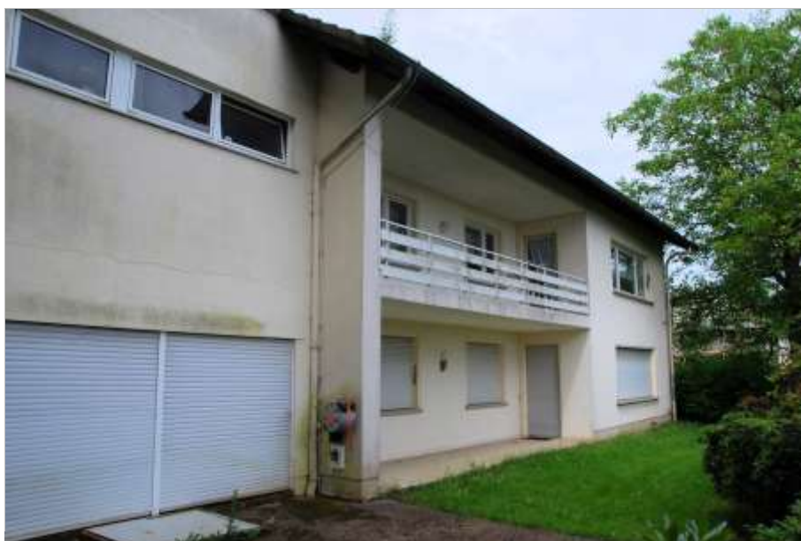
Foto 5 Ritterseifener Weg 30, Rückseite