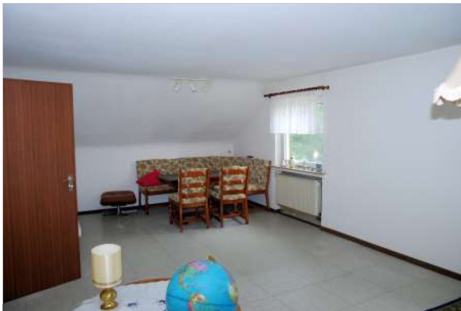
Foto 29 Ritterseifener Weg 30, Dachgeschoss, nördlicher Wohnraum