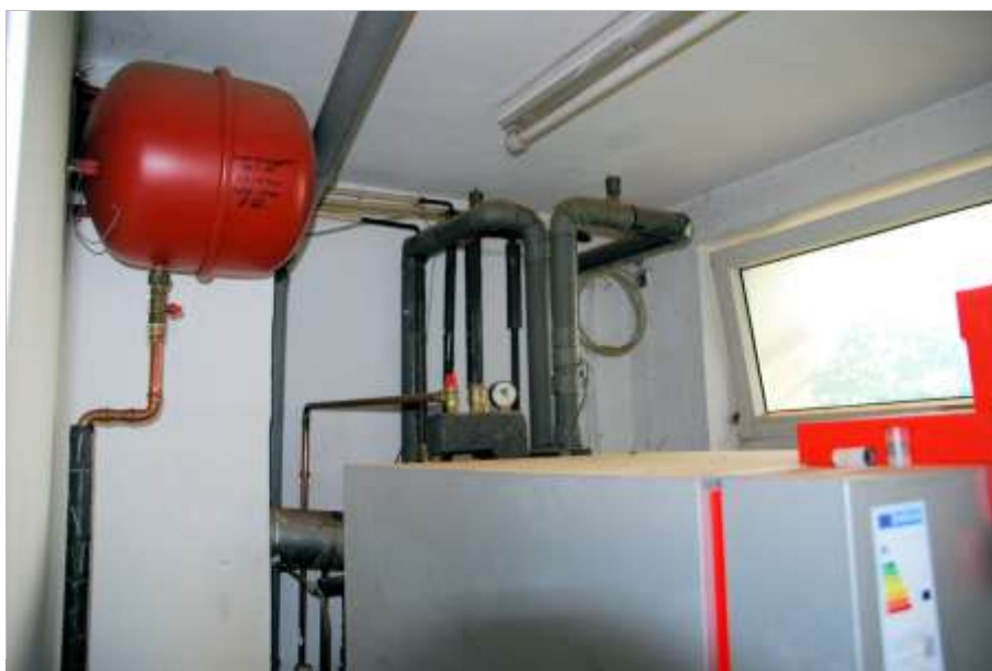
Foto 53 Ritterseifener Weg 30, Heizungsraum hinter der Garage