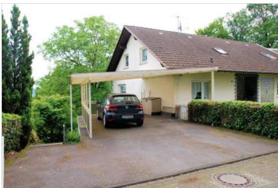
Foto 3 Ritterseifener Weg 30, Straßenseite mit Carport