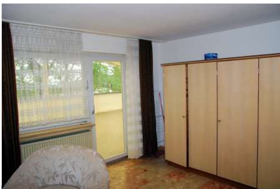
Foto 34 Ritterseifener Weg 30, Dachgeschoss, südlicher Wohnraum