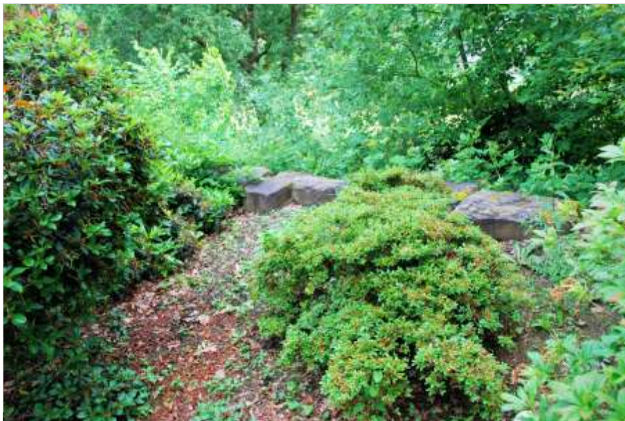
Foto 14 Ritterseifener Weg 30, Böschungssicherung auf der Rückseite