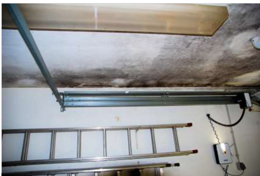
Foto 54 Ritterseifener Weg 30, Feuchtigkeit in der Garage