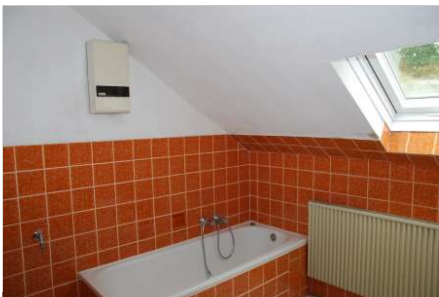
Foto 31 Ritterseifener Weg 30, Dachgeschoss, Bad