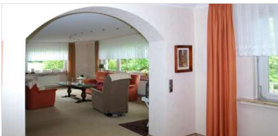
Foto 21 Ritterseifener Weg 30, Erdgeschoss, Wohnraum