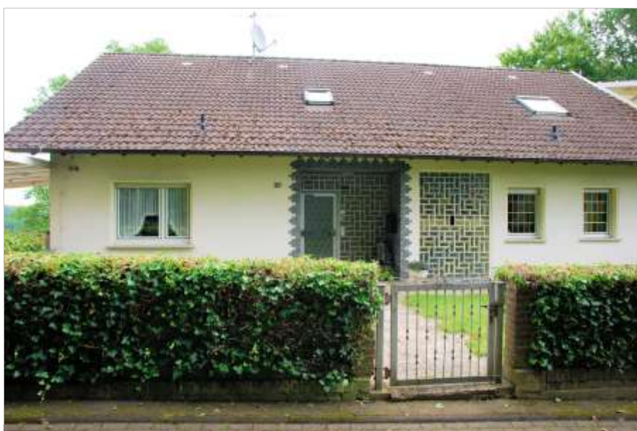
Foto 2 Ritterseifener Weg 30, Straßenseite mit Hauingang