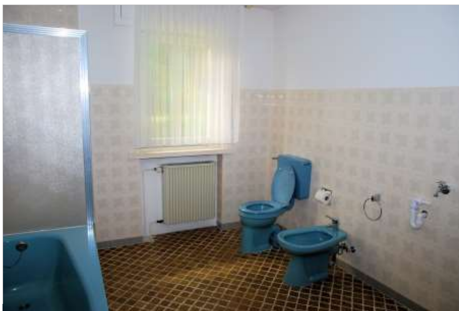
Foto 24 Ritterseifener Weg 30, Erdgeschoss, Bad