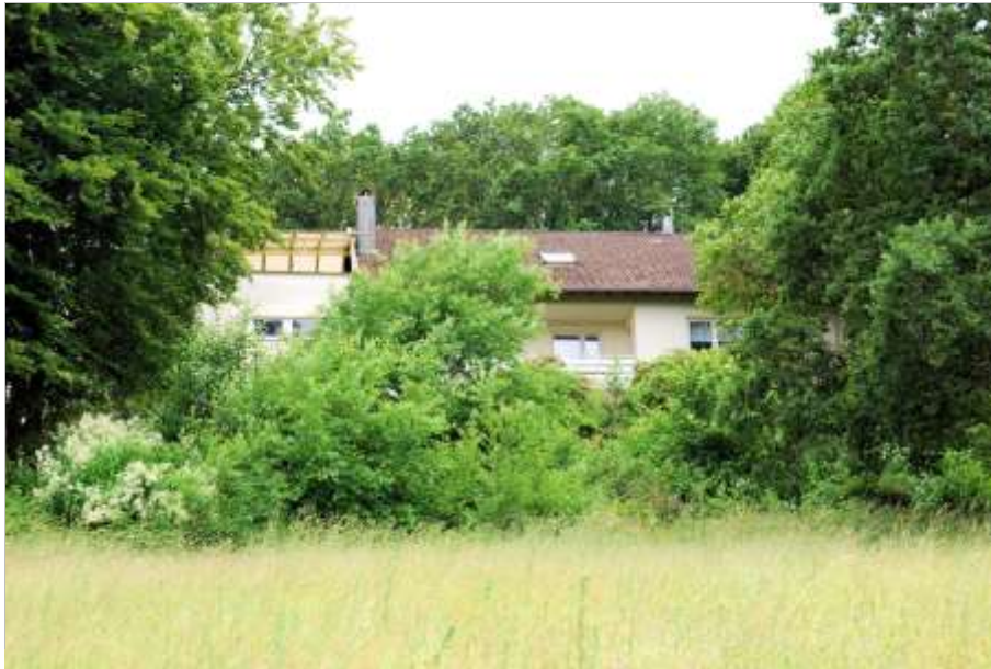
Foto 13 Ritterseifener Weg 30, Rückseite