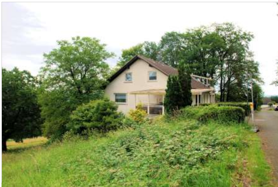
Foto 4 Ritterseifener Weg 30, Nordwestseite mit Carport