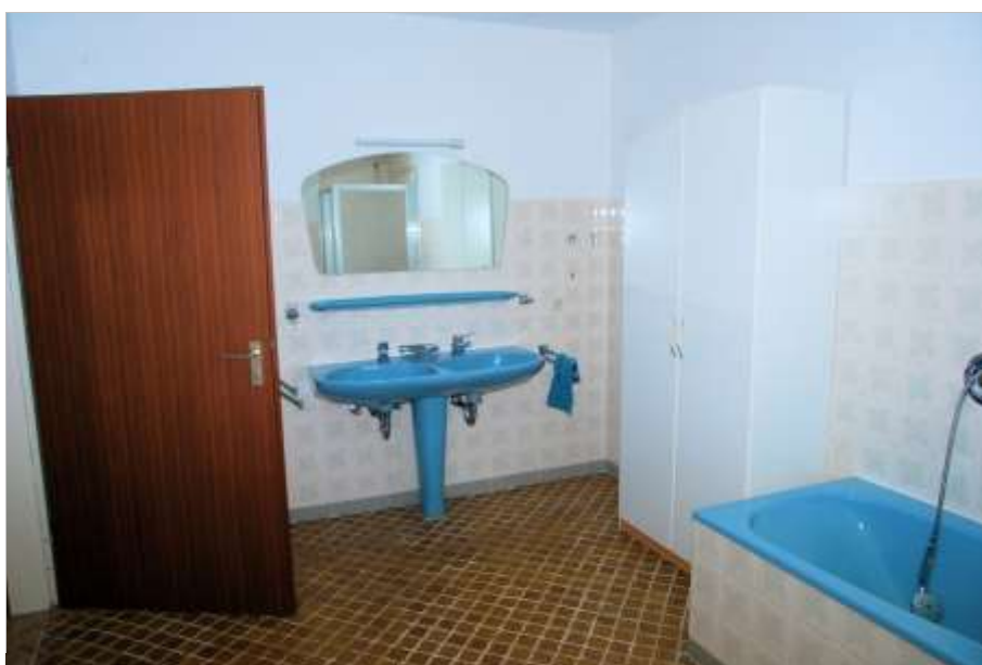
Foto 25 Ritterseifener Weg 30, Erdgeschoss, Bad