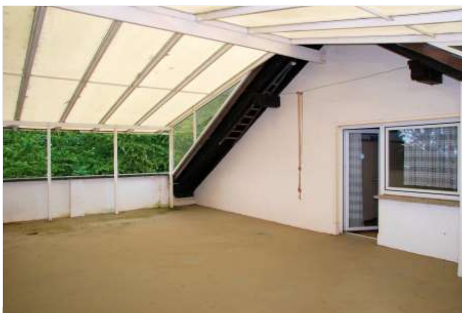
Foto 36 Ritterseifener Weg 30, Dachgeschoss, Terrasse