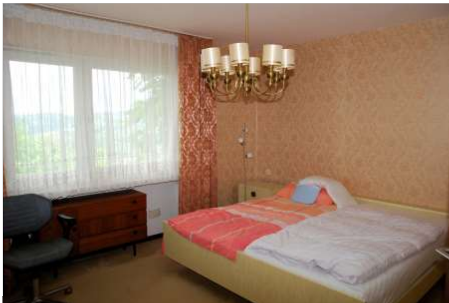
Foto 19 Ritterseifener Weg 30, Erdgeschoss, Schlafraum