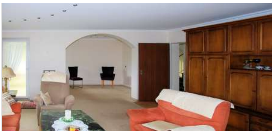
Foto 20 Ritterseifener Weg 30, Erdgeschoss, Wohnraum