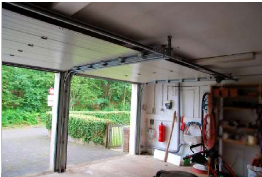
Foto 52 Ritterseifener Weg 30, Garage