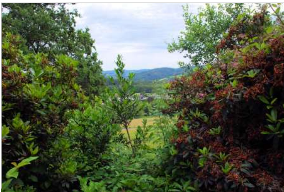
Foto 15 Ritterseifener Weg 30, Blick ins Tal vom UG-Niveau auf der Rückseite