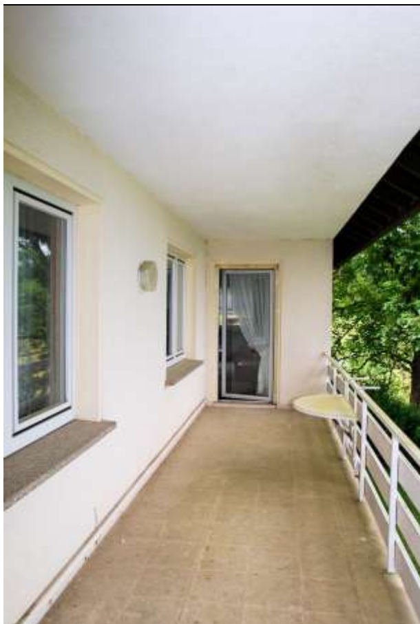
◀ Foto 22 Ritterseifener Weg 30, Erdgeschoss, Loggia