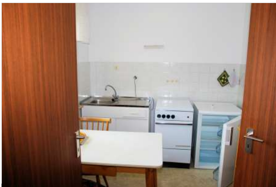
Foto 43 Ritterseifener Weg 30, Untergeschoss, Küche