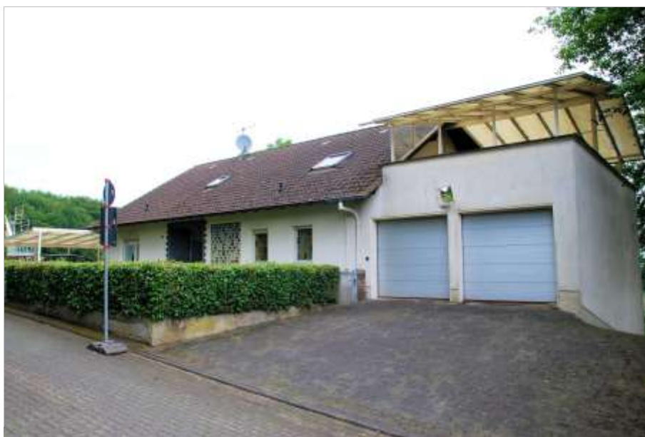
Foto 1 Ritterseifener Weg 30, Straßenseite (Südwesten) mit Garage