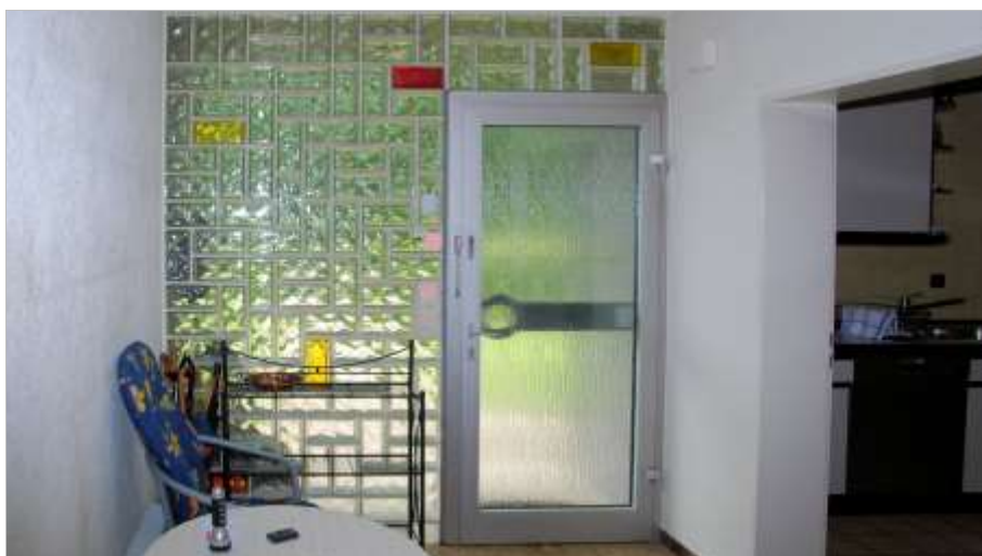
Foto 16 Ritterseifener Weg 30, Erdgeschoss, Hauseingang