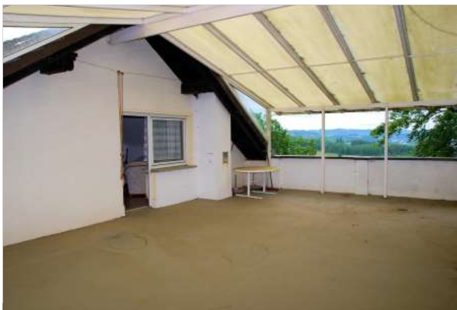
Foto 35 Ritterseifener Weg 30, Dachgeschoss, Terrasse