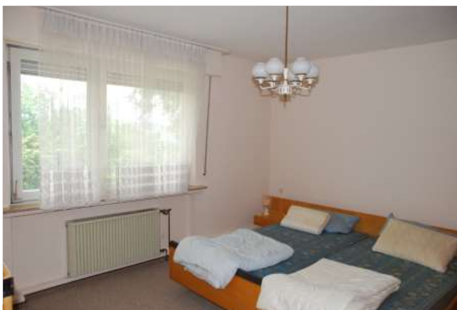
Foto 44 Ritterseifener Weg 30, Untergeschoss, südlicher Schlafraum