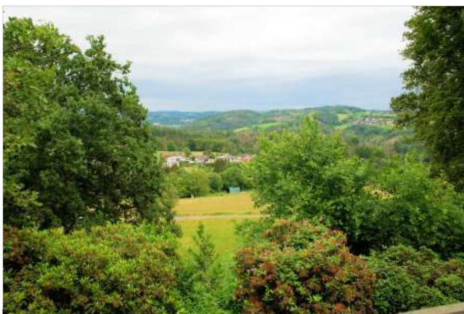
Foto 26 Ritterseifener Weg 30, Erdgeschoss, Blick von der Loggia