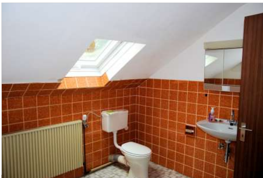
Foto 30 Ritterseifener Weg 30, Dachgeschoss, Bad