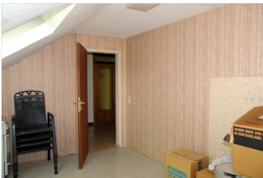
Foto 33 Ritterseifener Weg 30, Dachgeschoss, Küche