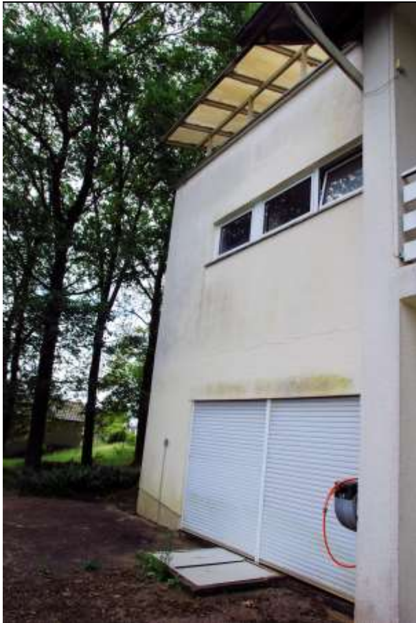
◀ Foto 8 Ritterseifener Weg 30, Rückseite mit Schwimmbad im UG und Garage im EG