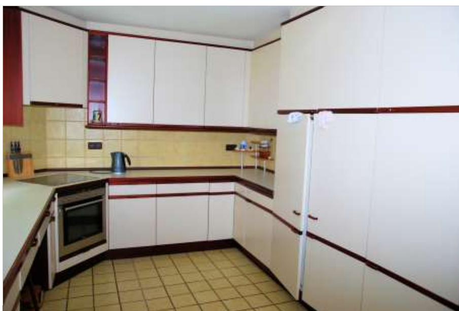
Foto 18 Ritterseifener Weg 30, Erdgeschoss, Küche