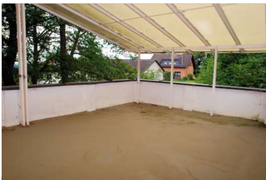
Foto 37 Ritterseifener Weg 30, Dachgeschoss, Terrasse