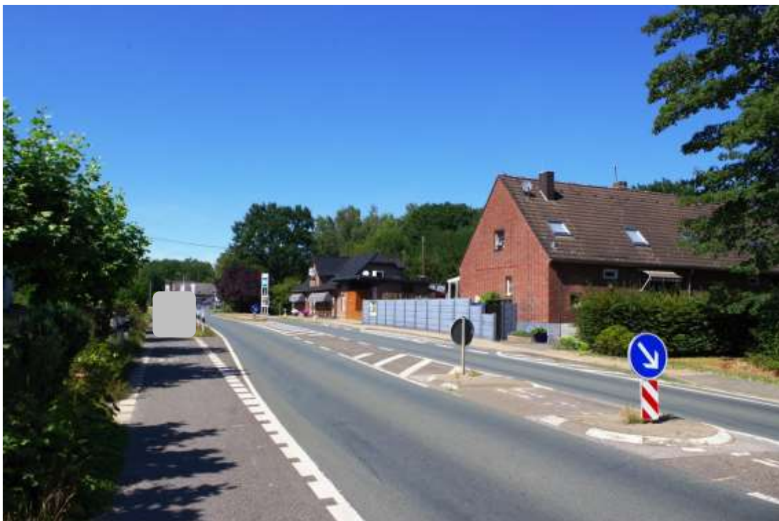
Bild 8: Blick in vorbeiführende Landesstraße L 117 in Richtung Nord