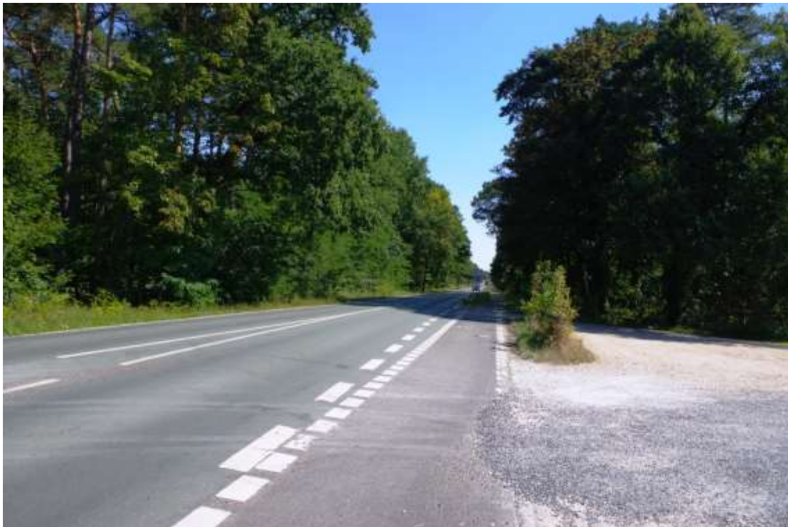
Bild 7: Blick in die vorbeiführende Landesstraße L 117 in Richtung Süd