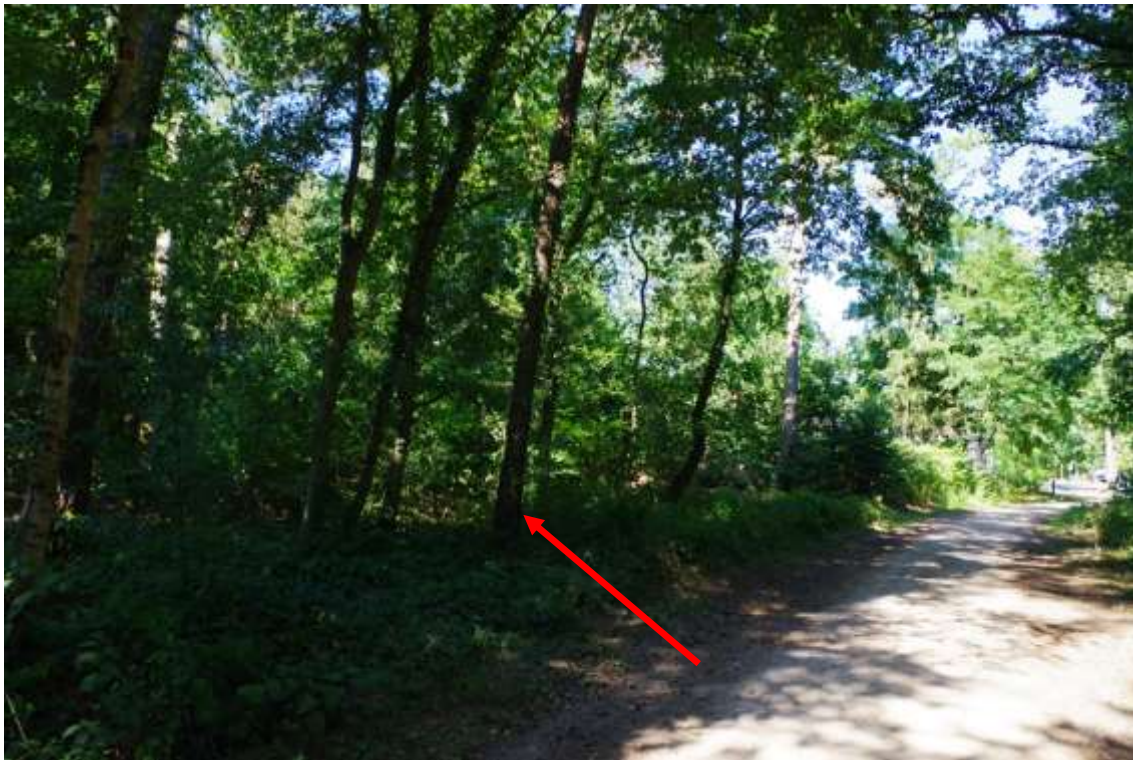
Bild 3: Ansicht des Bewertungsgrundstücks aus Süd, Teilbereich Wald