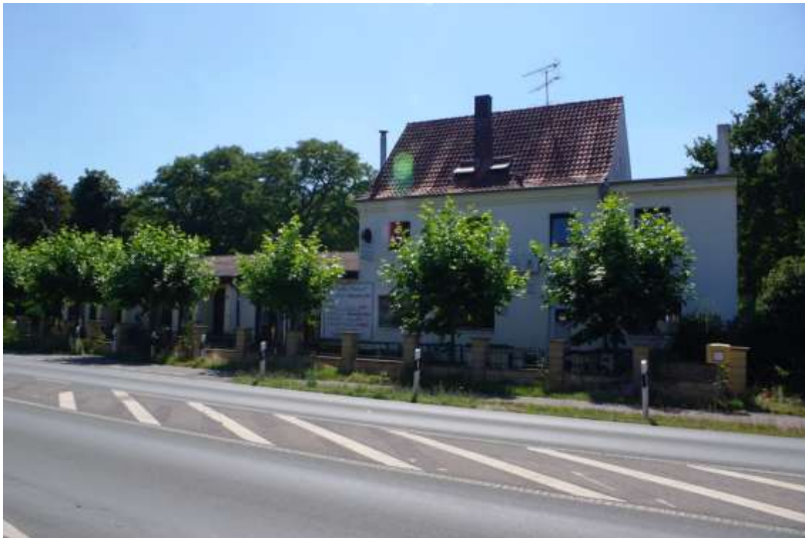
Bild 6: Ansicht der aufstehenden Bebauung (Wohn- und Geschäftshaus) auf dem Nachbargrundstück