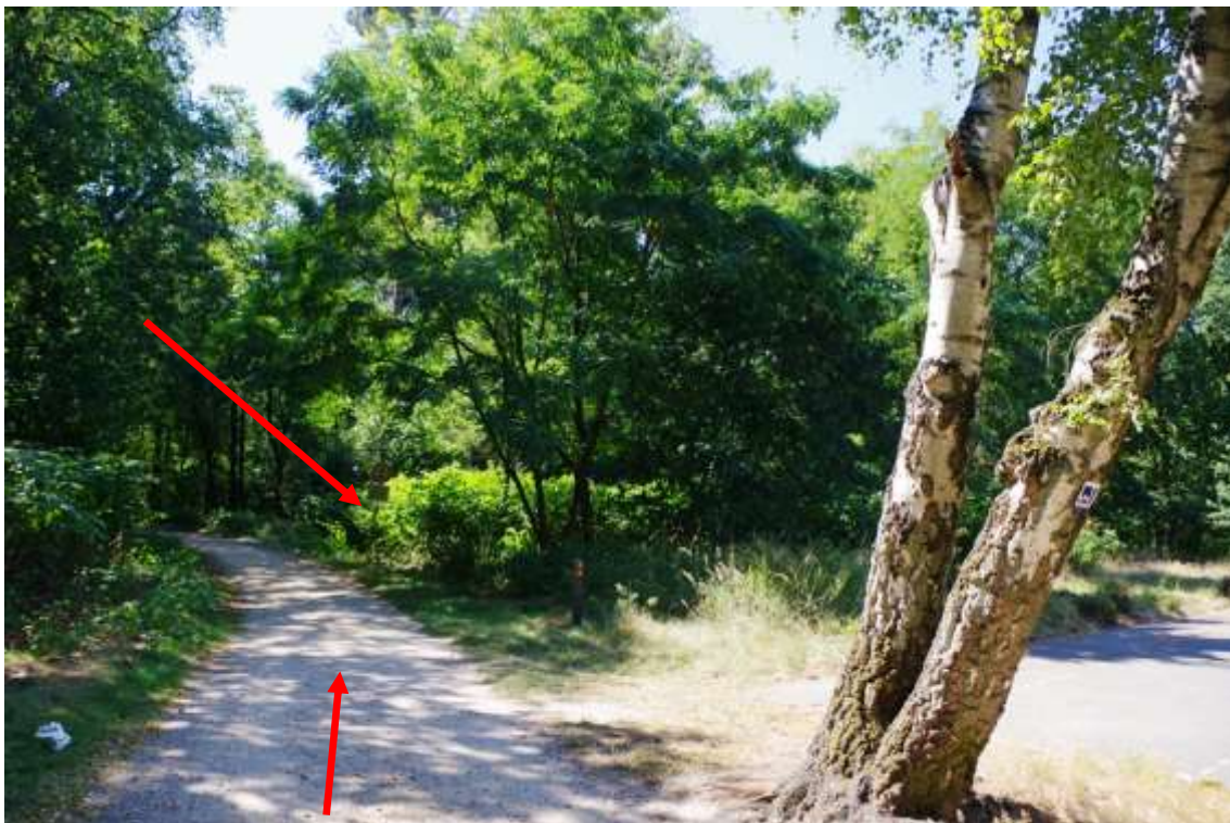
Bild 4: Ansicht des Bewertungsgrundstücks aus Ost, Teilbereich Wald und Wirtschaftsweg