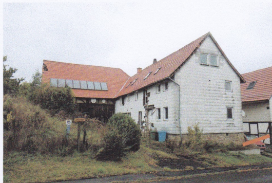
Wohnhaus mit Scheune , straßenseitig