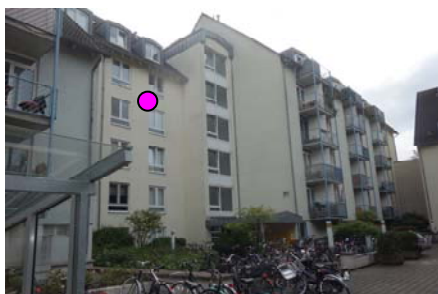
Wohnhaus, innenhofseitig und Lage der WE Nr.122