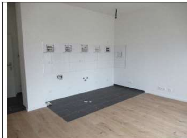
Wohn-/Esszimmer mit Küchenzeile