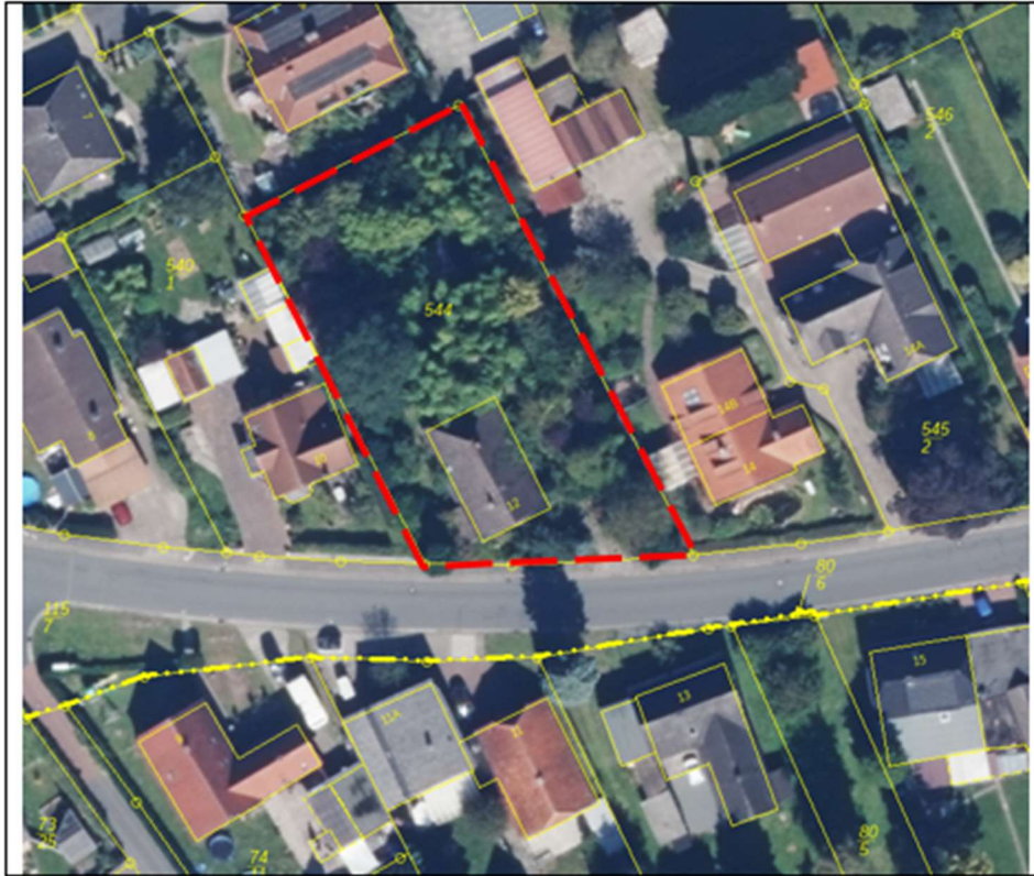
Zetel, Südenburg 12