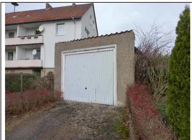
Ansicht von der Straße