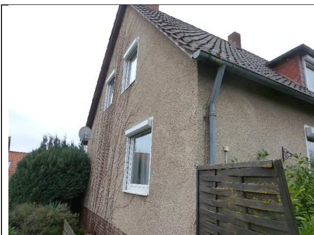
Ansicht von Nordosten