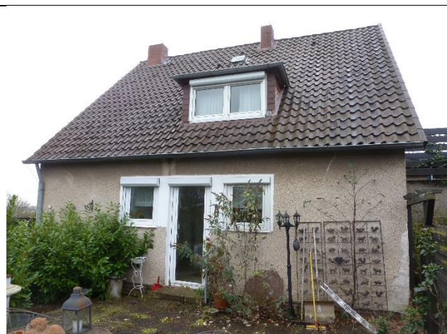
Ansicht vom Garten (Norden)