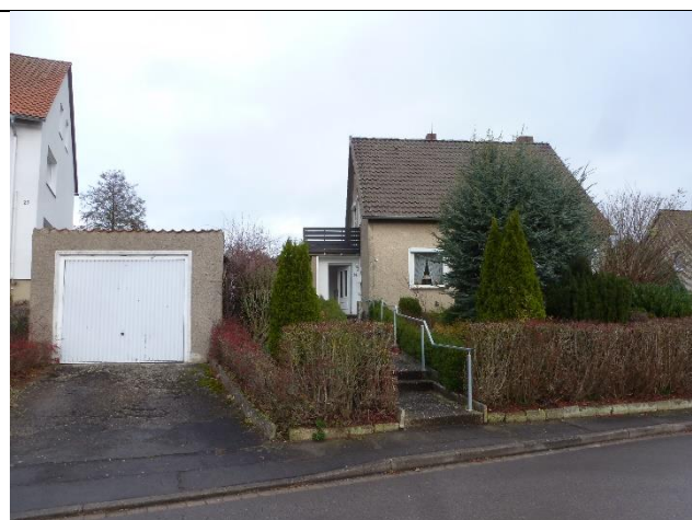
Ansicht von der Straße (Süden)