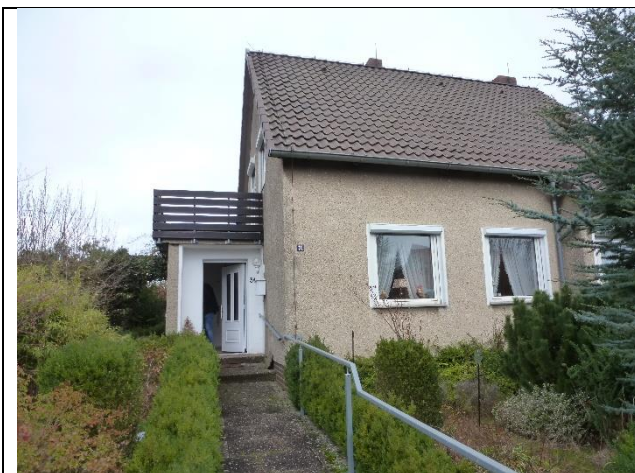
Ansicht von der Straße (Süden)