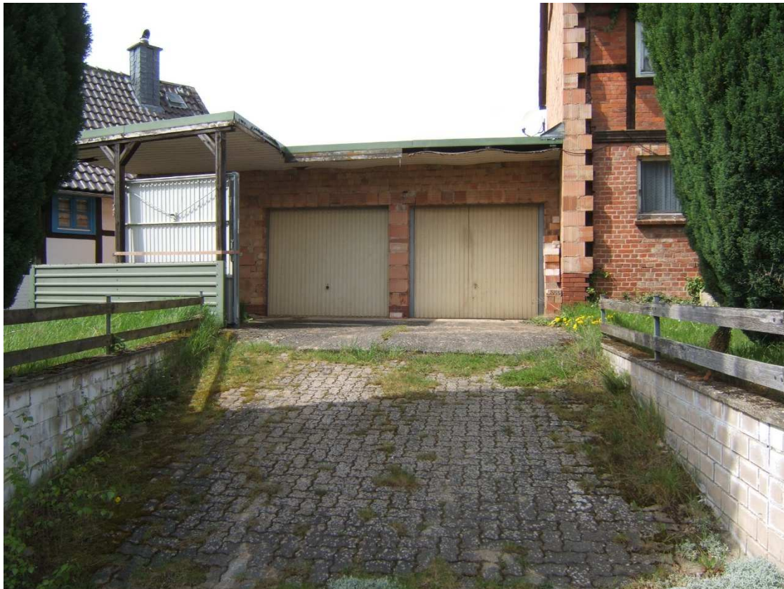
Foto 3 Westansicht von der Straße Schmiedebrink