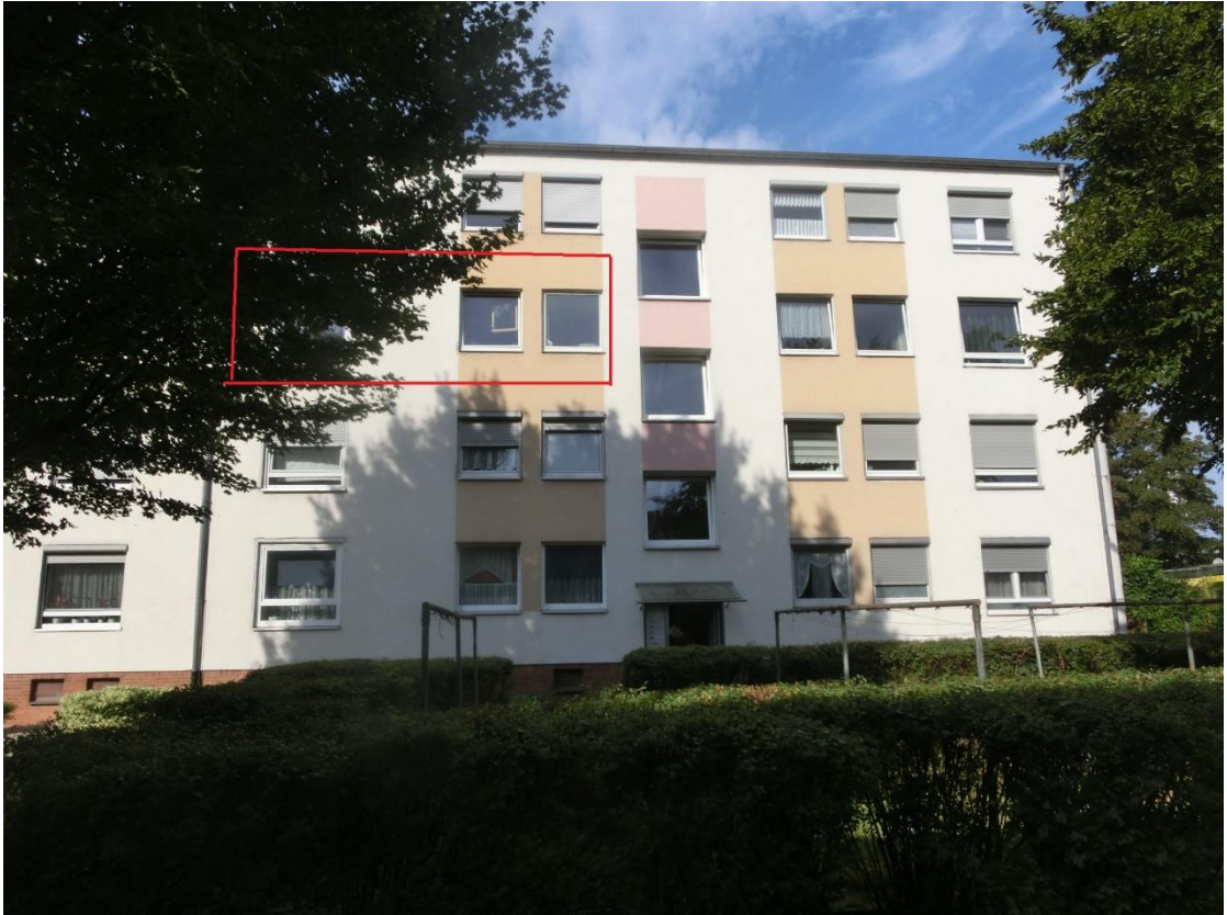
Eigentumswohnung Nr. 31, 2. OG links – Ansicht von Osten