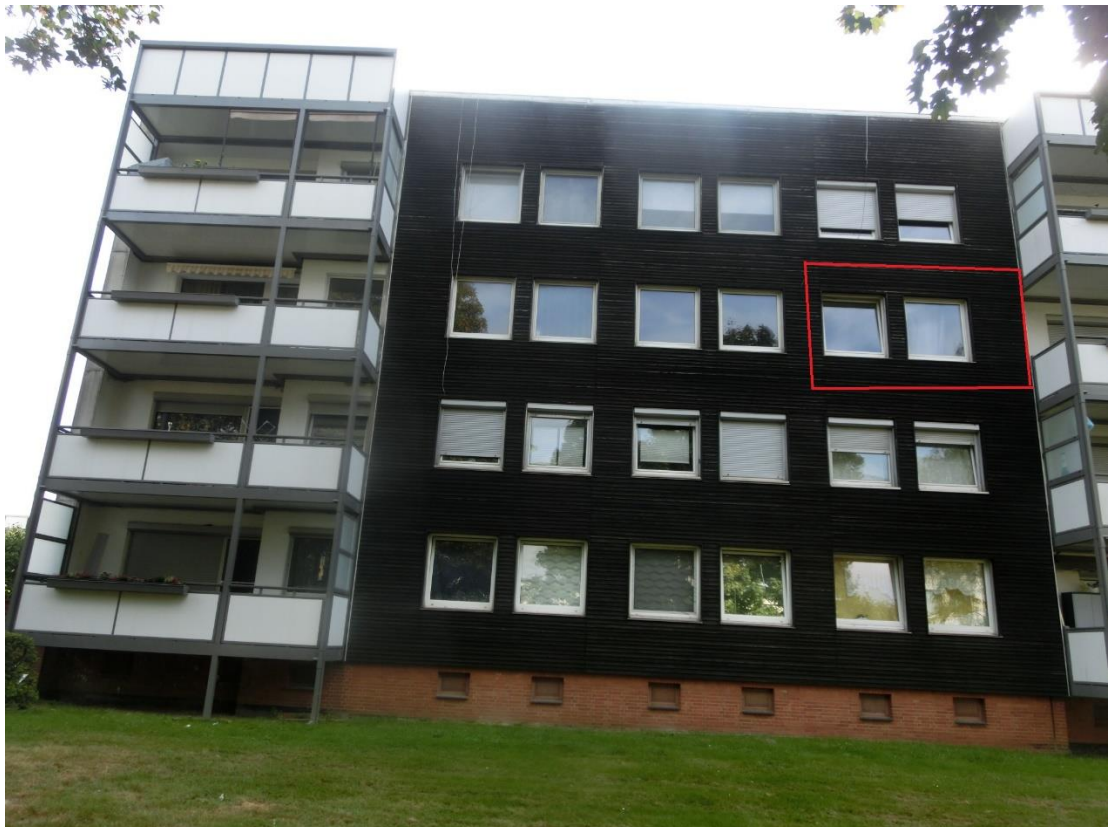
Eigentumswohnung Nr. 31, 2. OG links – Ansicht von Westen