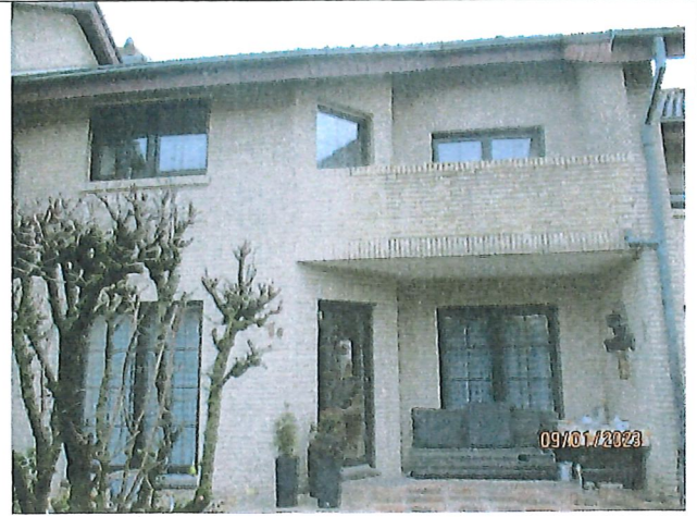
Ansicht vom Garten