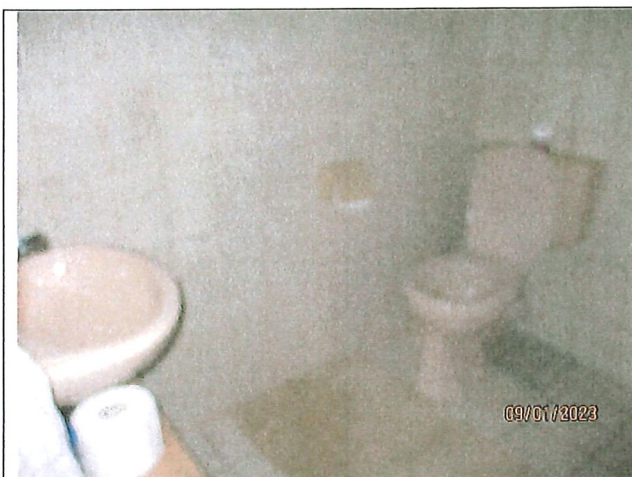
Gäste WC im EG