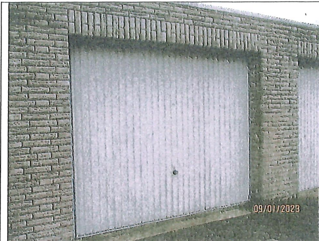
Ansicht von der Straße