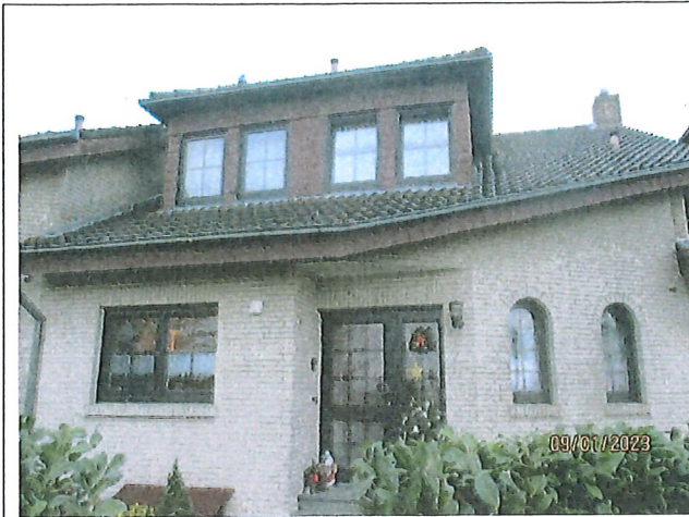
Ansicht von Norden