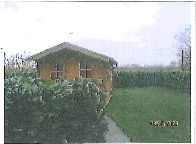
Garten im hinteren Grundstücksbereich