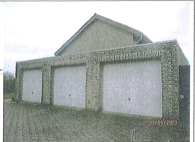
Ansicht vom Hof