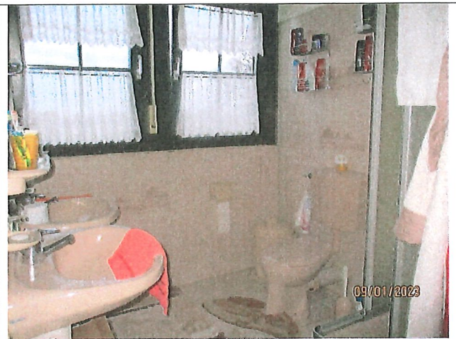
Bad im DG