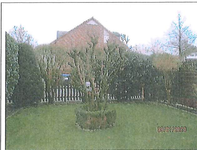
Garten zur Straßenseite