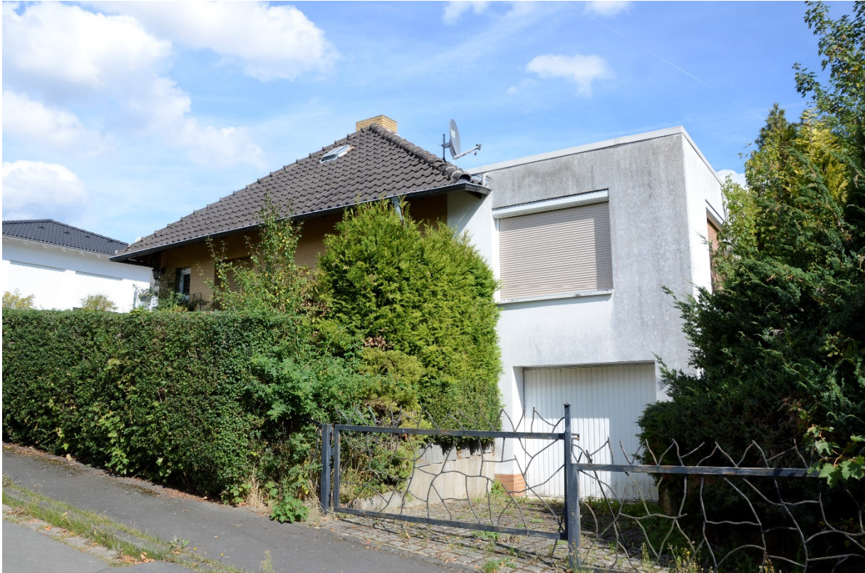
Straßensituation am Bewertungsgrundstück