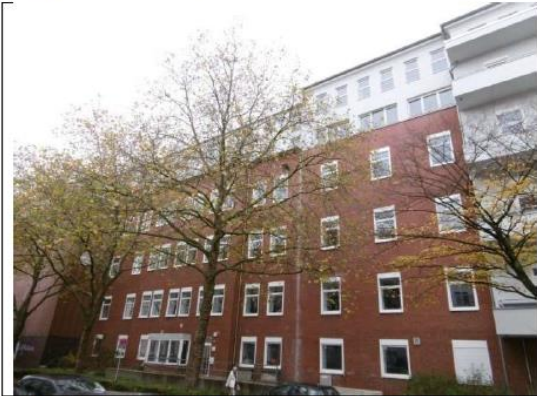
Ansicht von der Weserstraße (westlicher Teil)