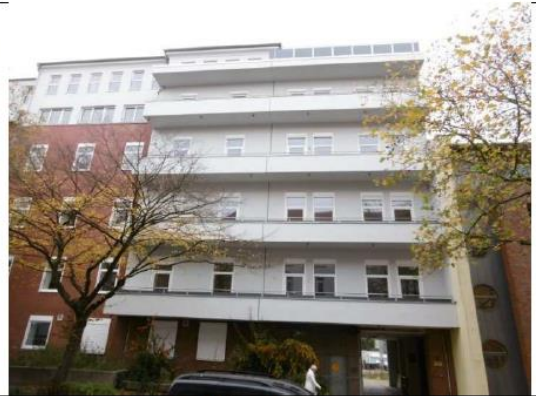
Ansicht von der Weserstraße (östlicher Teil)