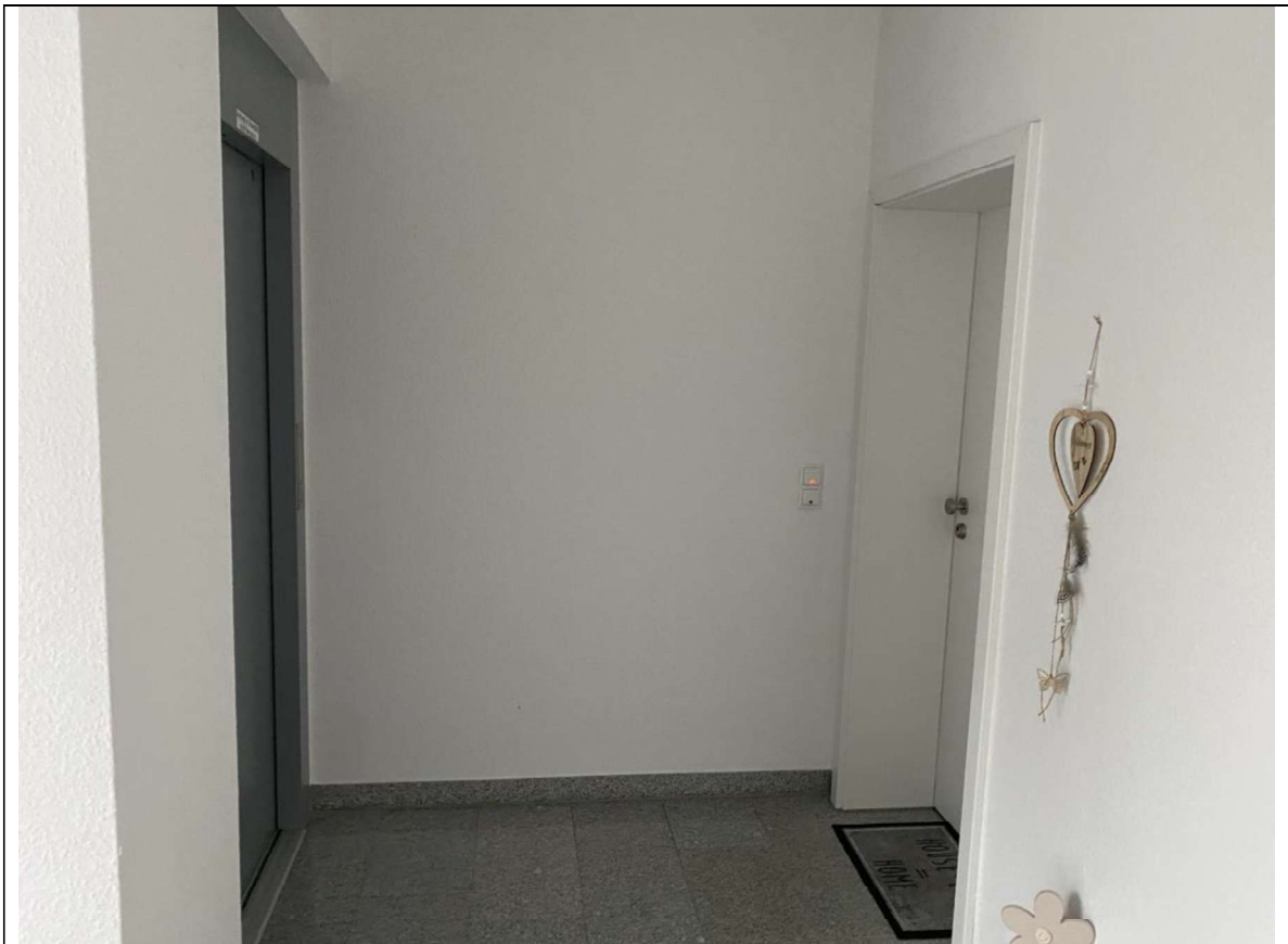
Wohnungseingangstür A 7