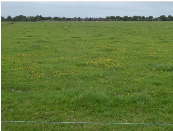
Blick von Westen

Fotos: (aufgenommen bei der Ortsbesichtigung)