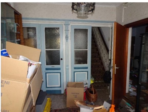
links Whg. EG – rechts Whg. OG