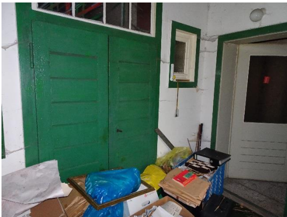
Durchgang Anbau EG