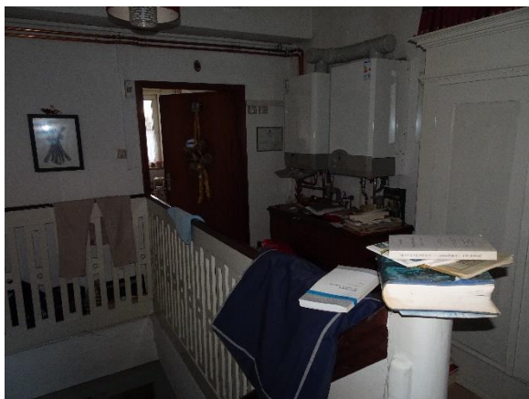
Flur OG – Gasthermen