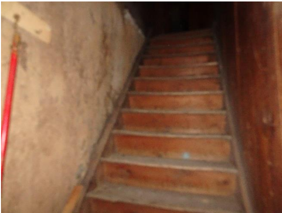
Treppe zum Dachboden