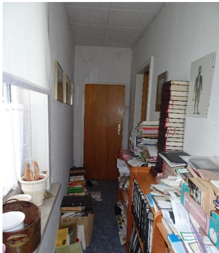
Flur OG Anbau