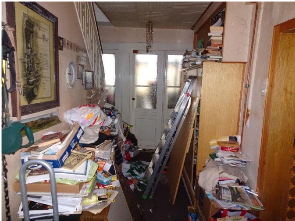
Flur Whg. EG