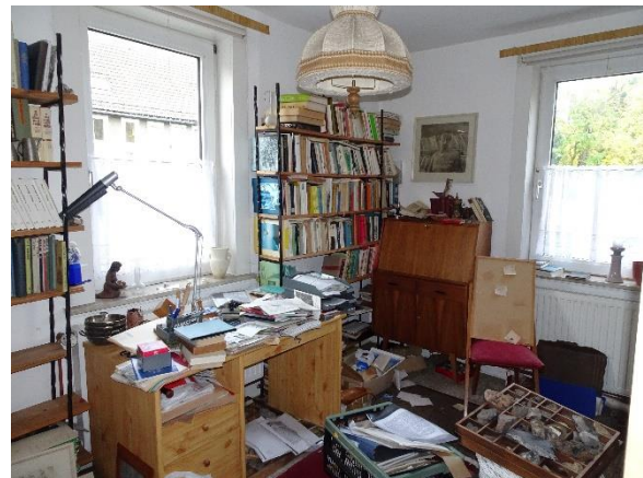
Zimmer OG Anbau