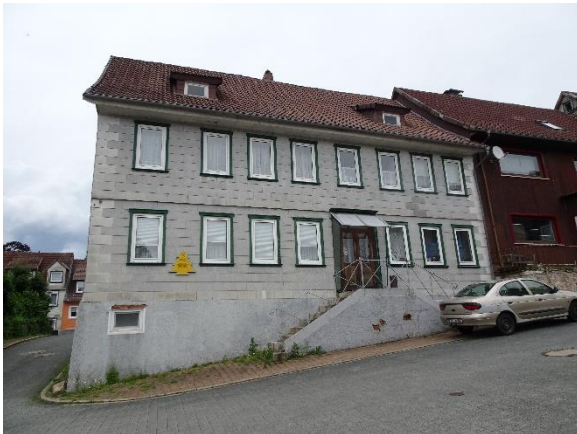
Südseite – Straßenansicht