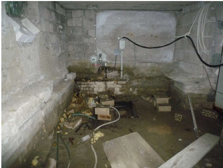
Kellerraum, tlw. Altbestand, tlw. Feuchtigkeitsschäden