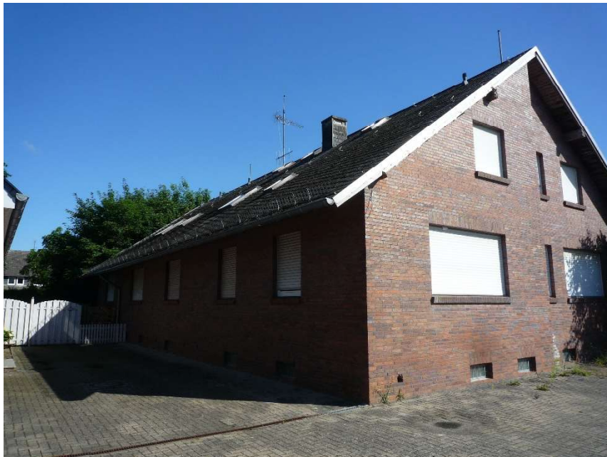
Südansicht, Zaunanlage (offensichtlich vom Nachbarn erstellt)