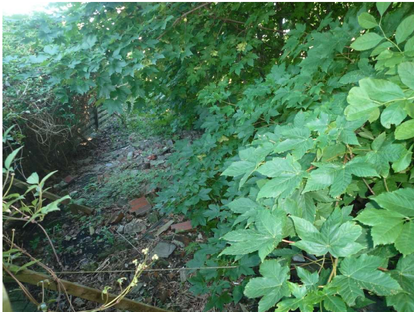
Wildwuchs im hinteren Grundstücksbereich