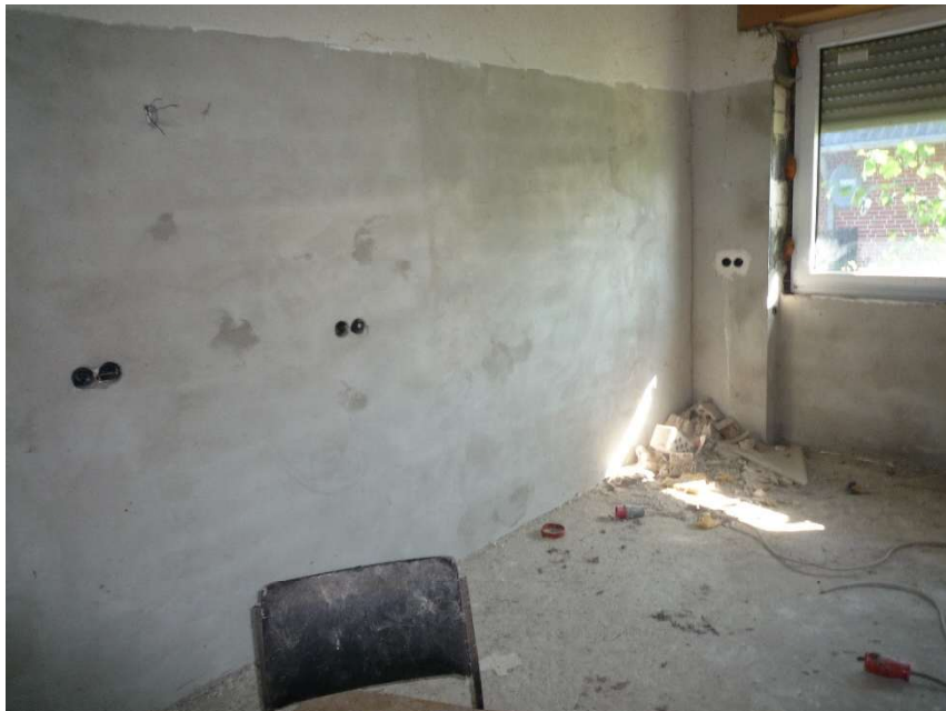
EG-Zimmer mit Rohbauelektrik