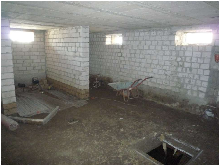
Keller mit Bodenloch im Rohbauzustand