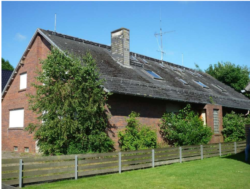
Südostansicht mit Eingangsbereich