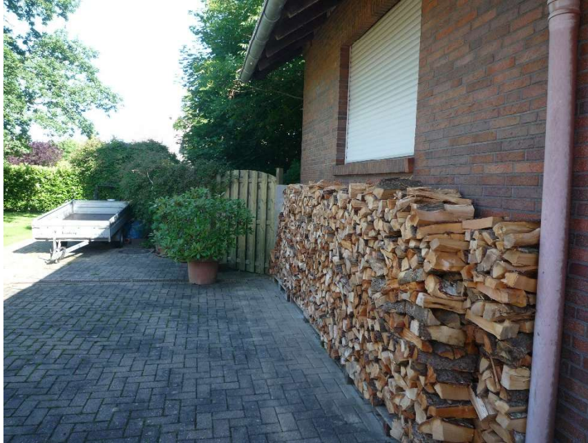
westlicher Grundstücksbereich, offensichtlich vom Nachbarn genutzt