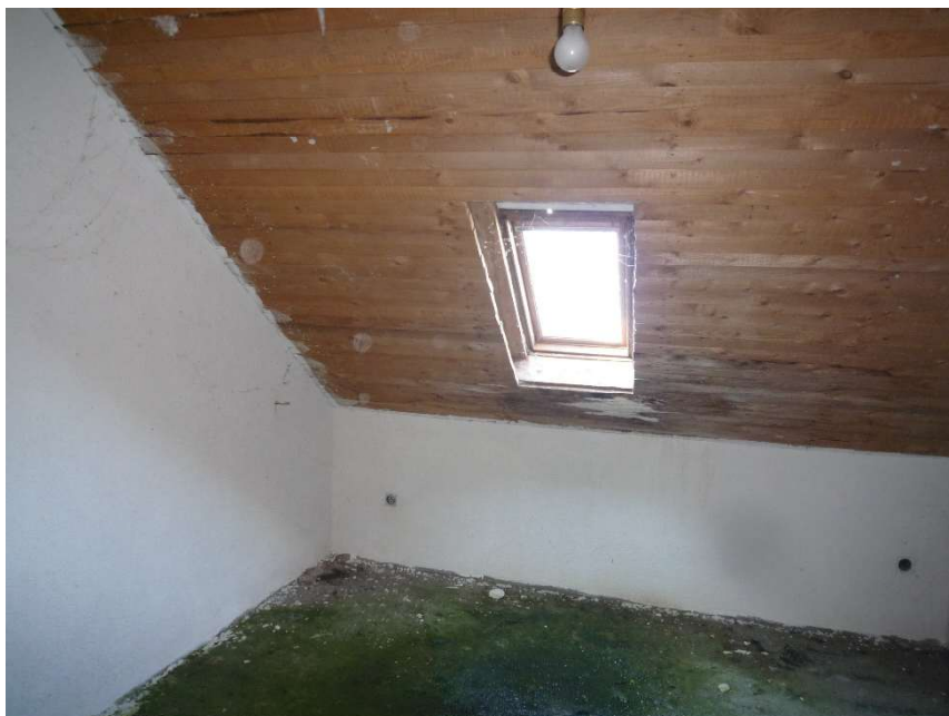
DG-Zimmer im Rohbau