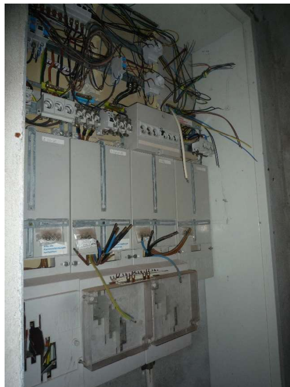
Zählerschrank mit Teilverkabelung