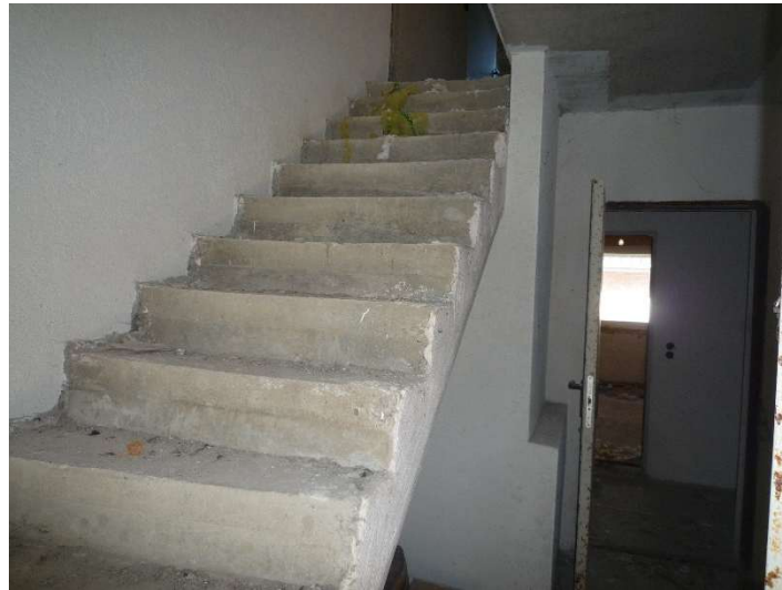
Eingangsbereich mit Stahlbetontreppe im Rohbau