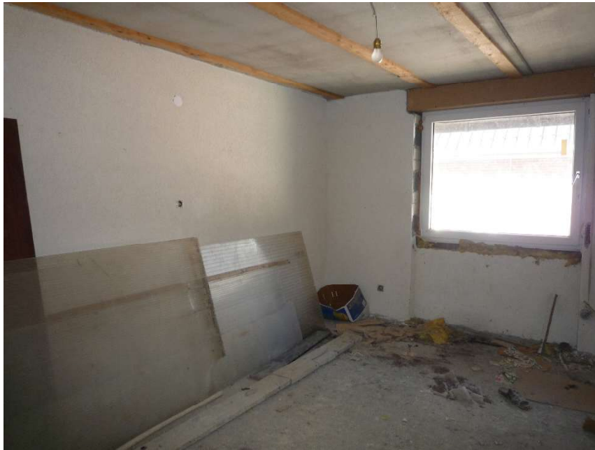
EG-Zimmer im Rohbauzustand