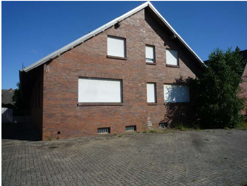
Straßenansicht mit Stellplätzen