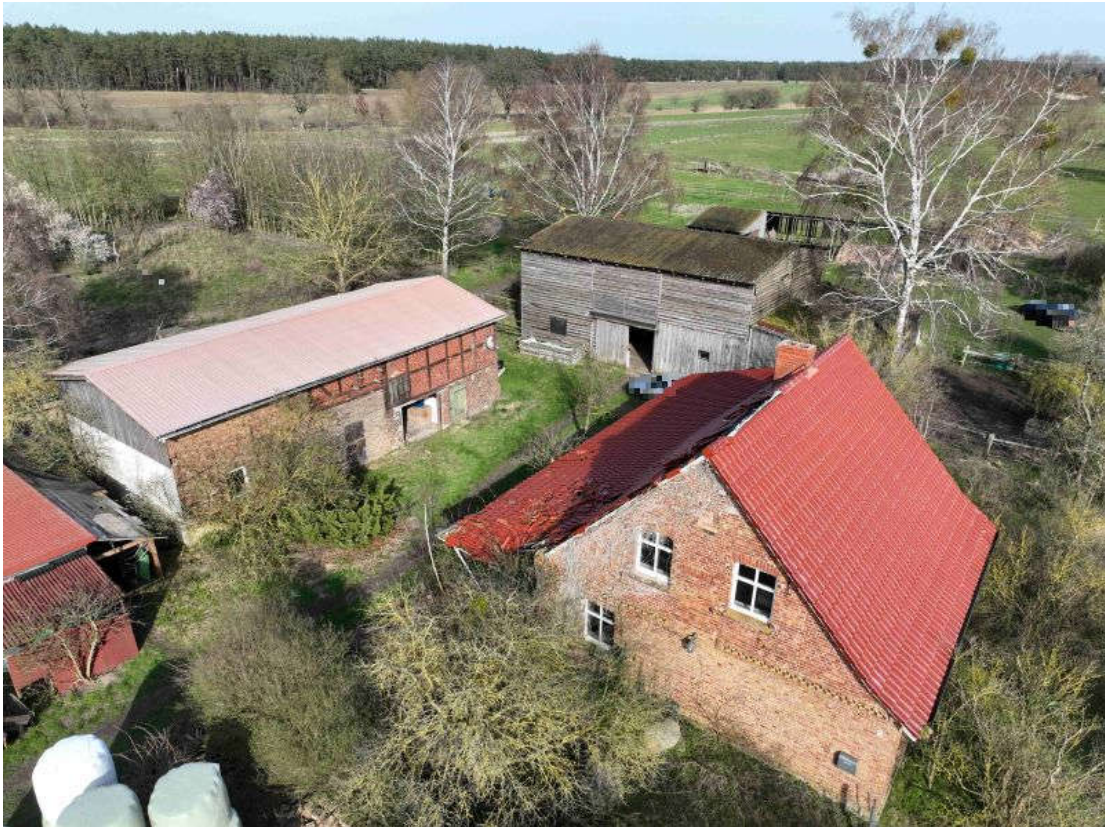
Bild 1: Wohnhaus mit Nebengebäuden – Straßenansicht von Südwesten