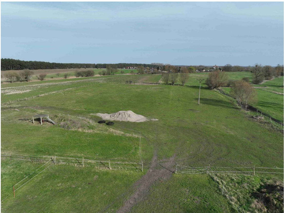
Bild 4: unbebauter Grundstücksteil - Grünland – Ansicht von Westen