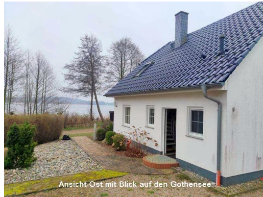
Ansicht Ost mit Blick auf den Gothensee