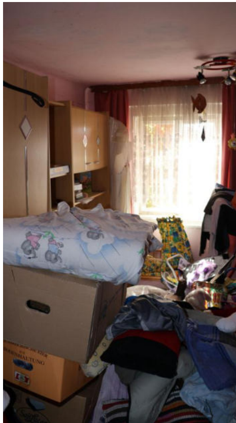
Bild 22 DG Zimmer