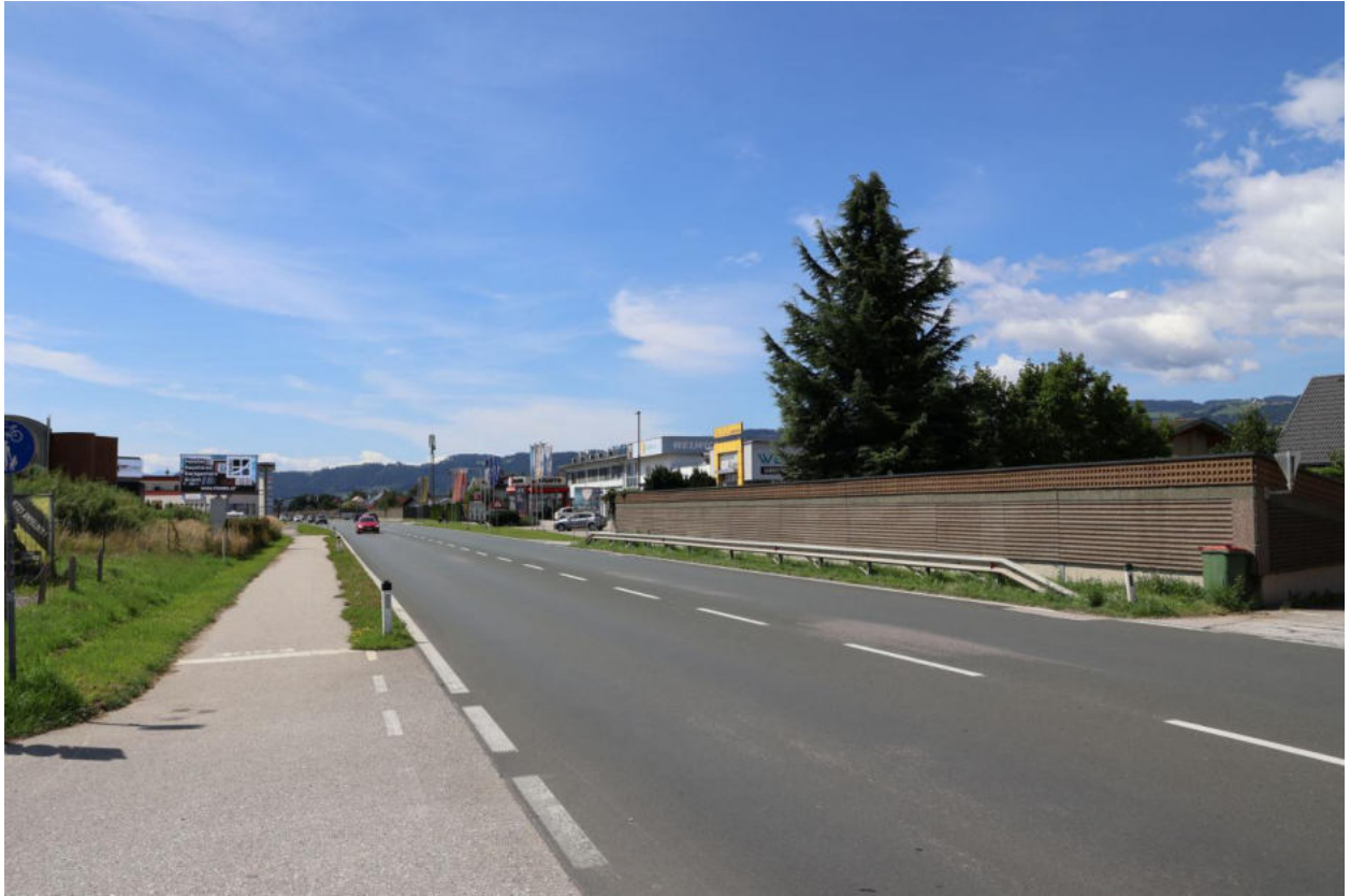
Bild 35 Klagenfurter Straße Blickrichtung Süden