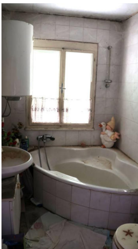
Bild 12 EG-Badezimmer mit Fenster Richtung Süd