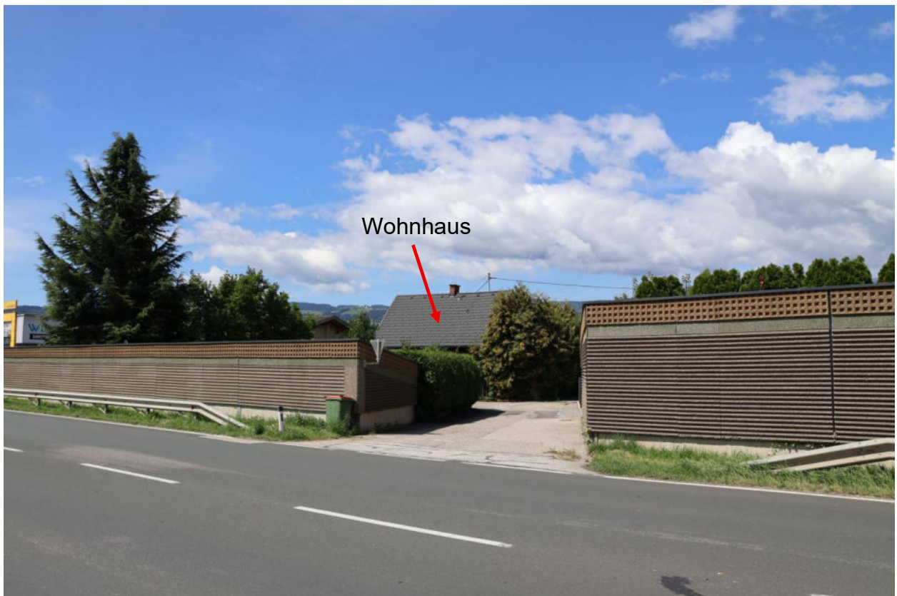
Bild 4 Grundstückszufahrt zur Packer Bundesstraße von der Ostseite