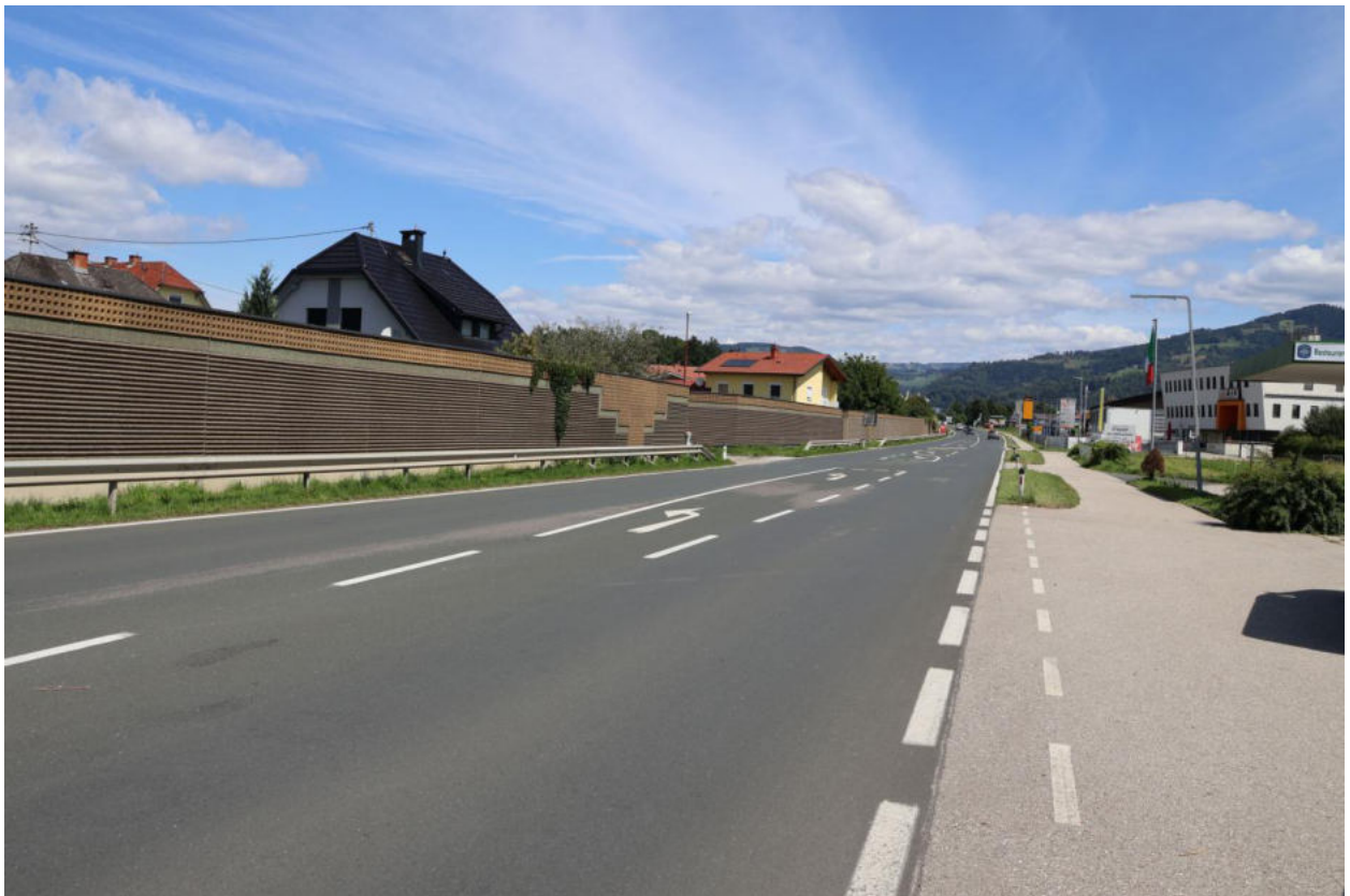
Bild 36 Klagenfurter Straße Blickrichtung Norden nach Wolfsberg