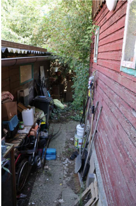
Bild 29 Nebengebäude mit Zugang von der Ostseite