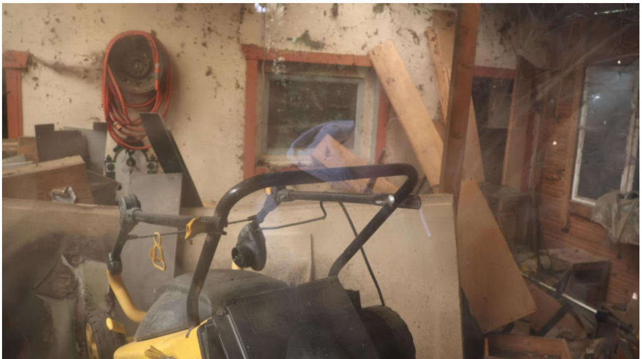
Bild 30 Versperrtes Nebengebäude Innenansicht