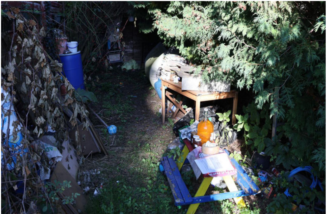
Bild 32 Sperrmüllablagerungen im Außenbereich