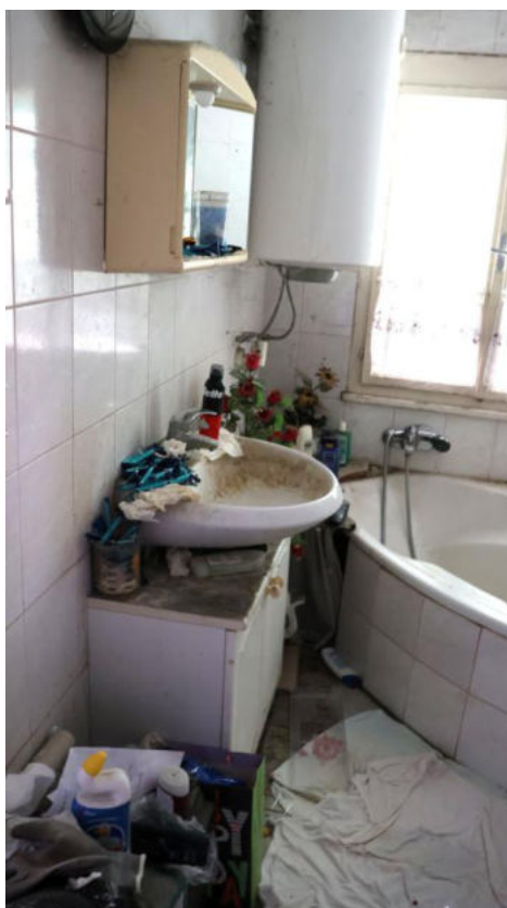
Bild 13 EG Badezimmer