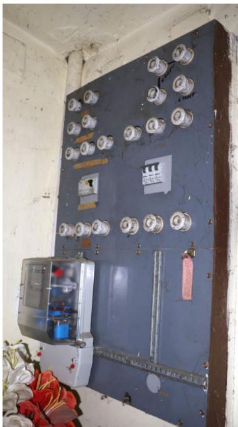
Bild 11 E-Verteileranlage mit Schraubversicherungen