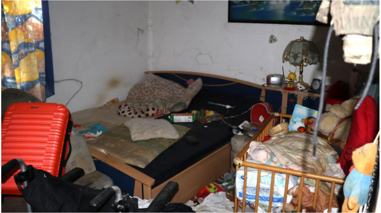
Bild 17 EG Zimmer