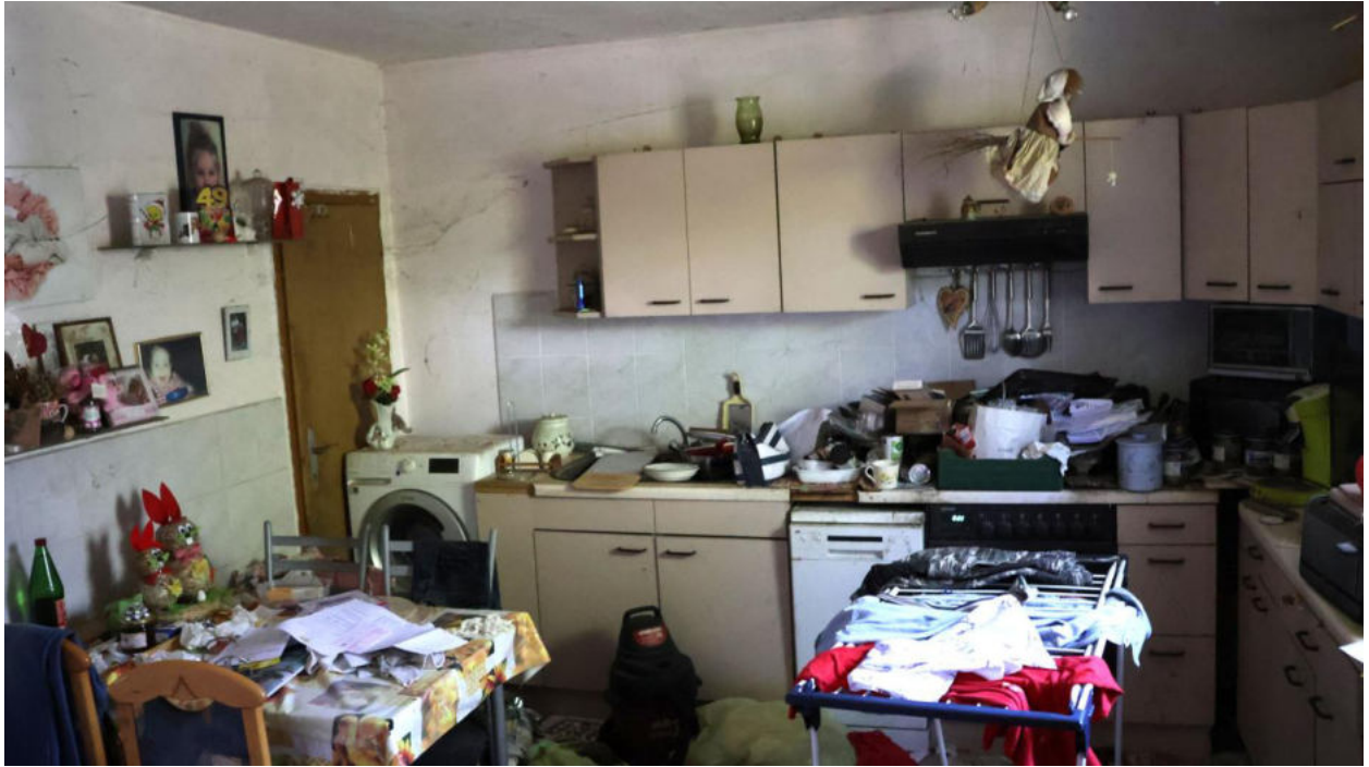
Bild 15 EG Küche mit Speiszugang