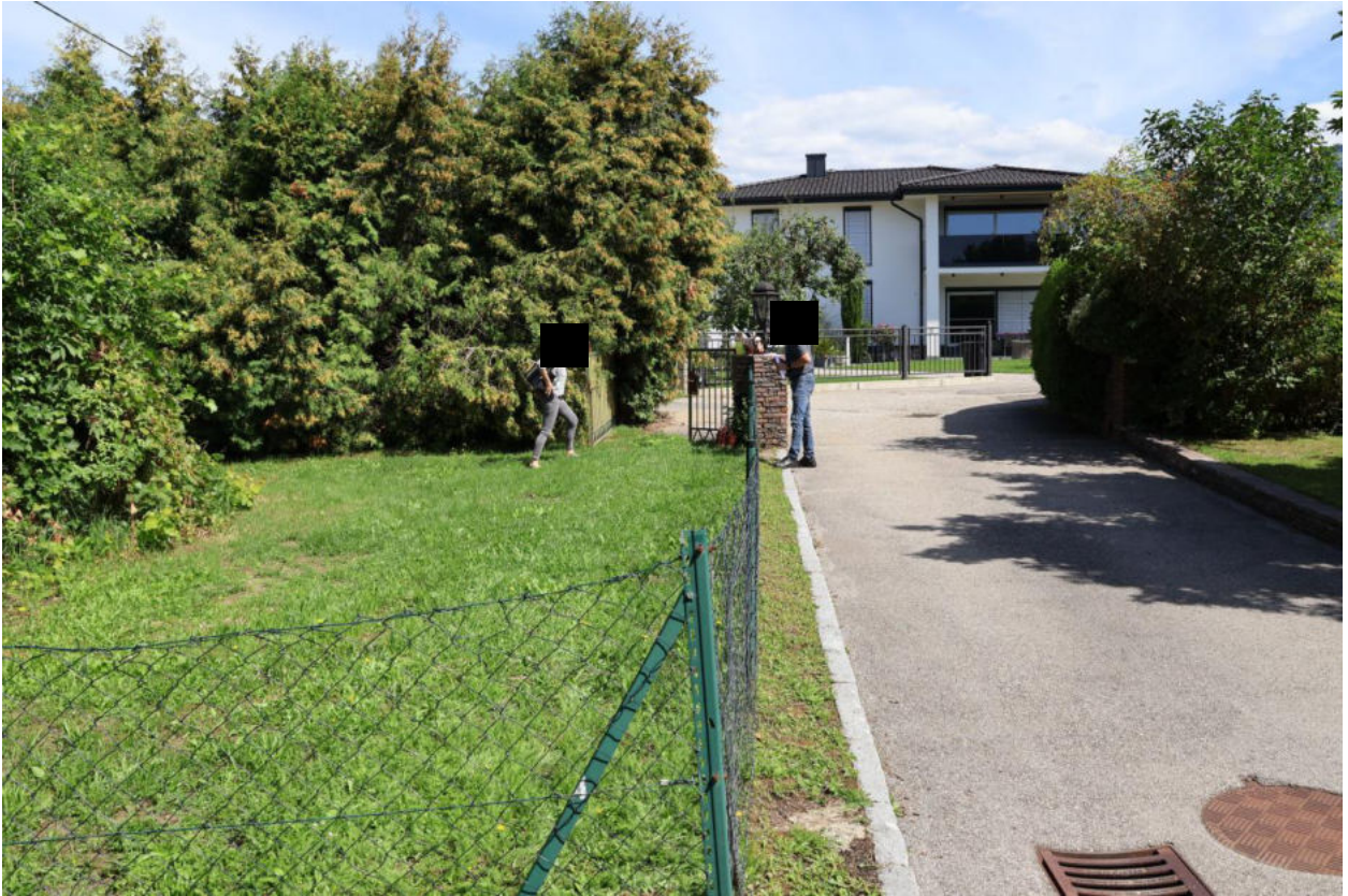
Bild 5 Grundstücksgrenze Ostseite Blickrichtung Norden