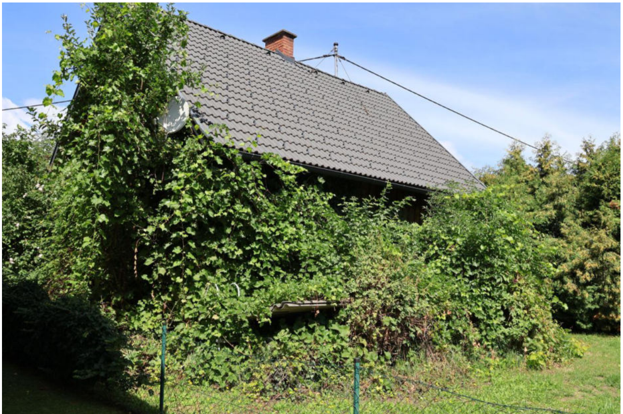
Bild 2 Gebäudeansicht Südostseite