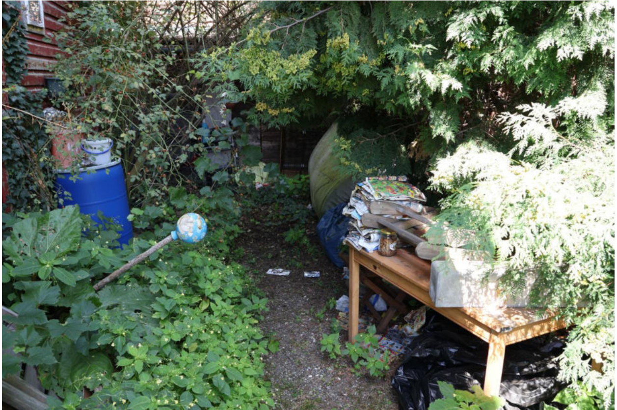
Bild 33 Sperrmüllablagern im Außenbereich