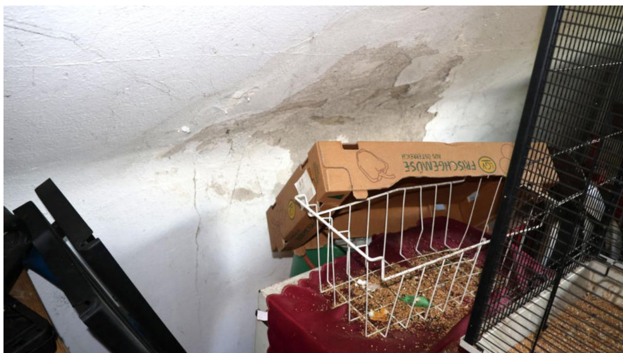
Bild 26 DG Mansardenausbildung mit Drepelwand