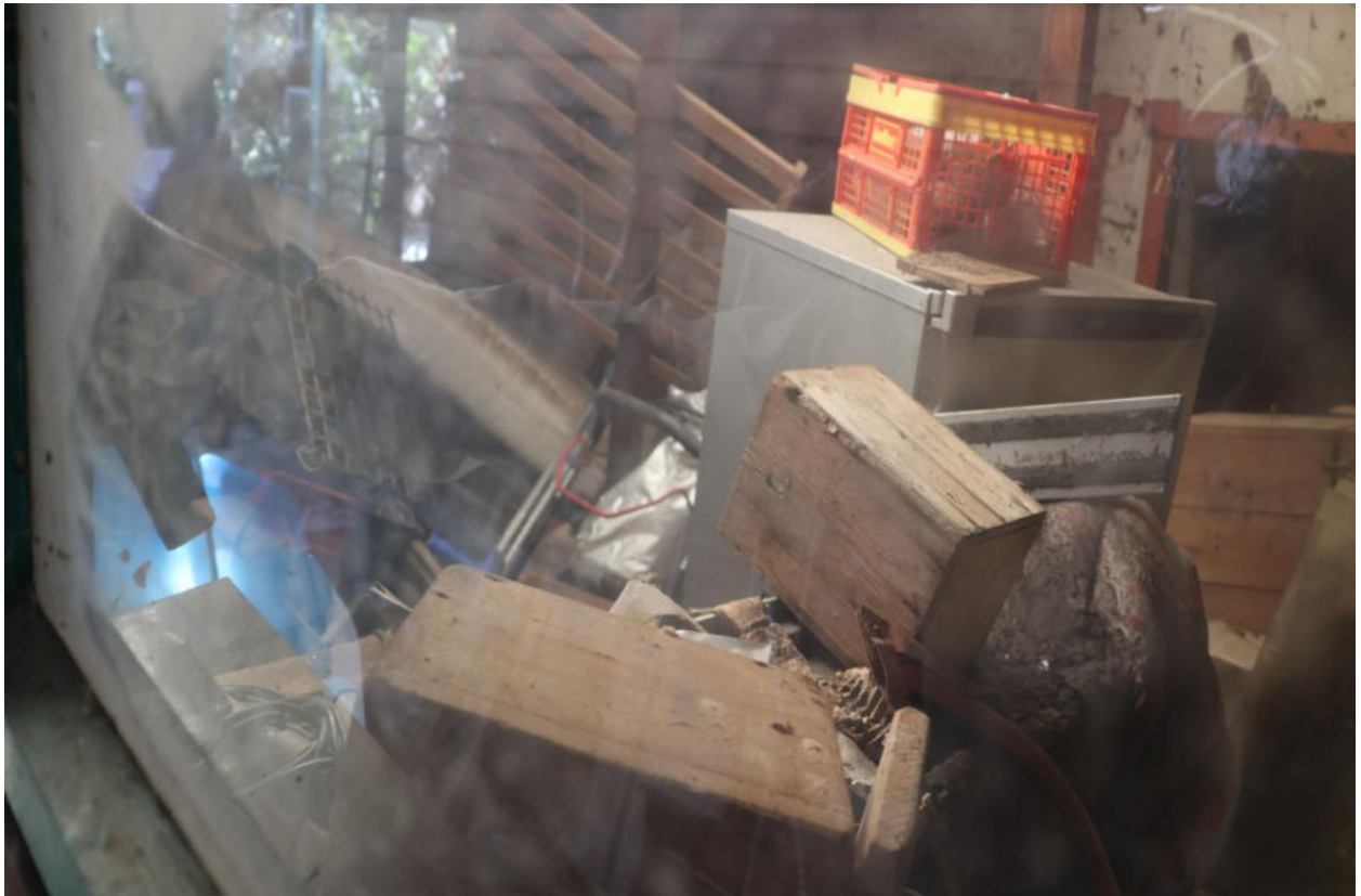
Bild 31 Versperrtes Nebengebäude Innenansicht über Außenfenster