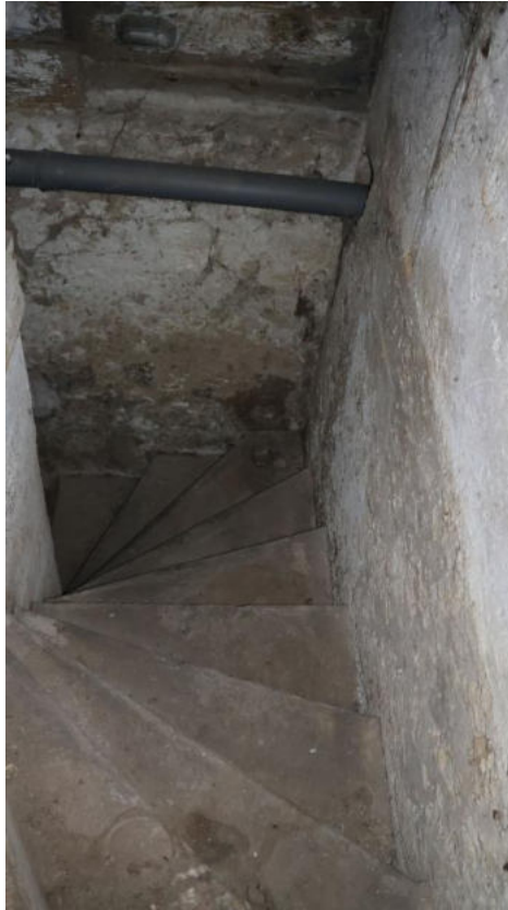
Bild 19 Stiegenabgang in den Keller