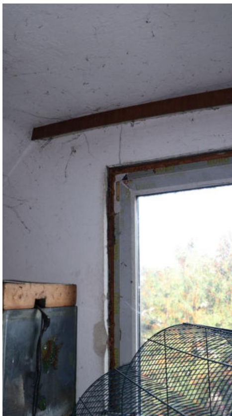
Bild 25 DG Giebelwandfenster mit Mansardenausbildung an der Nordwestseite