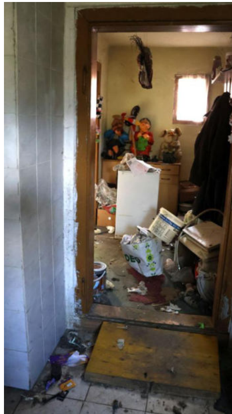
Bild 16 EG Vorraum mit Zugang zur Küche