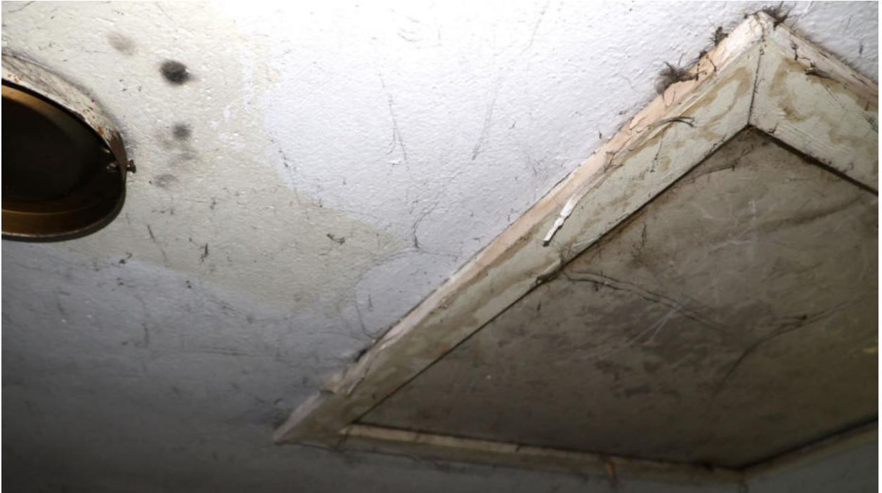
Bild 27 DG Einstiegs Luke in den Spitzboden