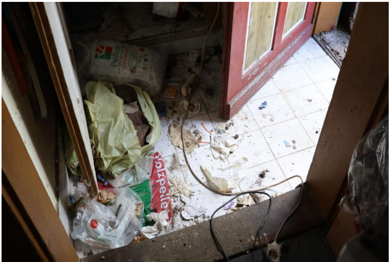
Bild 10 Hauseingangstüre mit EG-Vorraum