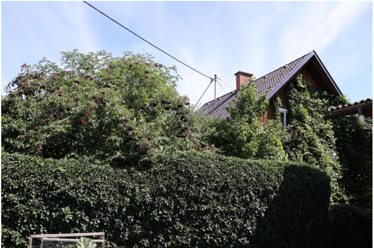
Bild 3 Gebäudeansicht Südwestseite