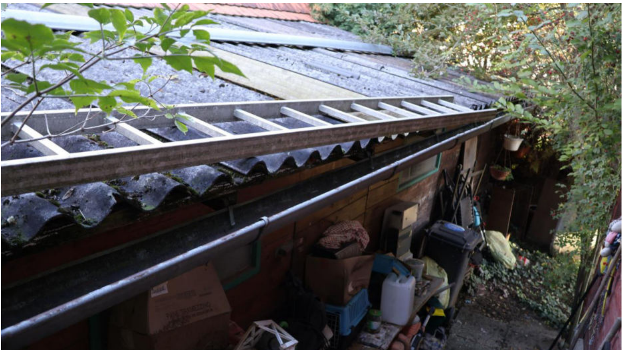
Bild 28 Nebengebäude Ostseite mit Anbauteil