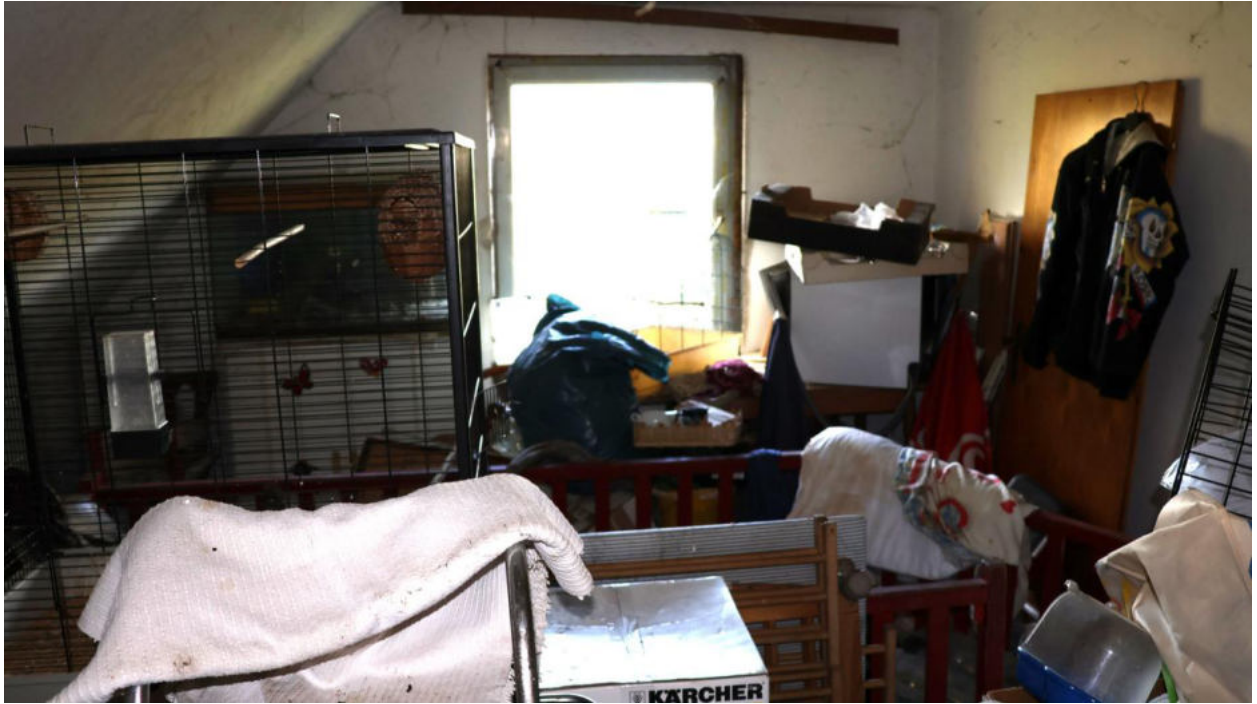
Bild 21 DG Vorraum mit Fenster Richtung Norden