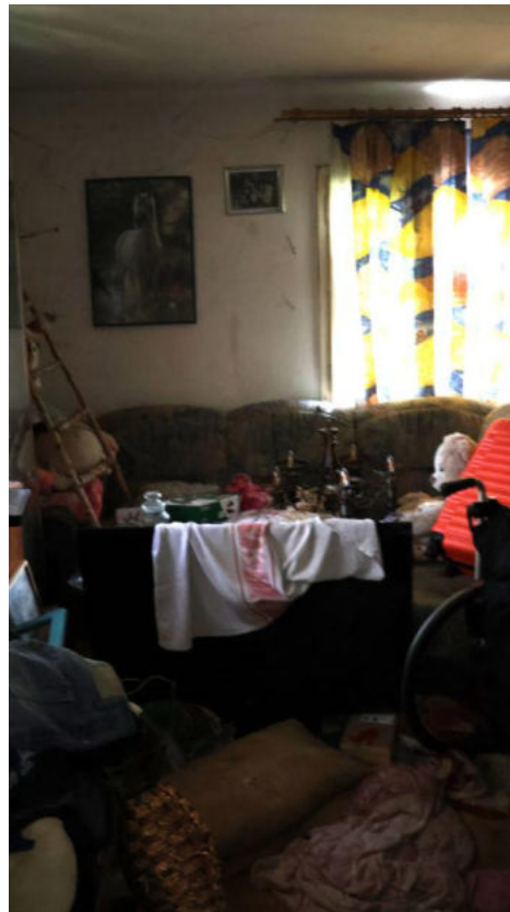
Bild 18 EG Zimmer