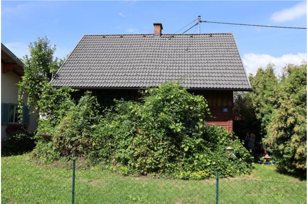
Bild 1 Gebäudeansicht Ostseite