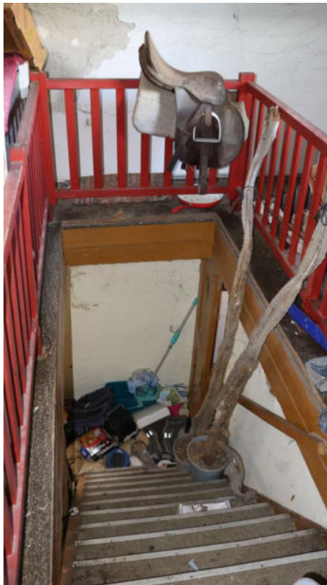
Bild 20 Stiegenaufgang ins DG mit Holzterppe