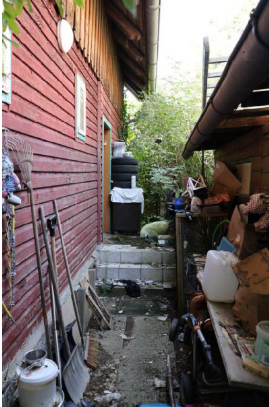
Bild 7 Hauszugang an der Westseite mit angrenzendem Nebengebäude