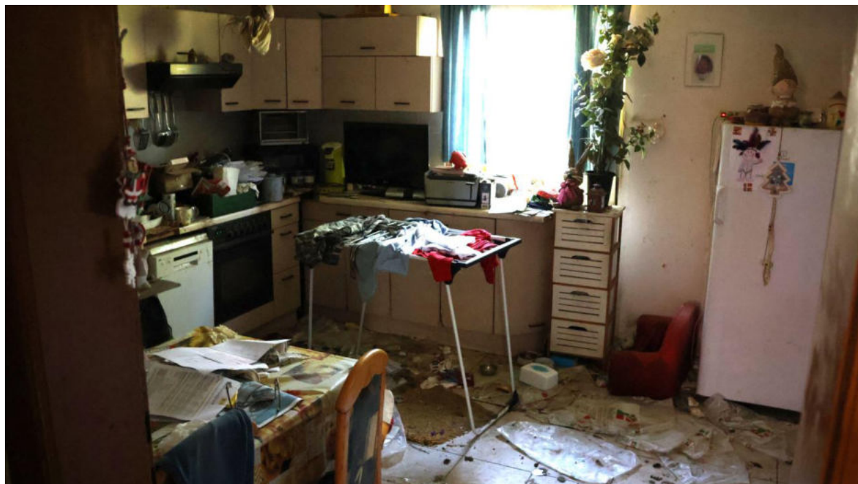
Bild 14 EG Küche mit Fenster Richtung Ost