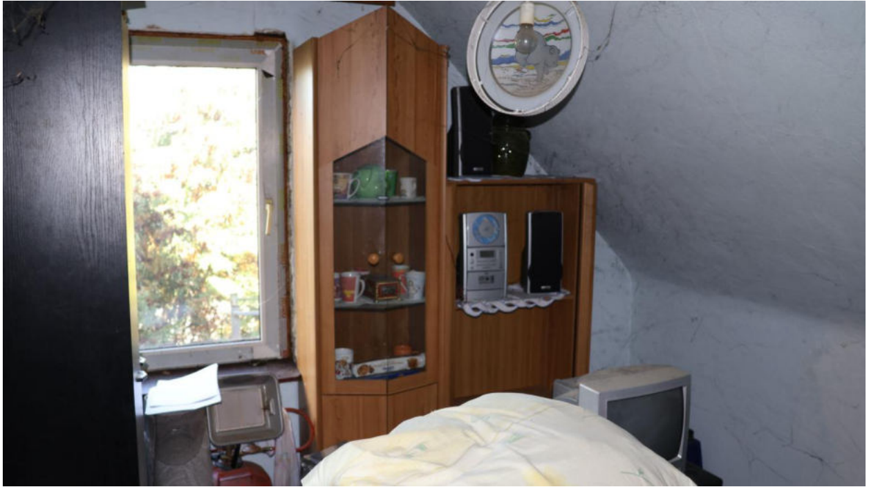
Bild 23 DG Zimmer