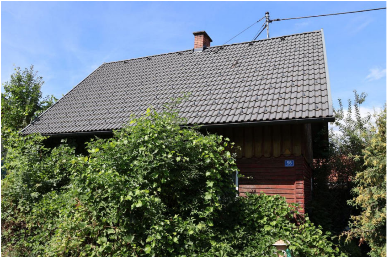
Bild 9 Gebäudeansicht mit östlicher Dachfläche und Dachständer von der Stromfreileitung