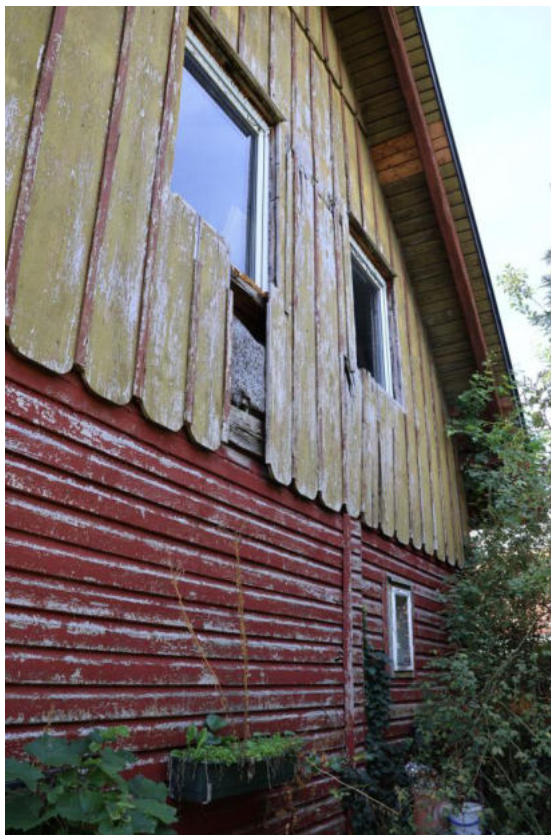
Bild 8 Nördliche Giebelwand mit Fassadenschäden an der Holzverschalung