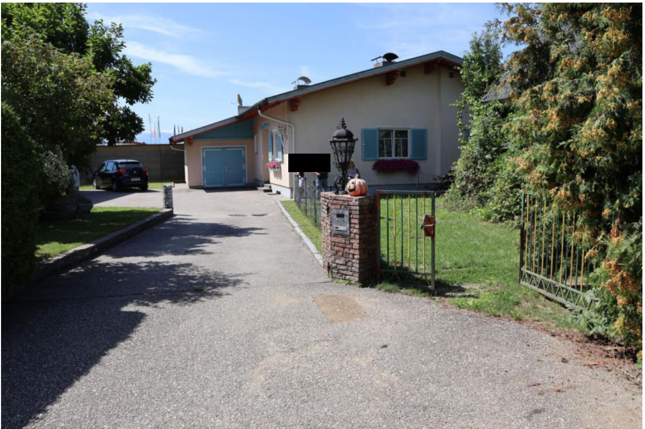
Bild 6 Grundstückseinfahrt mit Gartentor vom öffentlichen Weg 536/12