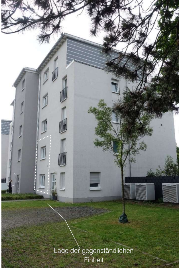
Nord- und Westfassade

Das Wertgutachten kann beim Amtsgericht Frankfurt am Main eingesehen werden. Die obige Kurzdarstellung ersetzt nicht die Einsicht in das Wertgutachten. Rückfragen sind ausschließlich an das Amtsgericht zu stellen. Es wird ausdrücklich darauf hingewiesen, dass hinsichtlich der Angaben keine Gewähr für Richtigkeit und Vollständigkeit übernommen wird.