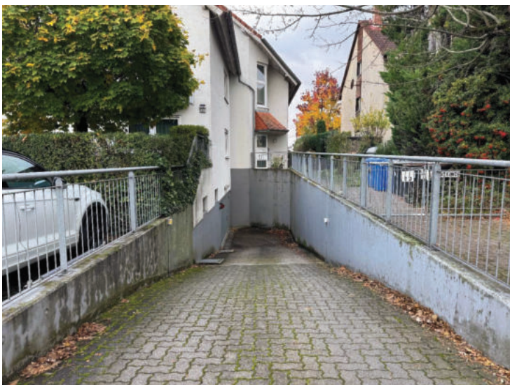
Nordring Zufahrt Tiefgarage