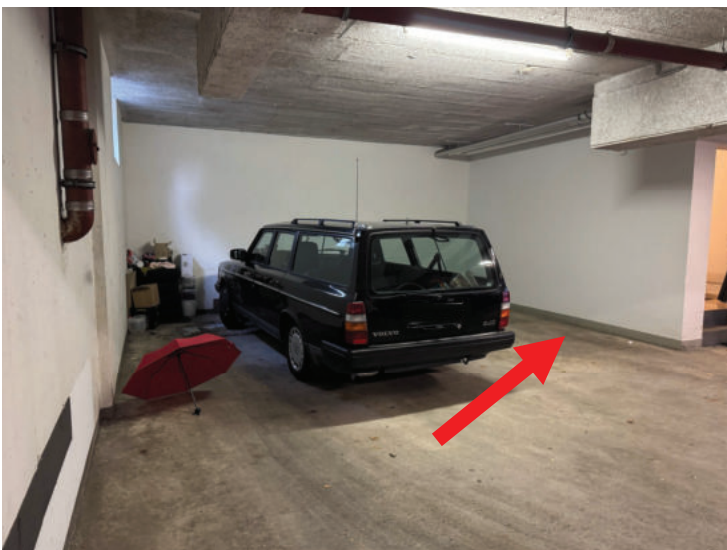
Tiefgarage Stellplatz Nr. P 12