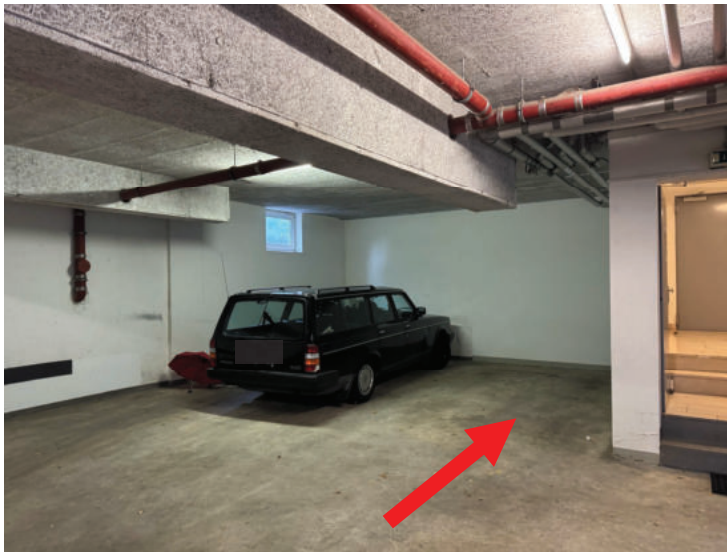
Tiefgarage Stellplatz Nr. P 12