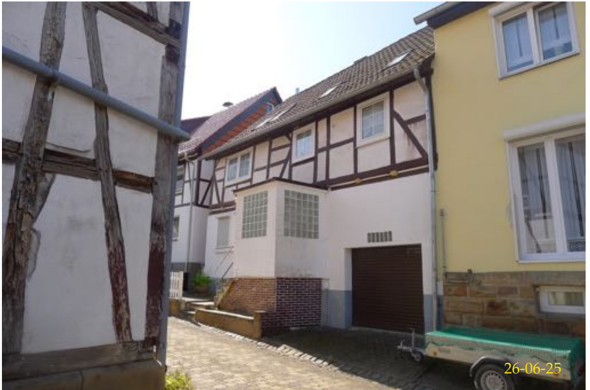
Straßenansicht von Nord-Westen