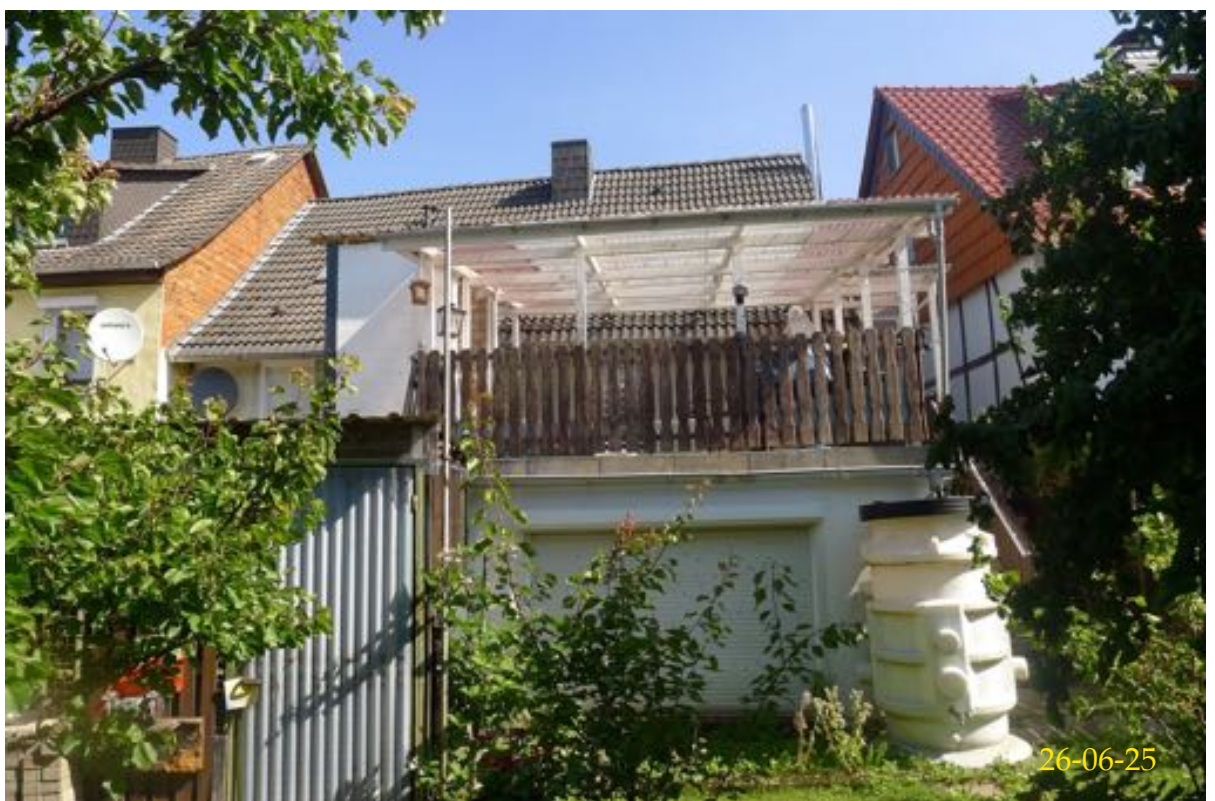
Gartenansicht von Süden