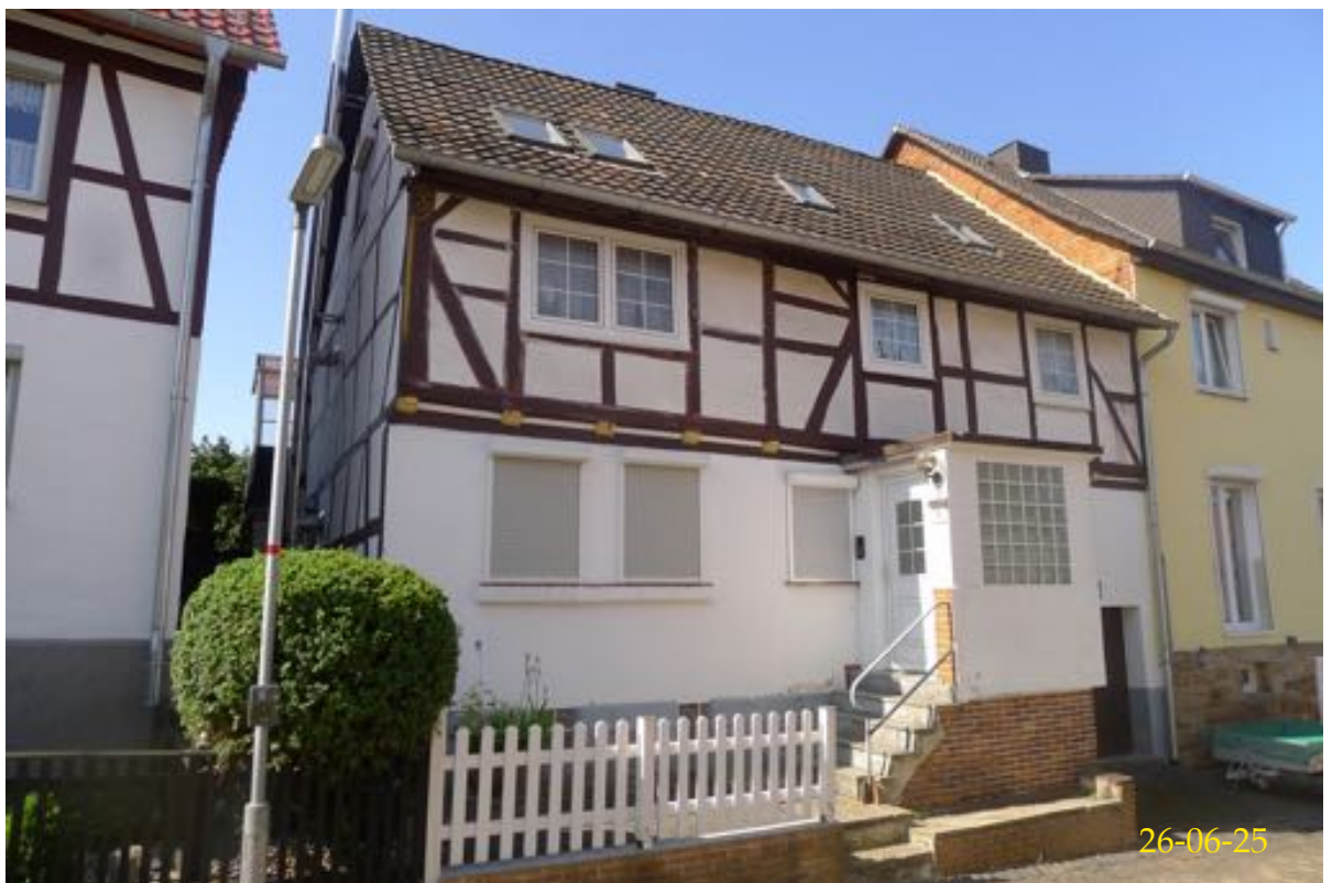
Straßenansicht von Nord-Osten