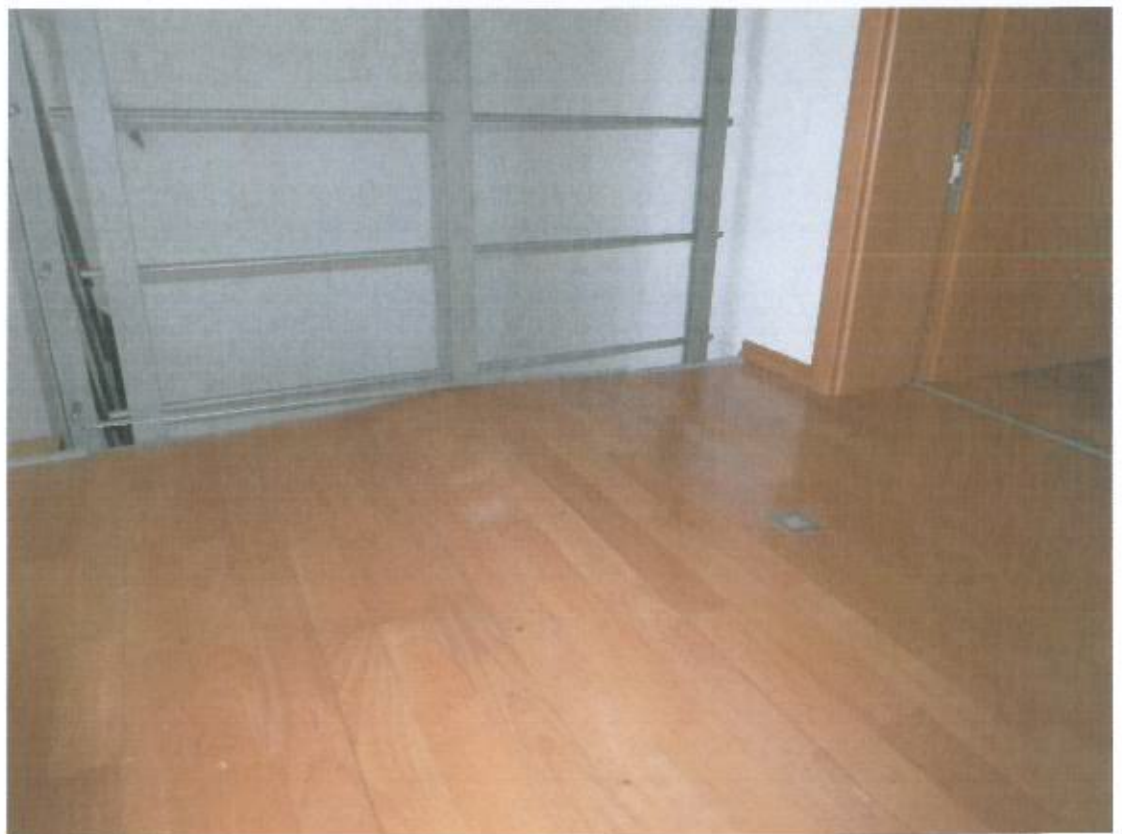
Bild 18, Platz Clouange 4 B, Obergeschoss: Flur, Aufwölbungen im Bodenbelag