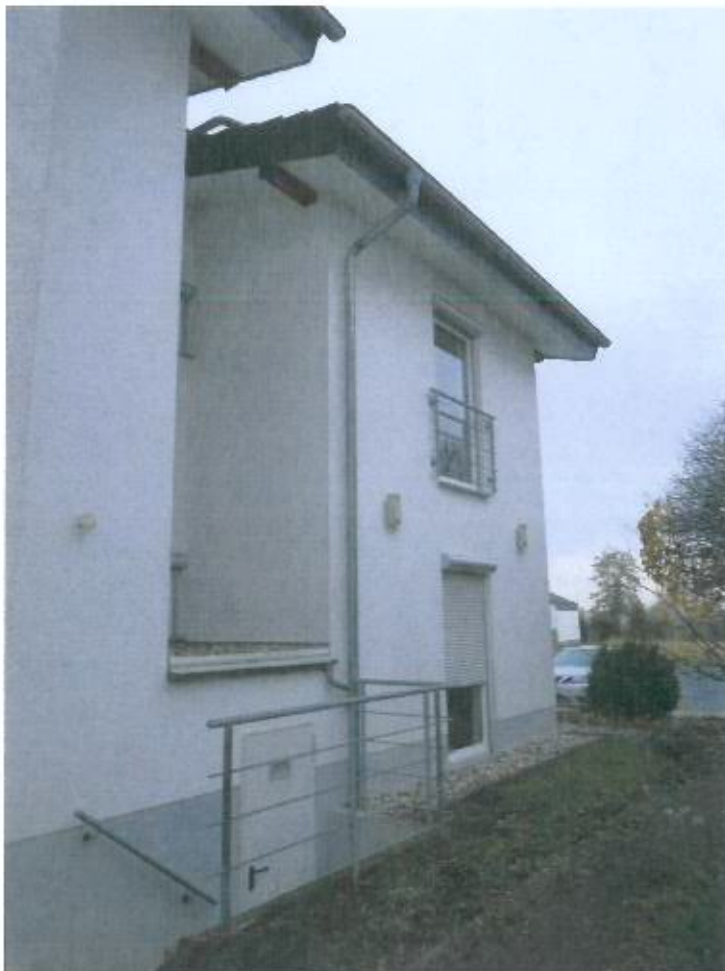
Bild 4, Platz Clouange 4 A, Ansicht von Südosten