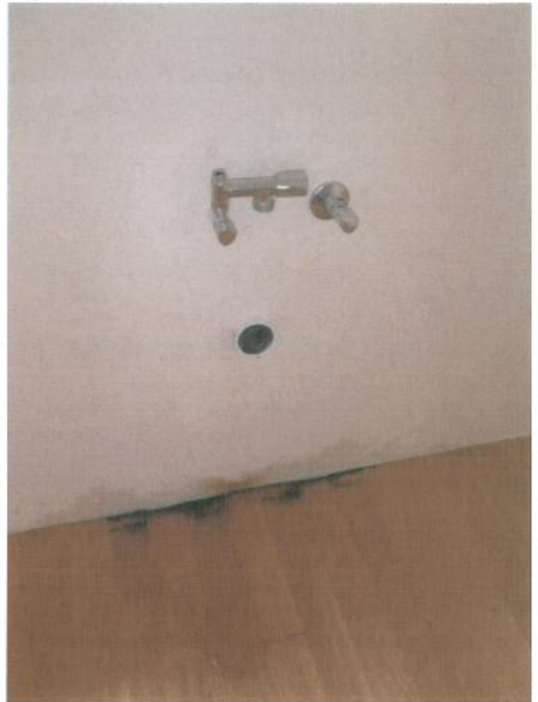
Bild 19, Platz Clouange 4 A, Erdgeschoss: Küche, Feuchtigkeitsschäden