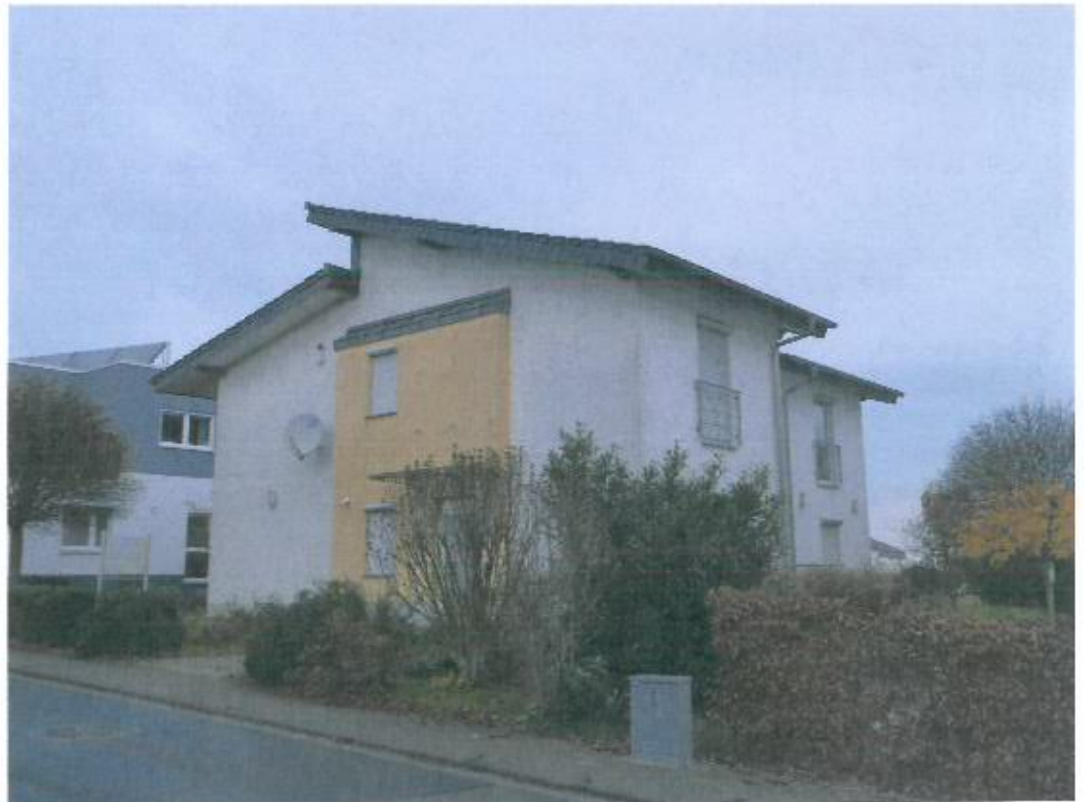
Bild 8, Platz Clouange 4 B, Straßenansicht An der alten Bach von Südosten