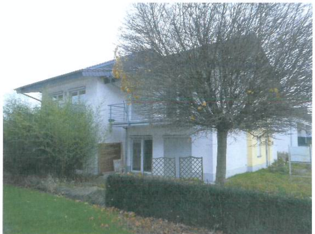
Bild 10, Platz Clouange 4 A / 4 B, Straßenansicht An der alten Bach von Südwesten