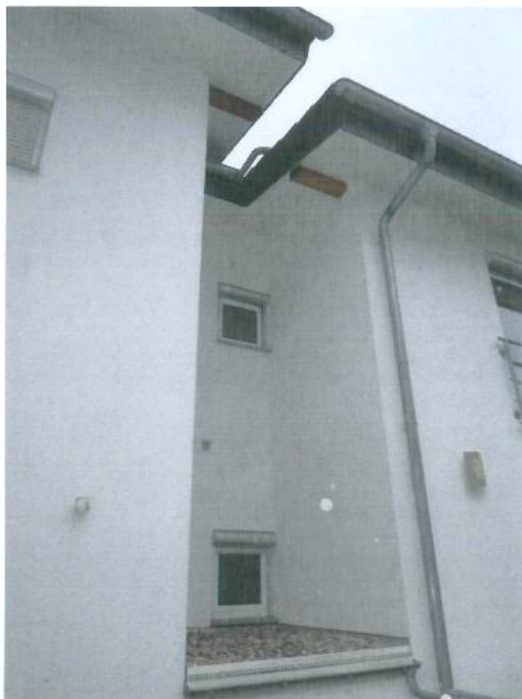
Bild 6, Platz Clouange 4 A / 4 B, Ansicht von Südosten