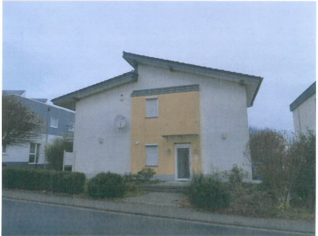
Bild 9, Platz Clouange 4 B, Straßenansicht An der alten Bach von Süden