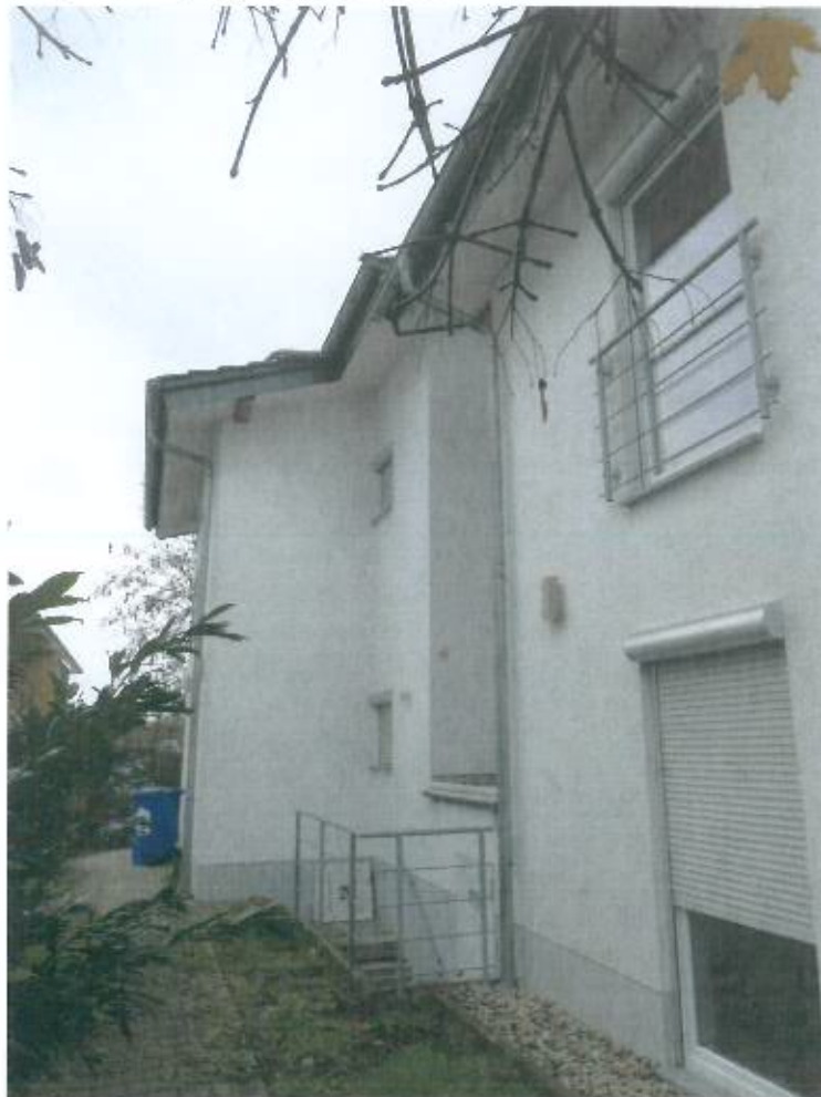
Bild 5, Platz Clouange 4 A / 4 B, Ansicht von Nordosten