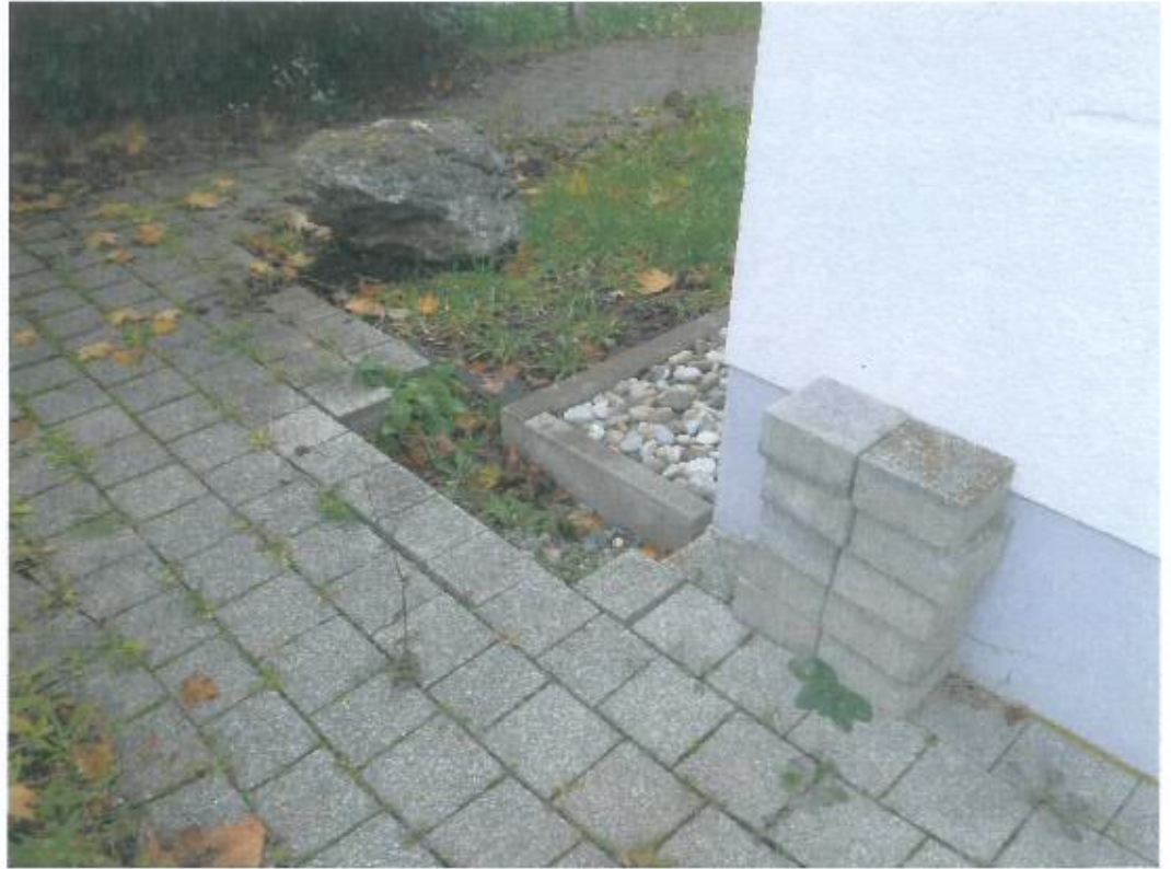
Bild 21, Platz Clouange 4 A, Schäden Zugangsweg