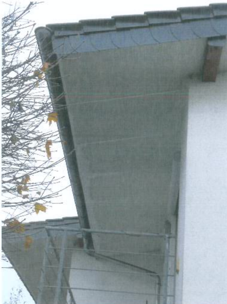
Bild 20, Platz Clouange 4 B. Feuchtig- keitsspuren an der Traufuntersicht