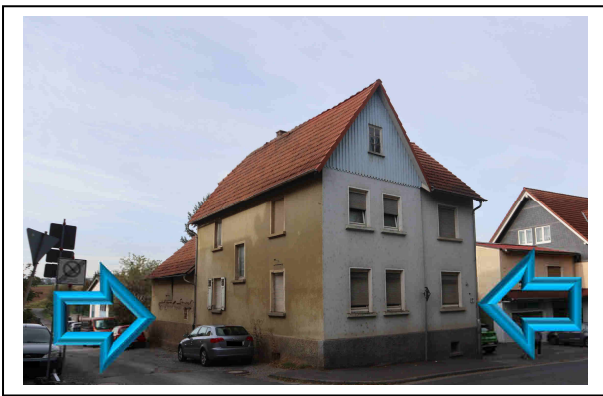
Straßenansicht (Wohnhaus mit Stall)