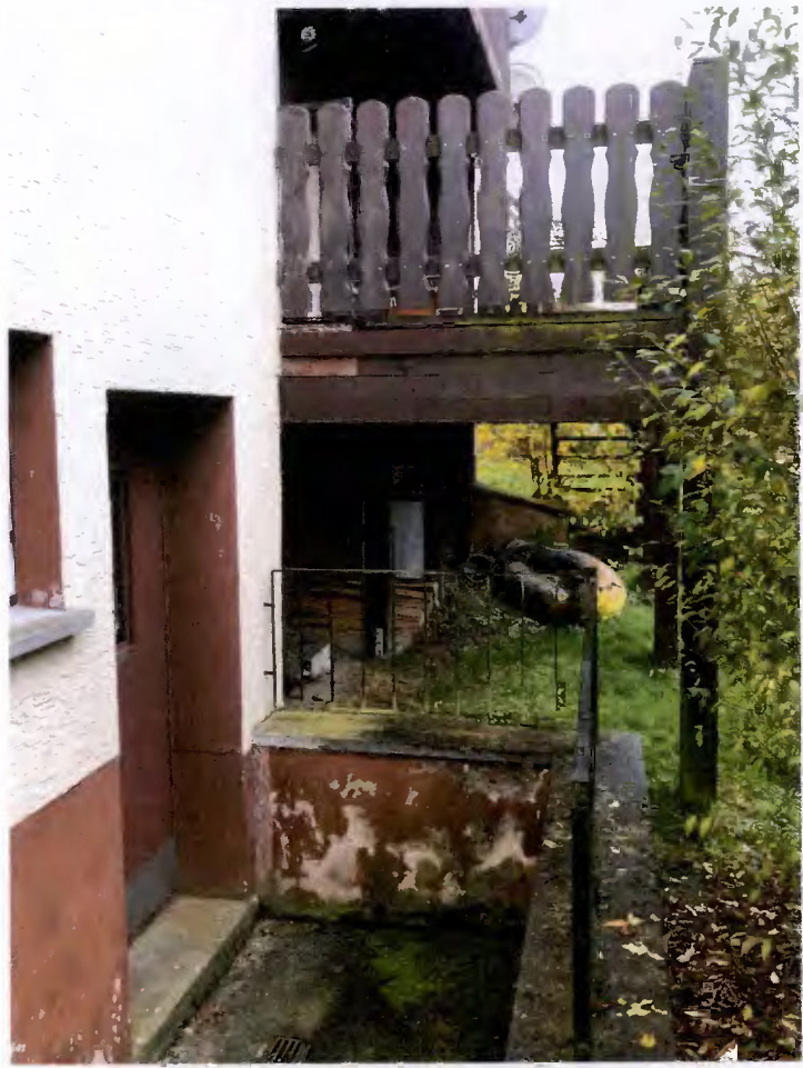
Bild 13 Kellerabgang, Feuchtigkeiten