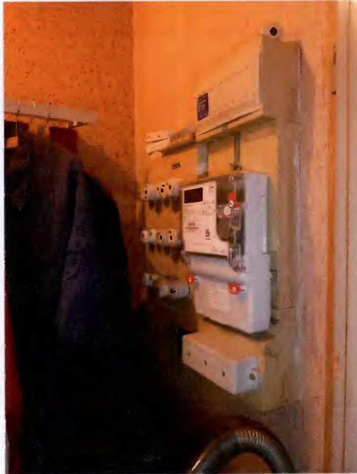
Bild 11 Elektro-Unterverteilung