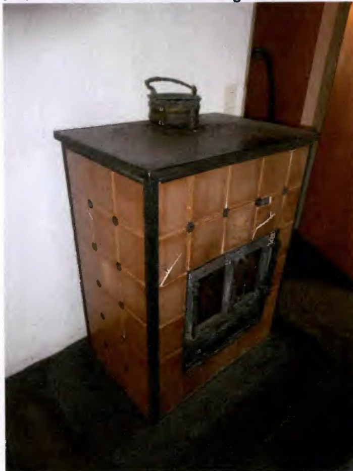
Bild 12 Erdgeschoss, Kachelkamin, Schäden in der Bekleidung