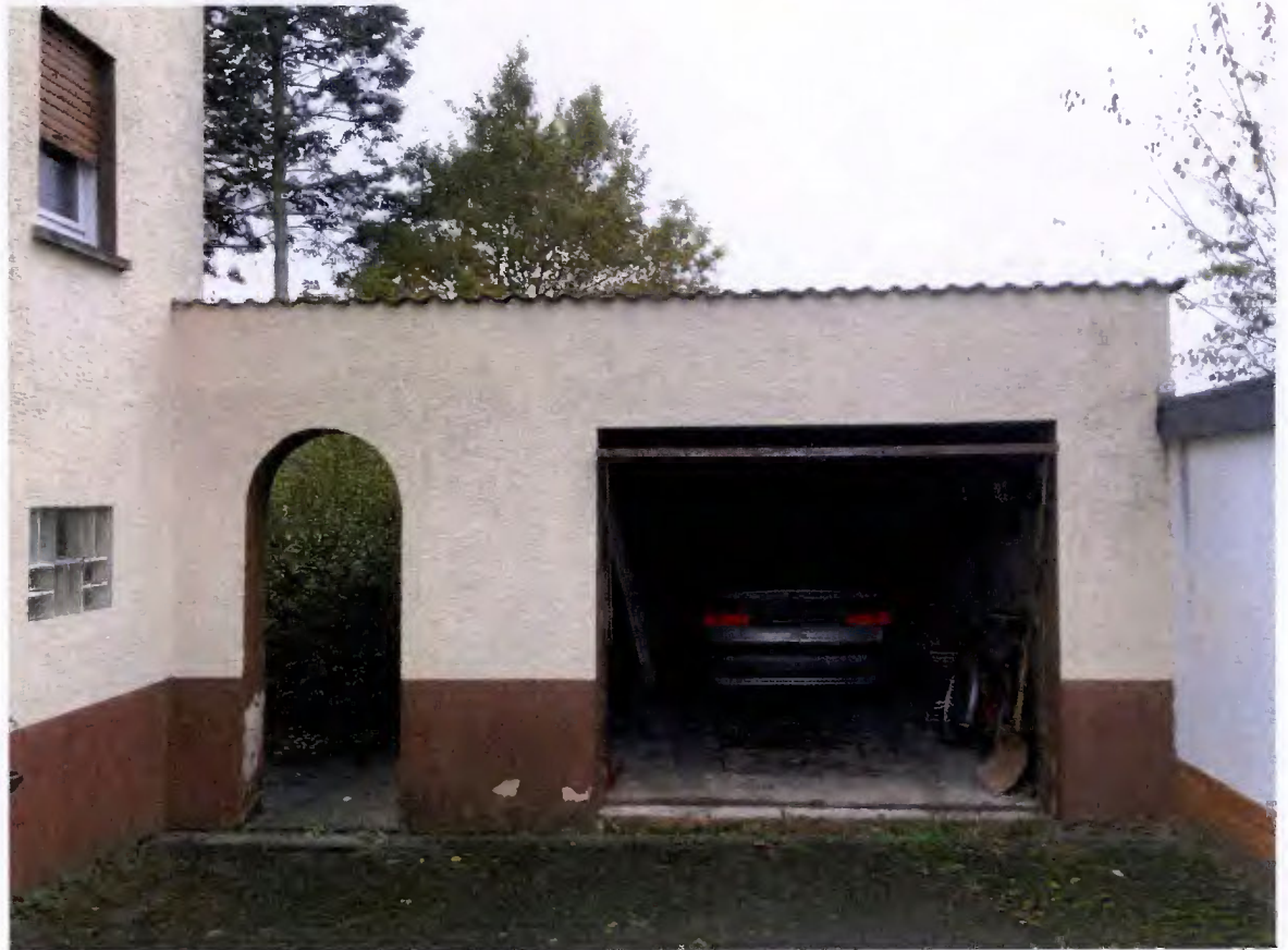
Bild 7 Garage, Hofansicht von Osten