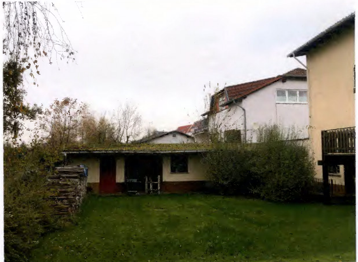
Bild 8 Garage/Schuppen, Gartenansicht von Süden