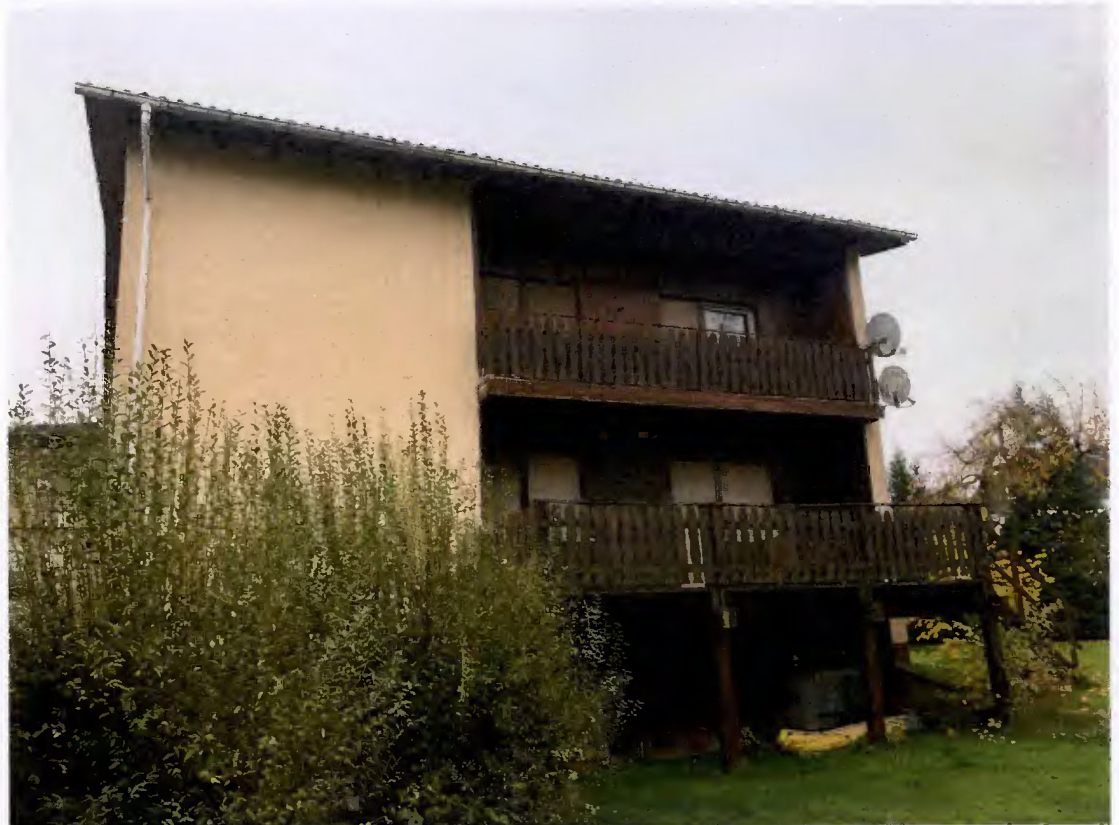
Bild 5 Gartenansicht von Westen