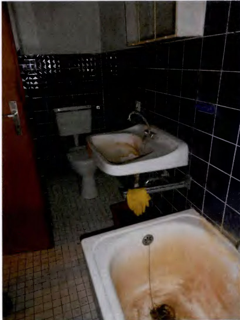
Bild 9 Erdgeschoss, Bad