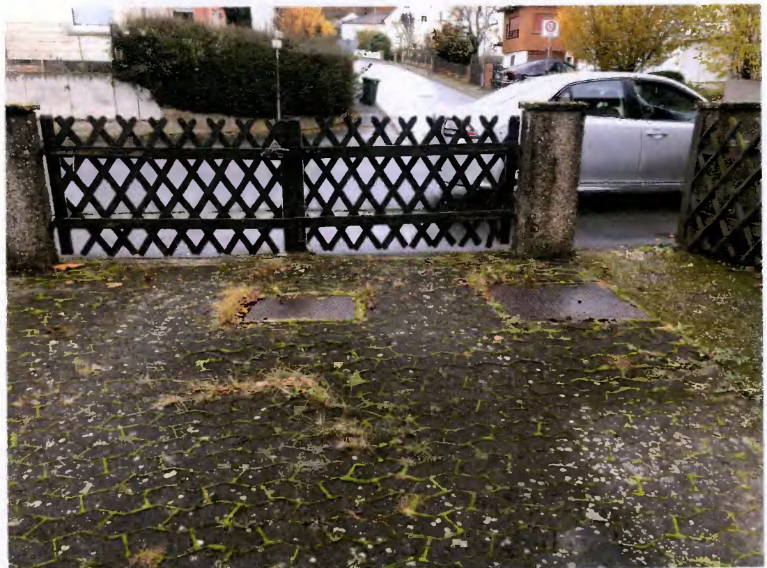
Bild 14 Hoffläche mit Setzungen und Einwachsungen