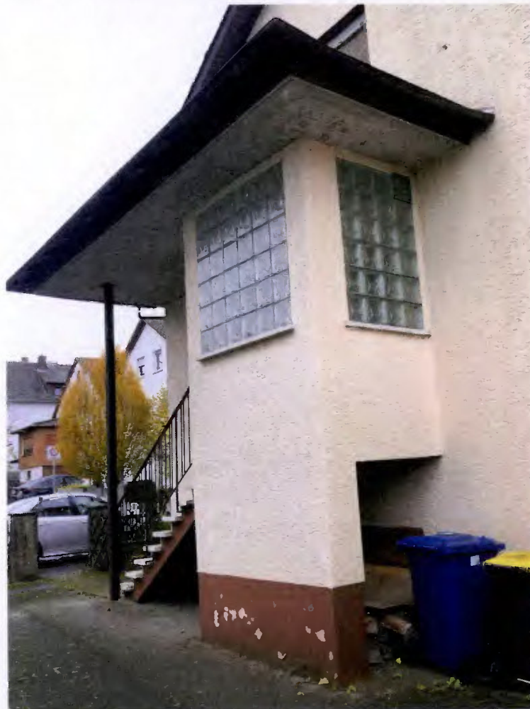
Bild 4 Eingangsbereich, Hofansicht von Nordwesten