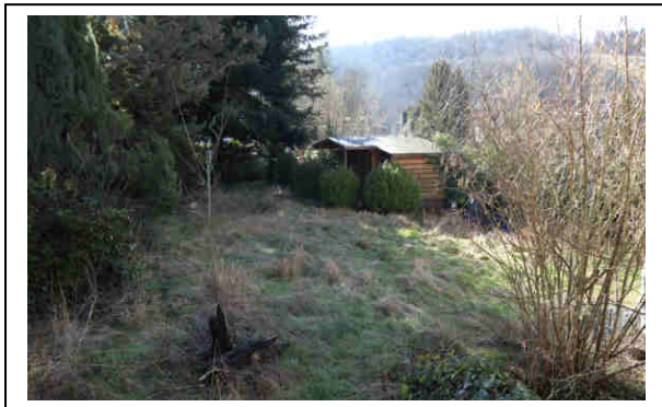
Gebäuderückseite (Flurstück 120/8)

Amtsgericht: Königstein Aktenzeichen: 095 K 002/2022