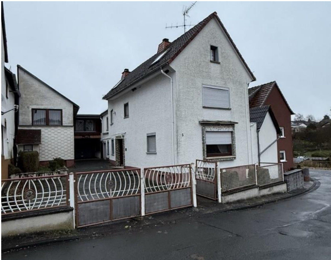
Straßenseitige Ansicht Flurstück 89