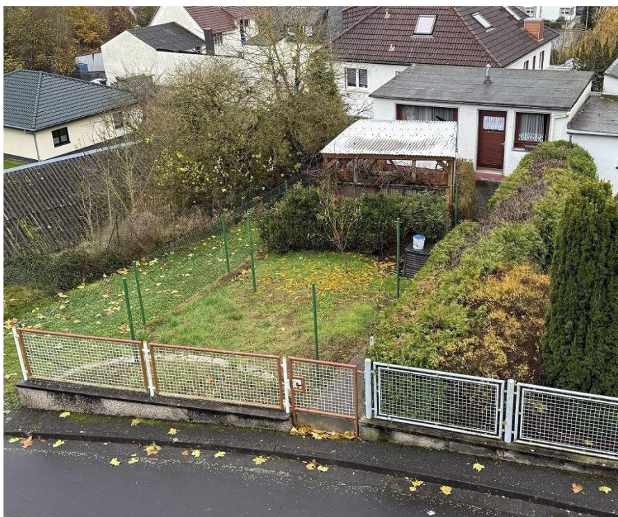
Blick vom Wohngebäude auf das Flurstück 63 (mit Gartenhaus und überdachtem Freisitz). Unter dem Gartenhaus befindet sich deckungsgleich die Garage, mit Zufahrt über das Flurstück 64