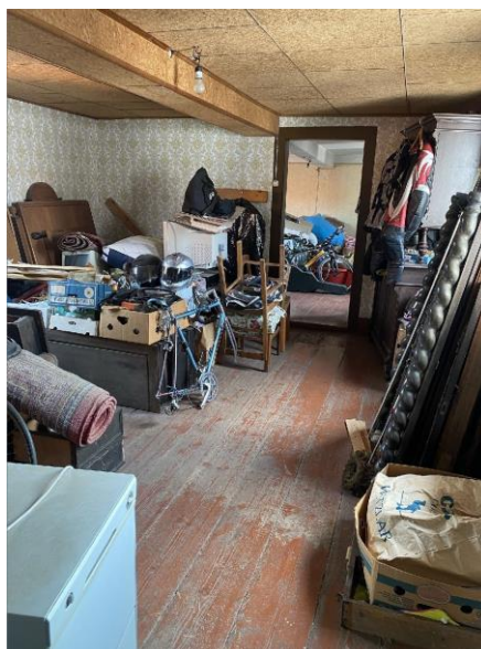
Beispielhaft ein Wohnraum