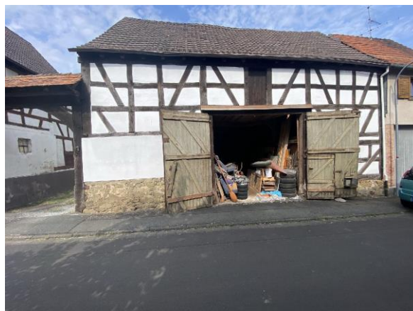
Straßenansicht der Scheune