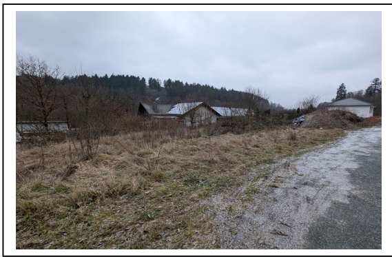
Straßenansicht (Blick auf die Bauplätze)