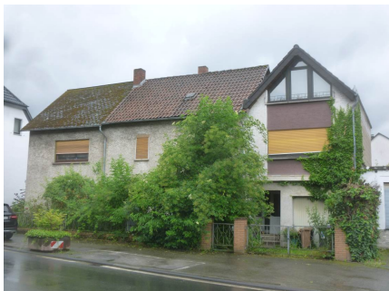
1. Ansicht von der Straße: