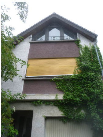
3. Ansicht Anbau: