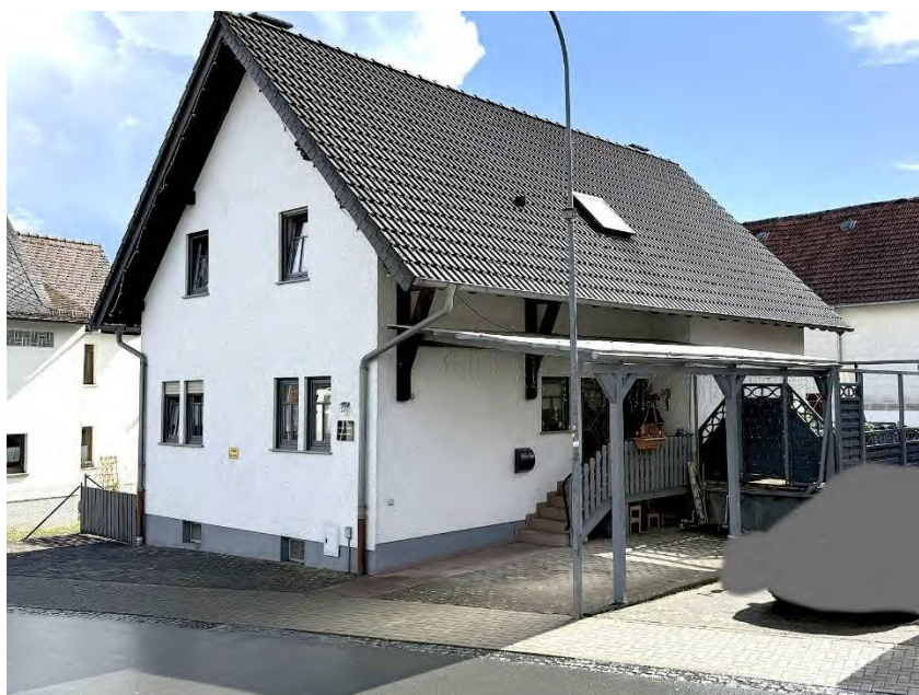
Straßenansicht des Bewertungsgrundstücks