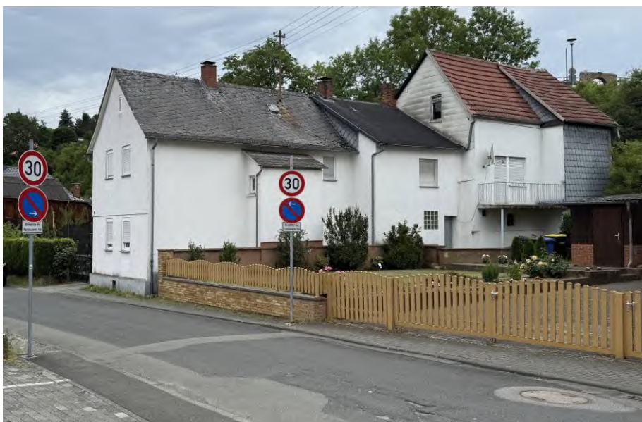
Südwestansicht des Bewertungsobjektes