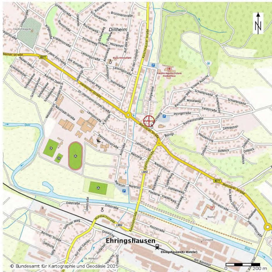
Auszug aus dem Stadtplan mit Kennzeichnung des Bewertungsobjektes (rotes Fadenkreuz)

Postleitzahl: 35630 Ort: Ehringshausen Straße: Stegwiese Hausnummer: 3