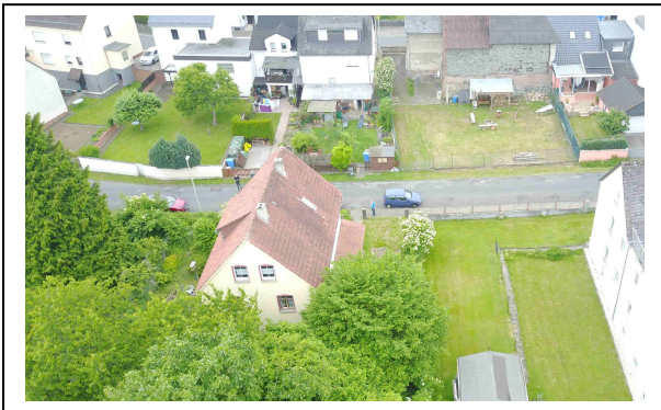
Gebäuderückseite (Aufnahmedatum 13.06.2017)

Amtsgericht: Weilburg Aktenzeichen: 078 K 008/2016